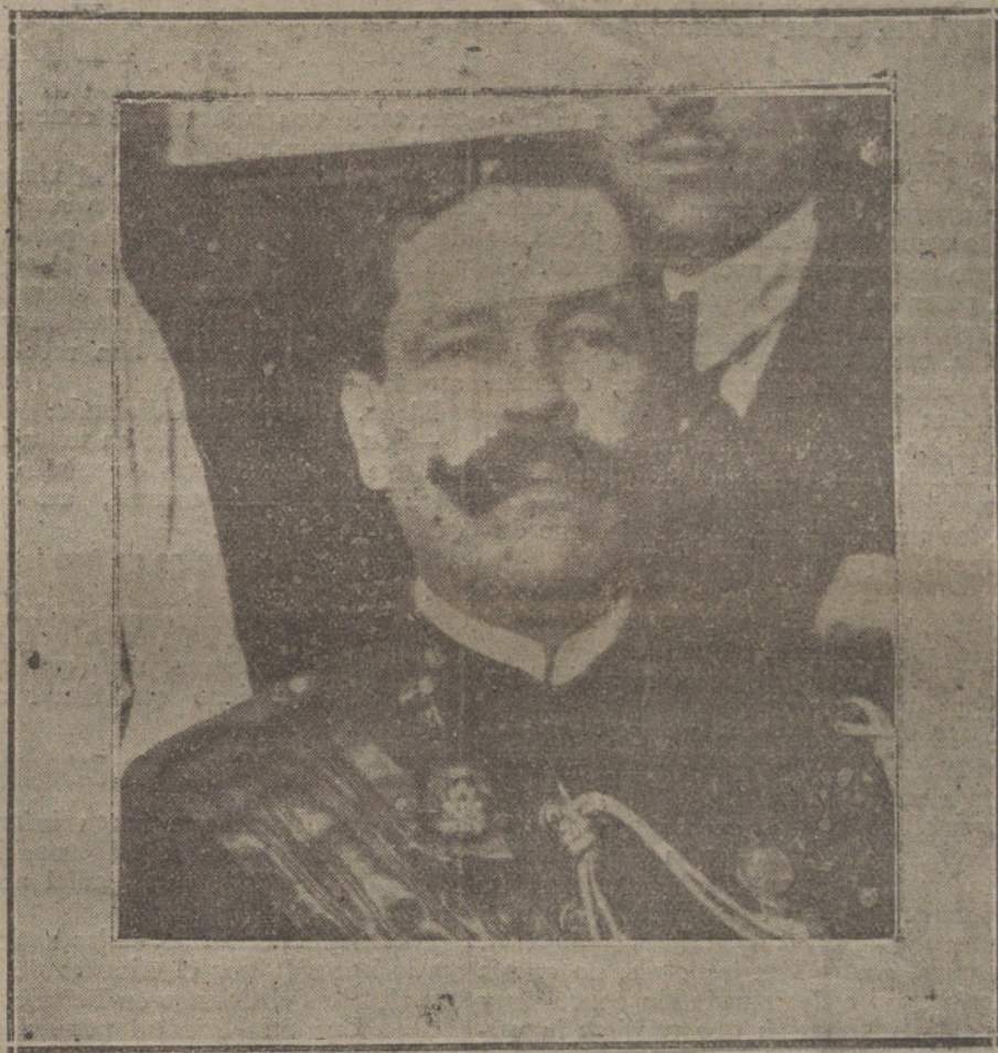
El general Fernández Silvestre, muerto heroicamente al frente de sus tropas en la posición de Armal.

me intriga organizada por naciones que vienen conspirando constantemente contra el porvenir de España. Los que nos tachaban de propagandistas de tal o cual política cuando durante la guerra manifestamos nuestras opiniones contrarias a que España luchara por la victoria de Francia, comprenderán ahora la razón que nos asistía.