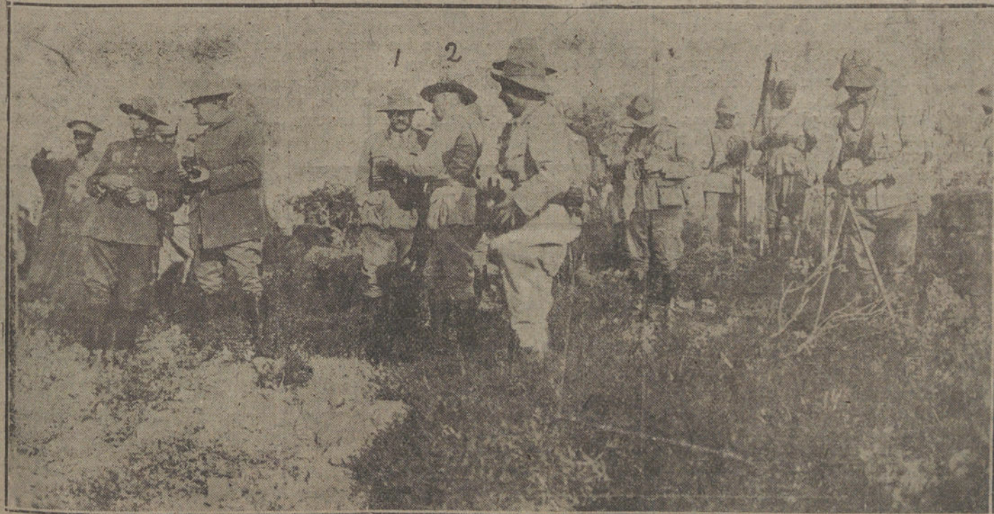
El general Berenguer (1), en la posición avanzada de Busuhuri, con el general Marzo (2), que mando la columna del centro, en las operaciones de Beni-Arós el día 16.