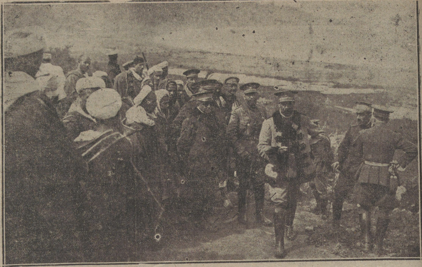
NUESTRA ACCION EN AFRICA. —El general Silvestre recorriendo los alrededores del morabo de Sid Dous, en las proximidades del Cabo Quilales, posición recientemente ocupada por las tropas que operan en Melilla.