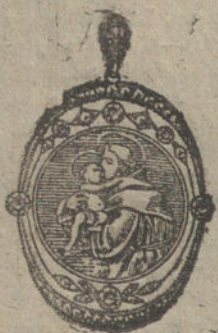
Núm. 1.—Seis brillantes y diamantes. Ptas. 325.

MONTURAS DE PLATINO FINO Y ORO DE LEY 18 QUILATES CONTRASTADO