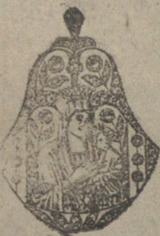
Núm. 6.—11 brillantes y diamantes. Ptas. 500.