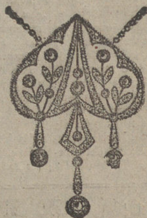
Núm. 3.—13 brillantes y diamantes. Ptas. 750.