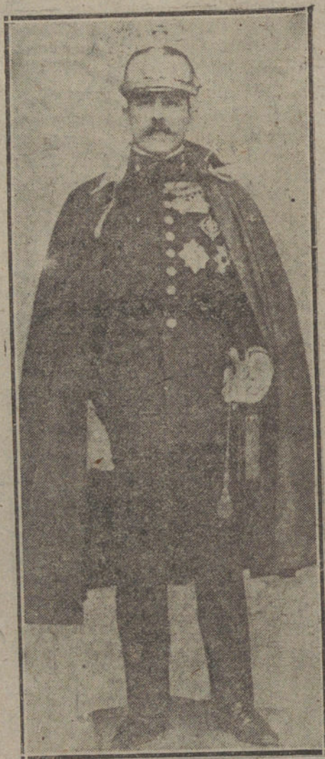
EL MARQUES DE CAVALCANTI, NUEVO COMANDANTE GENERAL DE MELILLA

Inmediatamente suspendió el repliegue y envió a la plaza a un capitán de su estado mayor para que diera seguridades al general Berenguer de que su orden sería cumplida.