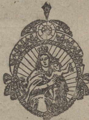
Núm. 8.—Seis brillantes y diamantes. Ptas. 600.