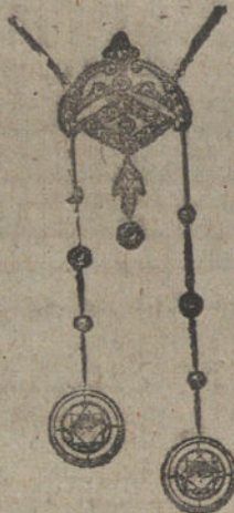
Núm. 11.—Siete brillantes y diamantes. Ptas. 1.175.