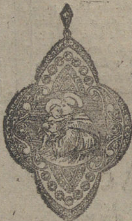
Núm. 12.—16 brillantes y diamantes. Ptas. 675.