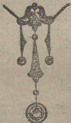
Núm. 7.—Cinco brillantes y diamantes. Ptas. 1.000.