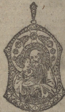
Núm. 10.—Siete brillantes y diamantes. Ptas. 550.