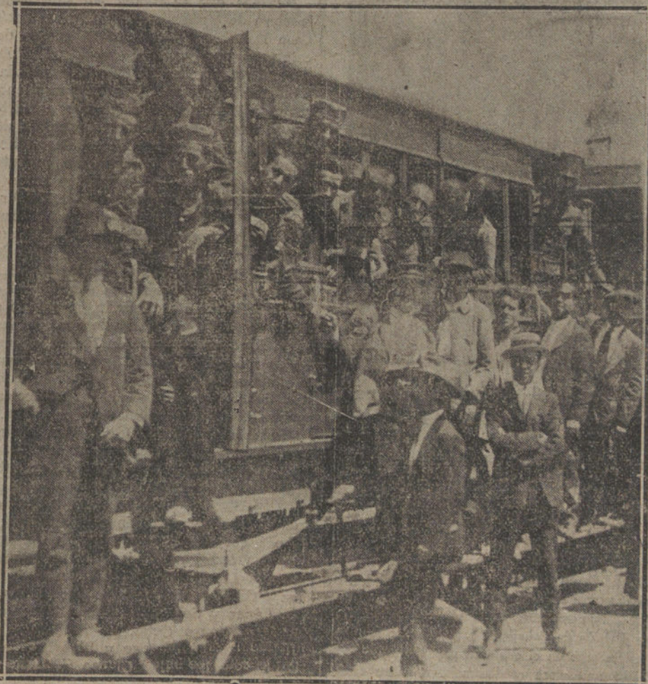
EMBARQUE DE TROPAS PARA MARRUECOS, EN LA ESTACION DEL MEDIODIA

El infante D. Alfonso, hijo del infante don Carlos, que marchó anoche con los húsares,