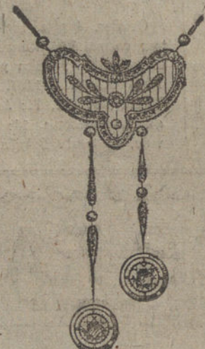
Núm. 13.—10 brillantes y diamantes. Ptas. 1.475.