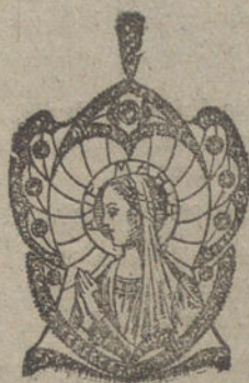
Núm. 2.—Nueve brillantes y diamantes. Ptas. 425.