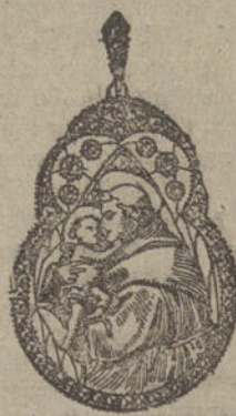
Núm. 4.—Seis brillantes y diamantes. Ptas. 450.