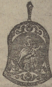
Núm. 5.—Seis brillantes y diamantes. Ptas. 400.