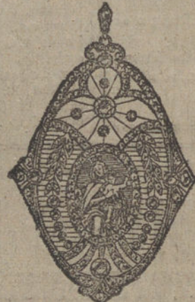
Núm. 14.—19 brillantes y diamantes. Ptas. 725.