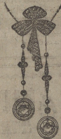
Núm. 15.—Nueve brillantes y diamantes. Ptas. 2.000.

Factura de garantía en todas las compras