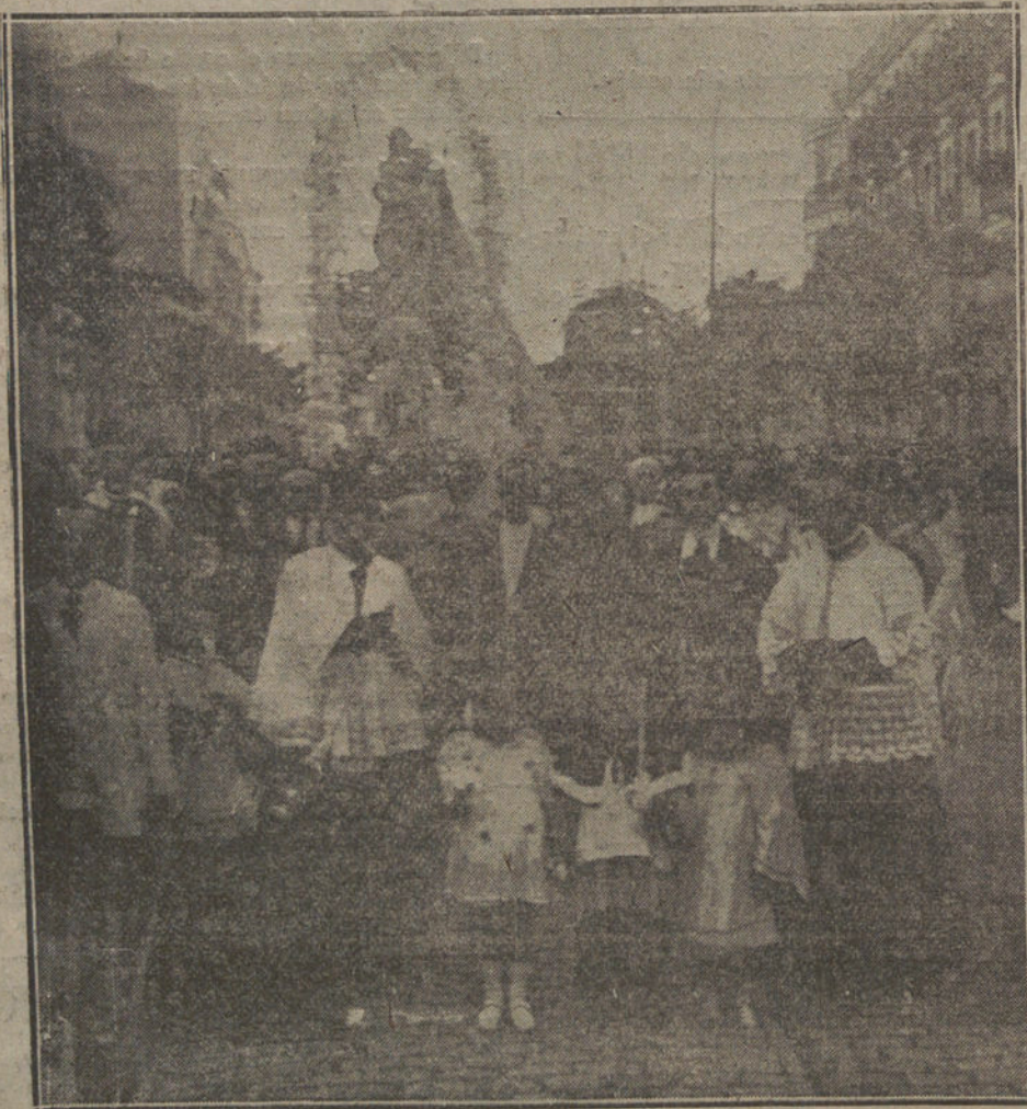
LA PROCESION DE LA VIRGEN DE LOS ANGELES, CELEBRADA AYER TARDE