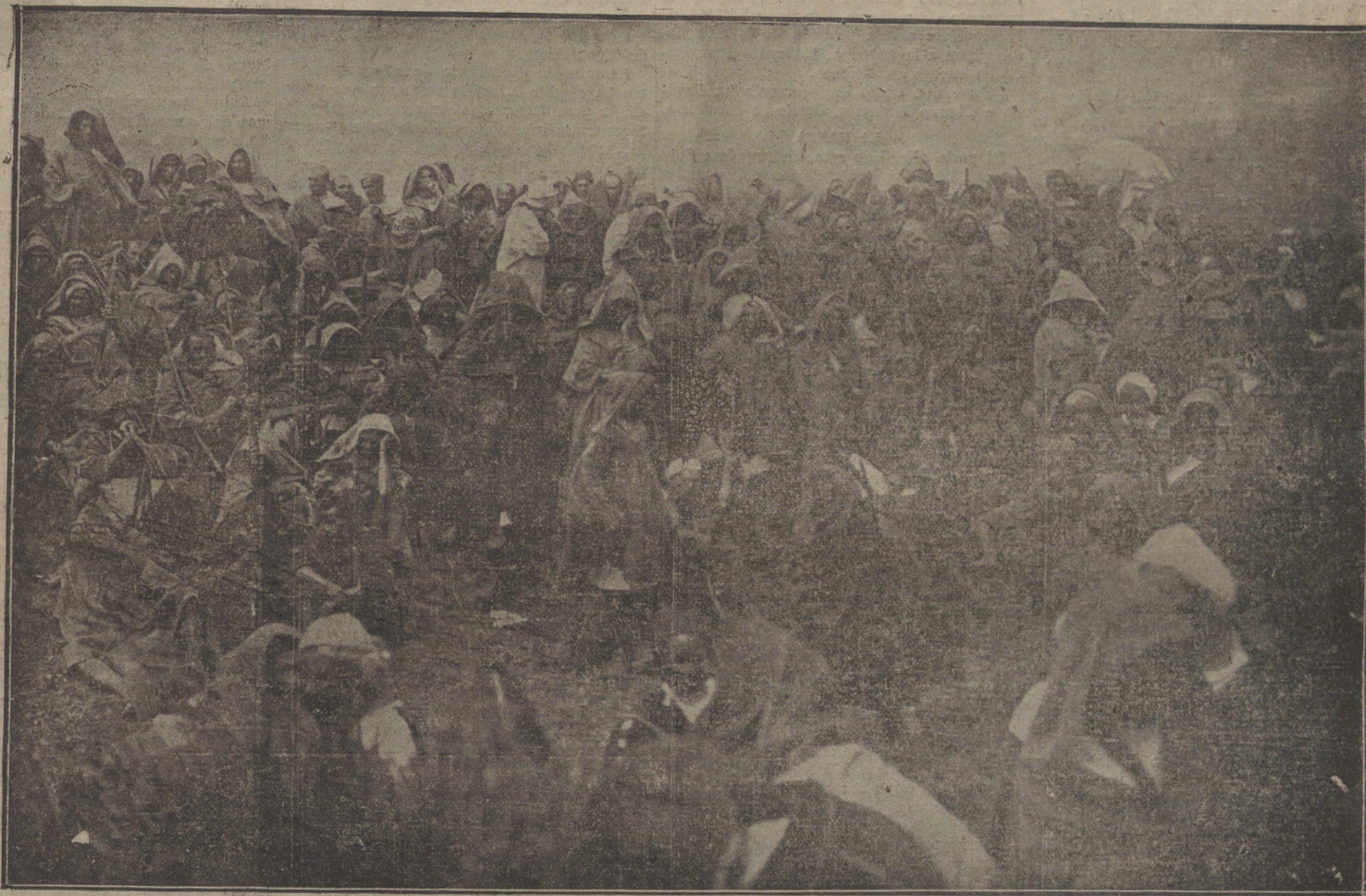
Aspecto de una harka, reunida por Er-Raisuni en las proximidades de Beni-Arós. En el fondo, a la derecha, el propio Raisuni, bajo quita-sol, emblema de su jerarquía.

¿Se declara el estado de guerra en España?