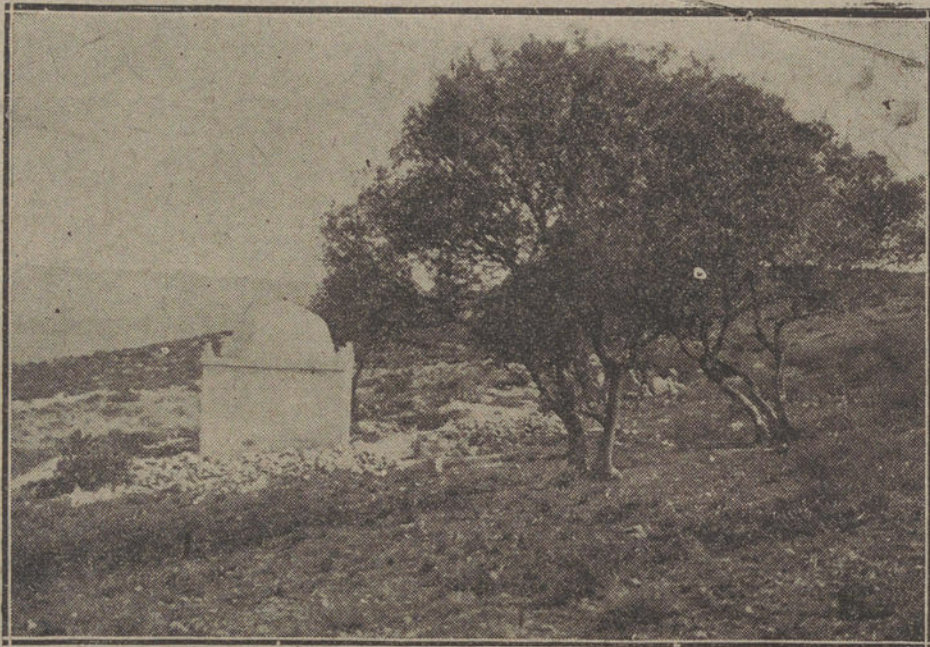
El Santuario y cementerio moro de Sidi-Bachir, en el Haraig. Punto extremo del Sur donde había llegado nuestra influencia.

A la cuestión política, como decimos antes, por estar ya todo convenido y previsto, sólo dedicaron los ministros los minutos que empleó el vizconde de Eza en poner de relieve la actitud de los generales y su decisión.