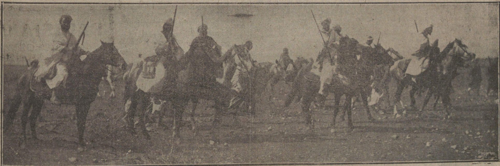
Jinetes de Regulares indígenas; tropa que se ha pasado al enemigo, contribuyendo a la fácil victoria de la harca.