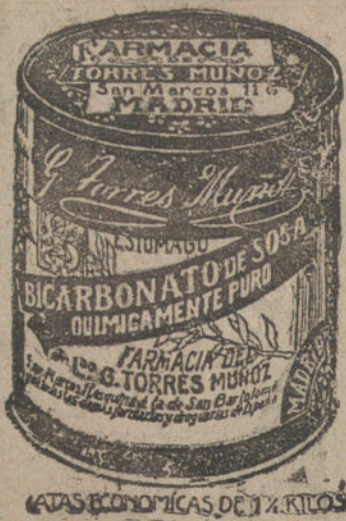
LATAS ECONÓMICAS DE 174 KILOS