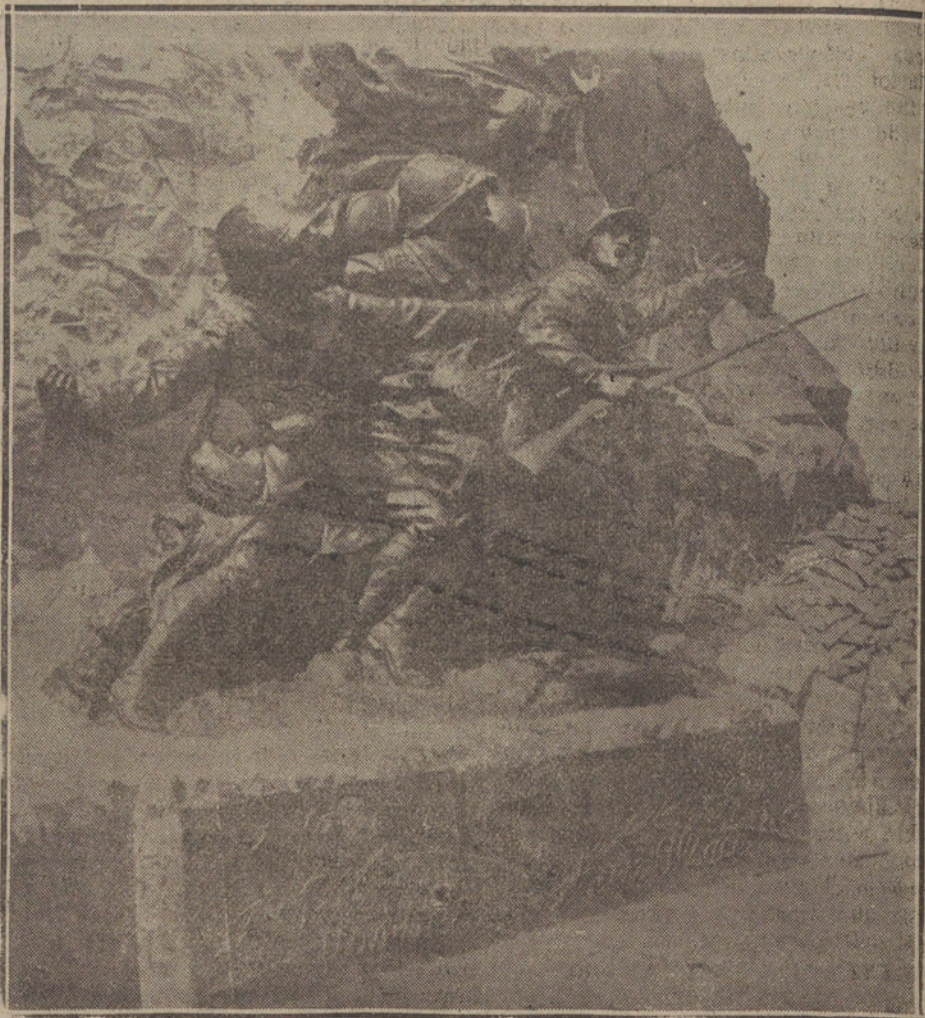
Monumento que acaba de inaugurarse, dedicado a la famosa batalla de Hartmannsweilerkopf, en la que hubo más de 60.000 víctimas.

Preguntado el Sr. Sánchez de Toca sobre el problema de Melilla, contestó que se remitía a las declaraciones que hiciera hace tiempo en su folleto relativo a los problemas de gobierno.