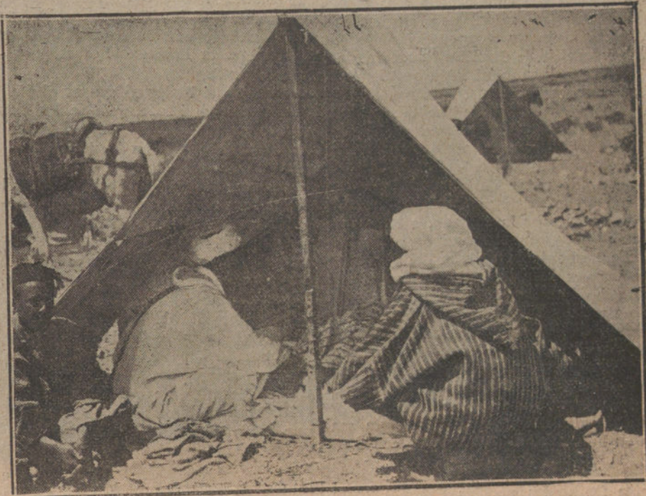
Una tienda de telas en el zoco del Had de Monte-Arrui, situado en los egidos del pueblo, donde ahora combate la columna del general Navarro.

El hijo del Jetabí estaba entonces en Melilla, ocupando un puesto en las oficinas de asuntos indígenas. Sufrió un dolor muy grande; pero no lo dejó traslucir. A poco, según se asegura, una delegación de notables urriagas fué a la plaza con el exclusivo objeto de ofrecer al hijo del di-