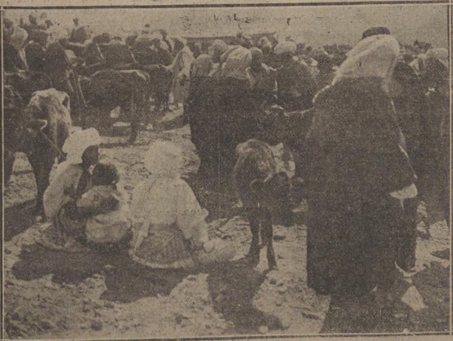
Una escena del zoco del Had de Beni-Chicar, ocupado hoy por nuestras tropas, y donde se ha combatido duramente.

«Esta mañana se ocupó la Restinga, desembarcando tres compañías de San Fernando recién organizadas, ametralladoras de Cerriola, una compañía de Ingenieros y media de Regulares de Melilla, protegidos por fuego de la escuadra; la antigua posición estaba ocupada por unos 25 hombres, que rompieron fuego contra los botes; pero fueron desalojados por los cañones de la escuadra y la energía con que se lanzó al ataque la media compañía de regulares, que fué la primera en desembarcar. Ha quedado, pues, ocupada la Restinga con las fuerzas enumeradas que allí se fortificaron, sin haber tenido ninguna baja. Los barcos han quedado