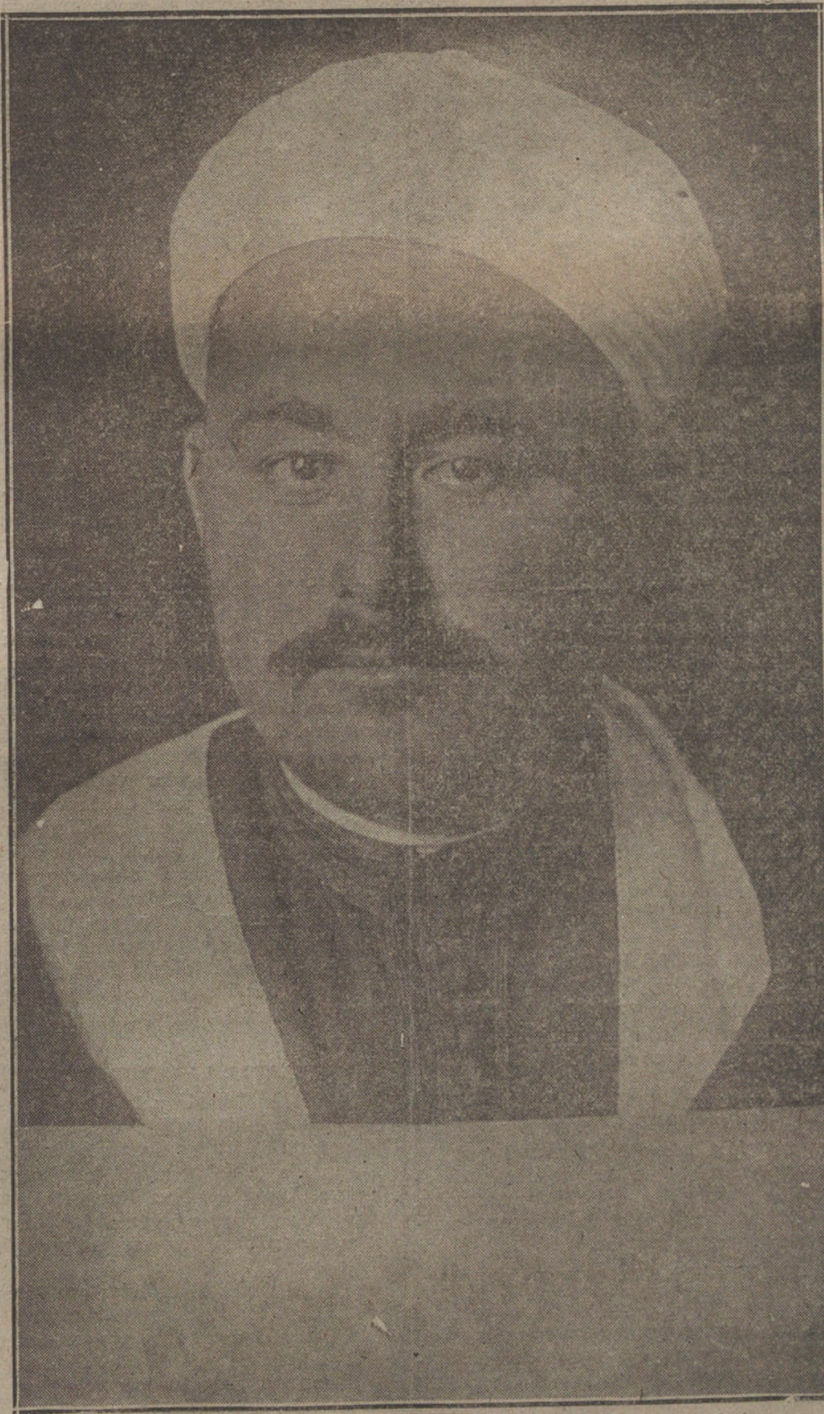
Mohamed-Ben-Abd-el-Krim, el Jetabí, chej de Beni-Urriaguel, jefe de la harca enemiga, hoy tristemente famoso para España.