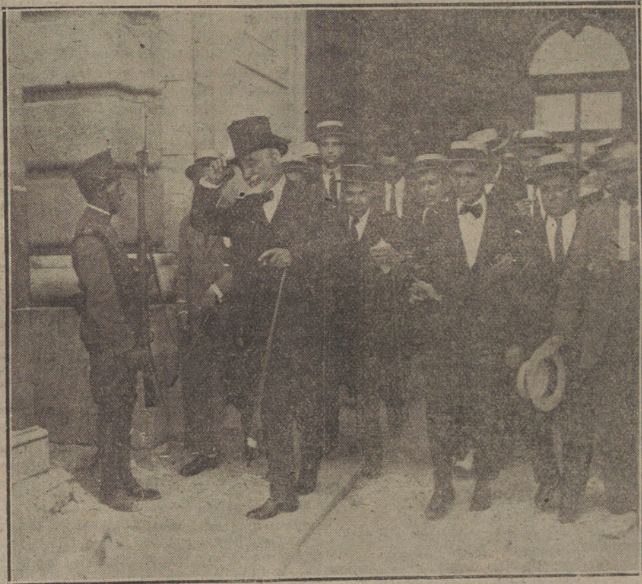
D. Antonio Maura al salir de Palacio después de haber sido consultado por S. M. acerca del problema de Marruecos.

De las manifestaciones del Sr. Allendesalazar se desprende que solamente será llamado a hoy a consulta un solo personaje; el conde de Romanones.