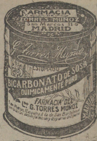
LATAS ECONOMICAS DE 1/2 KILOS