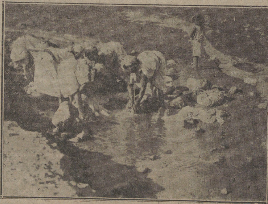
EN LA ANTIGUA LINEA DEL KERT.—Moras lavando las ropas en el río.

Los rebeldes le persiguieron, hasta que logró ocultarse en un almiar, y allí esperó la noche. Favorecido por las tinieblas, ganó Mar