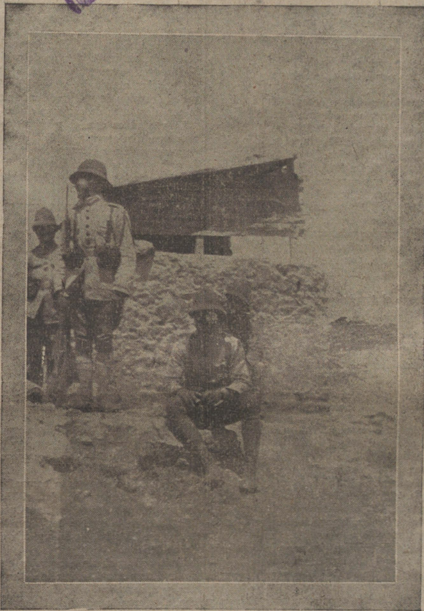
Un bloqueo en el Gurugú

táctica, aplicada en un terreno que tanto conocen y aprovechan, y siempre les favorece en los sitios que ocupan para disparar sus armas tan distintas y que prefieren a nuestro máuser. «Estos no matan—dicen—; quieren el buun...» Es, sin duda, refiriéndose al mayor calibre de menor alcance, pero para ellos de «mejor efecto»; su parda chilaba, echados, les oculta a nuestras líneas de miras, siendo apreciada su situación muchas veces sólo por el humo que dejan disparar entre disparos; su extensa línea de fuego es larga, porque, esparcidos, presentan mucho frente, débil, al parecer, en todos sus puntos, haciendo creer que hay poco enemigo, el cual aumenta considerablemente en número cuando «dejan acercarse»; entonces parece que de cada accidente del terreno surgen repentinos «racimos de hombres», que resueltos atacan briosamente si ven inferioridad en el adversario o causa que les pueda producir una ocasión de victoria; las emboscadas son su ataque favorito; se ocultan para caer sobre el indefenso que transita; nuestra escolta y descubiertas han sido sorprendidas muchas veces por su «confianza», descuidando su atención y precaución, debido a la nobleza de nuestros soldados que no sospechan la traición de los que habitan el territorio ocupado; esperan escondidos de-