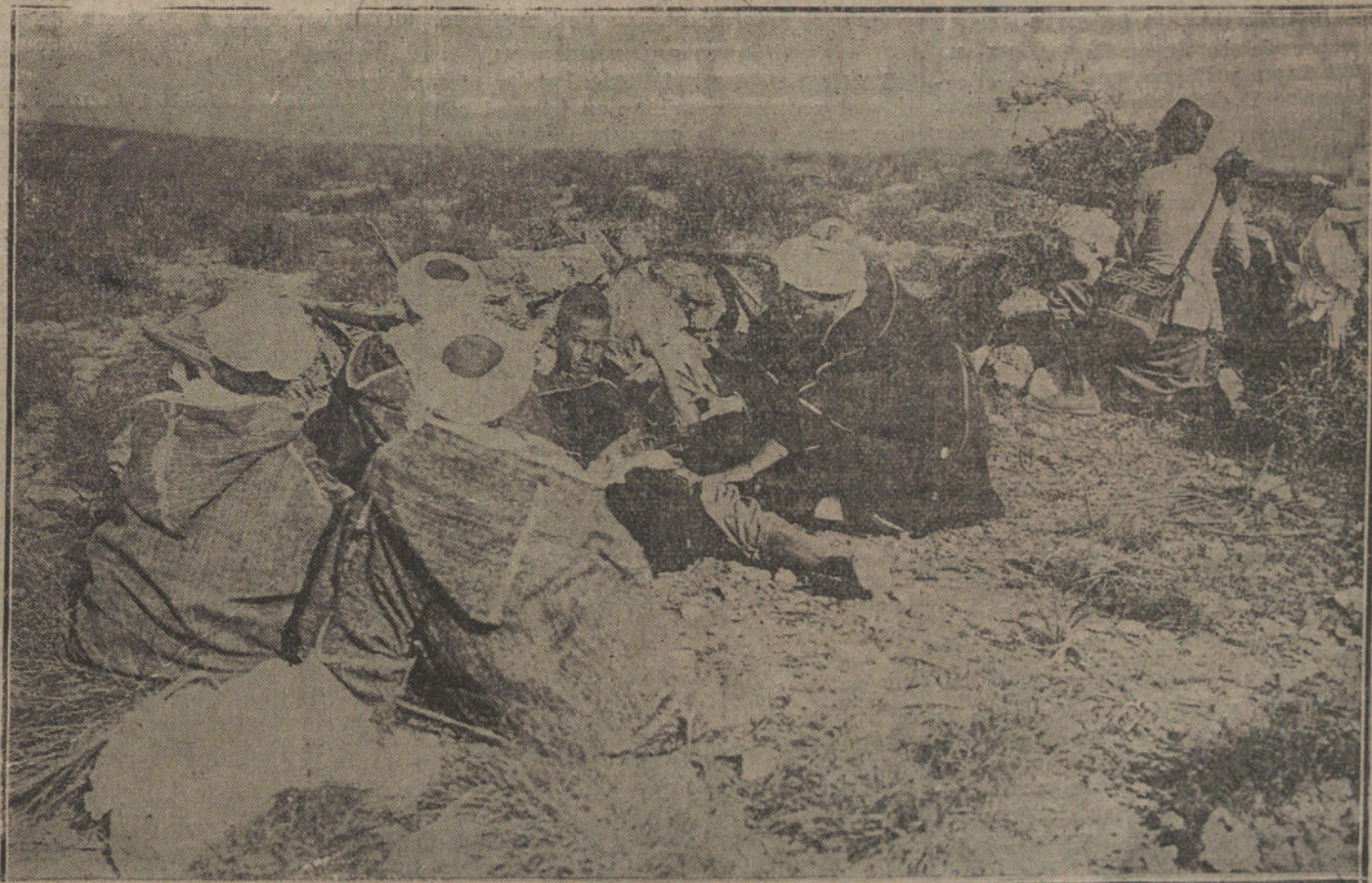
Combates de trinchera: La Policía indígena se bate en Beni-Chicar. Momento de ser herido uno de los askaris.

Se espera que muy en breve, de hoy a mañana, Melilla pueda tributar a los bravos