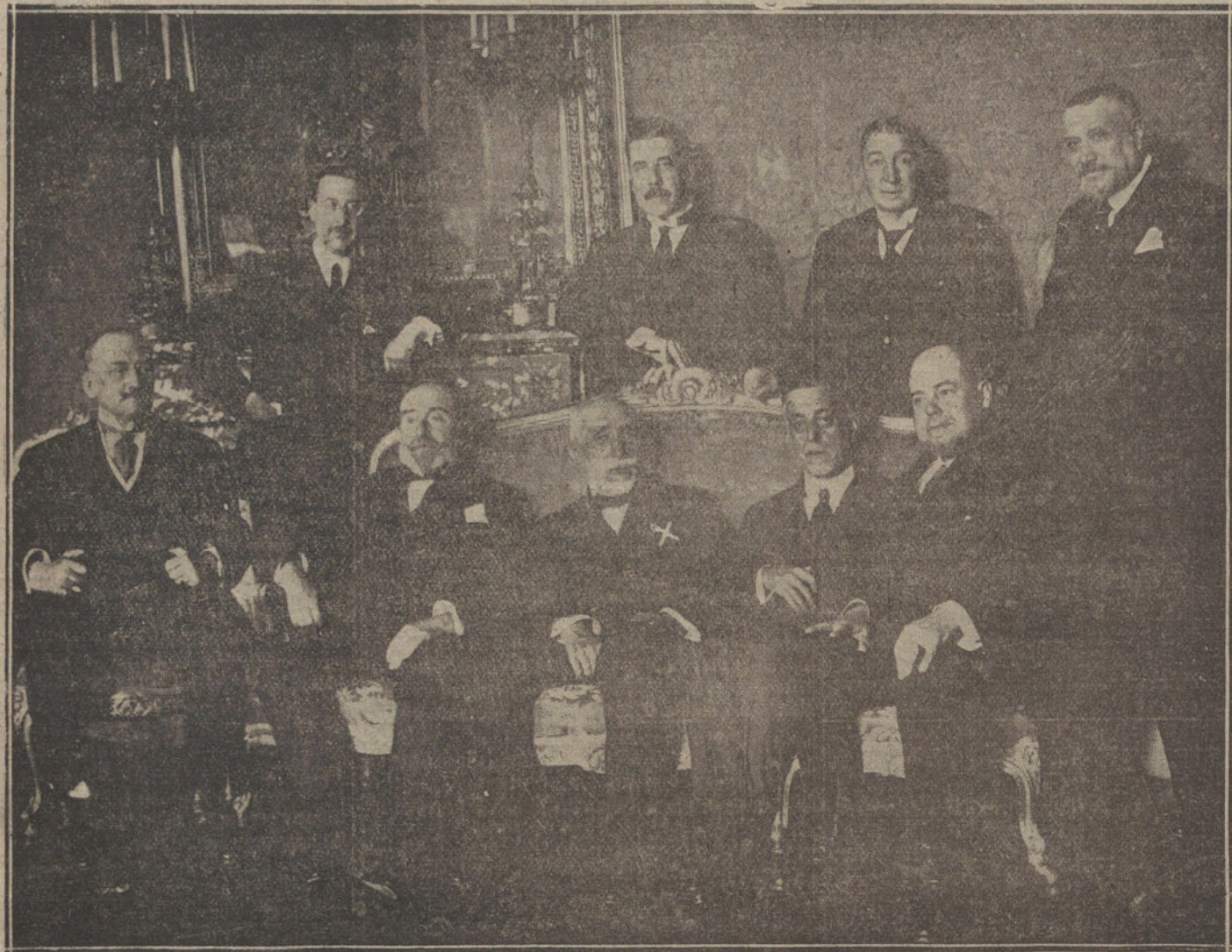
El nuevo Gabinete, presidido por D. Antonio Maura (X), reunido por primera vez en la Presidencia.

Cambó no aceptará la cartera de Hacienda