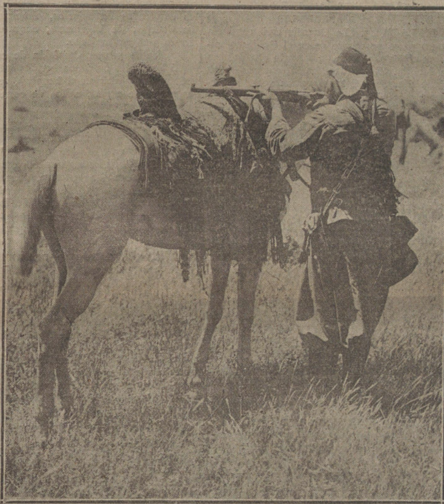
Cómo se bate la caballería de Regulares: el caballo sirve de parapeto.