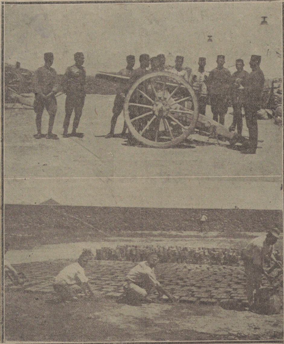
MELILLA.—Campamento del zoco Tlatsa. (1) Un teniente de Artillería instruyendo a los artilleros para la defensa del campamento.—(2) Soldados del 68 de línea construyendo adobes para reforzar los parapetos.