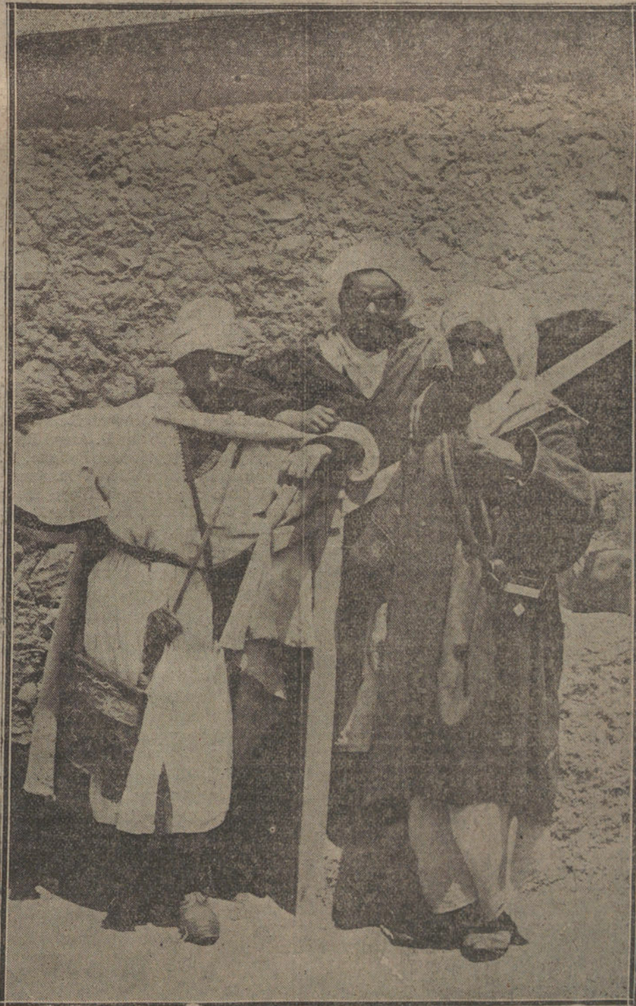
MELILLA.—Moros jefes de la región de Tíatsa, que al frente de su cabila atacaron el campamento del zoco.

Pero esto y lo otro, oficialidad y armamento, merecen un capítulo aparte.