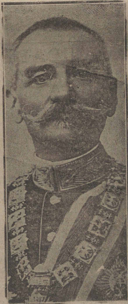
PEDRO KARAGEORGEVIT, EX REY DE SERBIA, QUE HA FALLECIDO

Durante la guerra europea, producida por el asesinato del archiduque de Austria y su esposa por unos estudiantes serbios, distin-