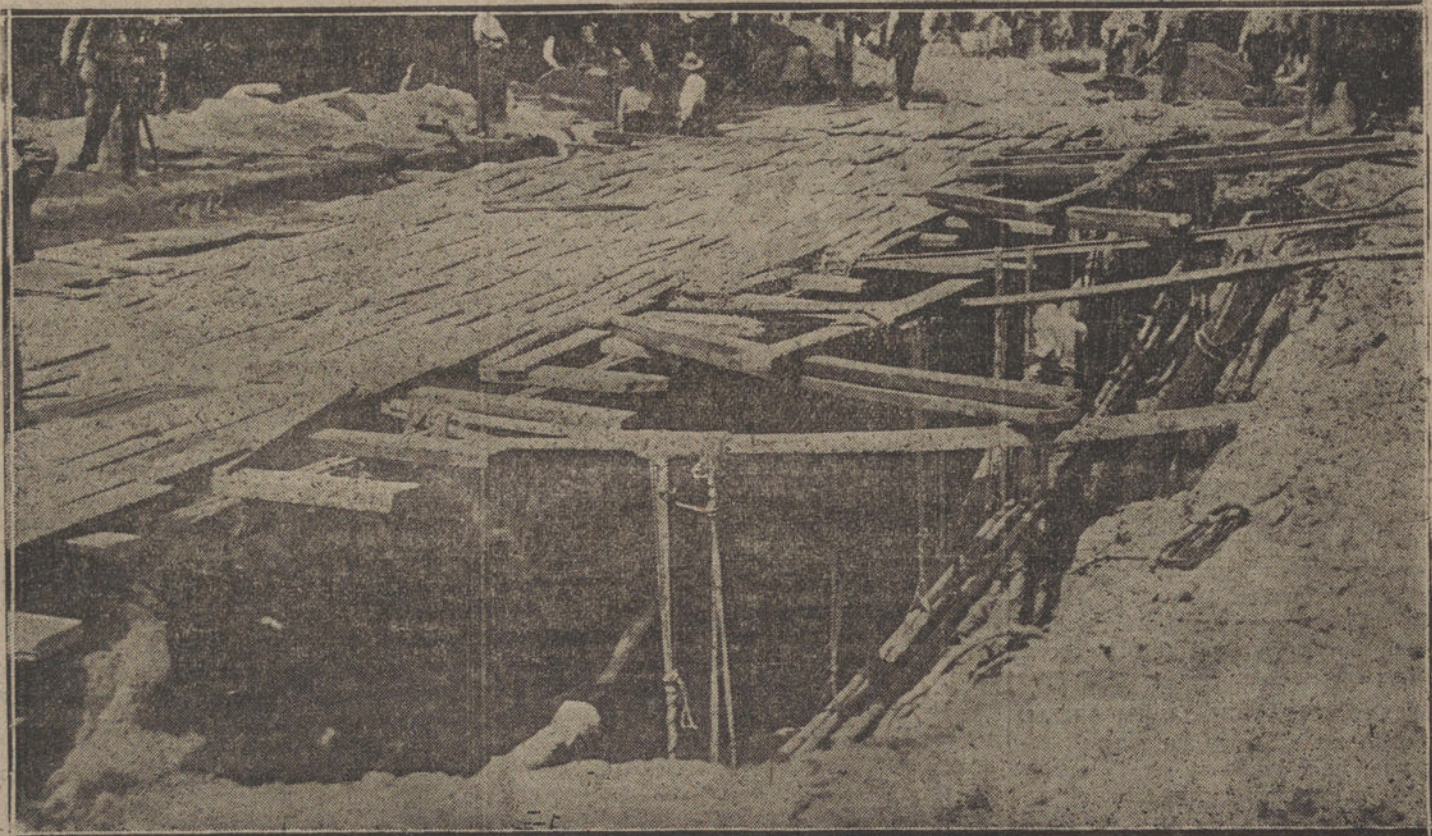
Aspecto que ofrece el trozo hundido de la calle de Atocha, a causa de las obras del Metropolitano.

En la calle de Atocha, y en el trozo comprendido entre la calle de San Eugenio y la Costanilla de los Desamparados, ocurrió anoche, momentos después de las diez, un hundimiento, que en pocos instantes adquirió alarmantísimas proporciones, hasta el extremo que hubo necesidad de dar aviso rápidamente a los bomberos, presentándose en el lugar del suceso momentos después, al mando de su jefe, D. Joaquín Monasterio.