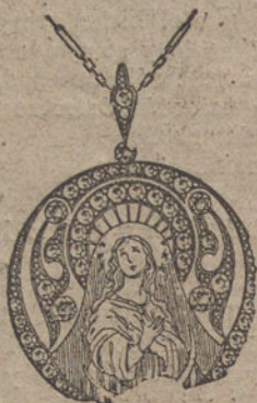
Núm. J. 170.—Medalla oro y platino, cinco llantes, 42 rosas. Pesetas 475.