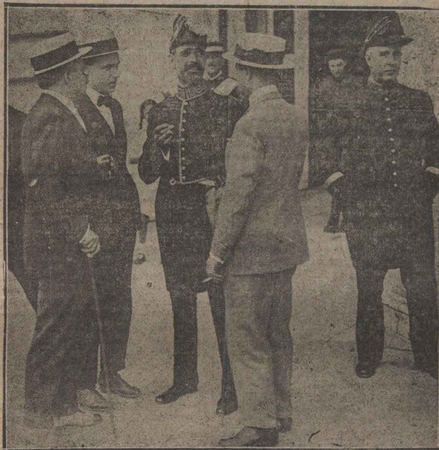
El nuevo ministro de Hacienda, Sr. Cambó, saliendo de Palacio después de haber jurado el cargo.

El tren llegó con retraso a causa de un accidente ocurrido en la estación de Sarriá.