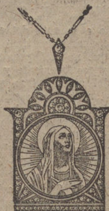
Núm. J. 1.285.—Medalla oro y platino, 67 rosas, primera calidad. Pesetas 550.

Relojería de precisión de todas clases y formas modernas, tanto en relojes de bolsillo como en pulseras.—Envíos por correo a todas partes remitiendo su importe.