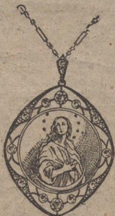
Núm. J. 1.972.—Medalla oro y platino, ocho brillantes y 14 rosas. Pesetas 555.