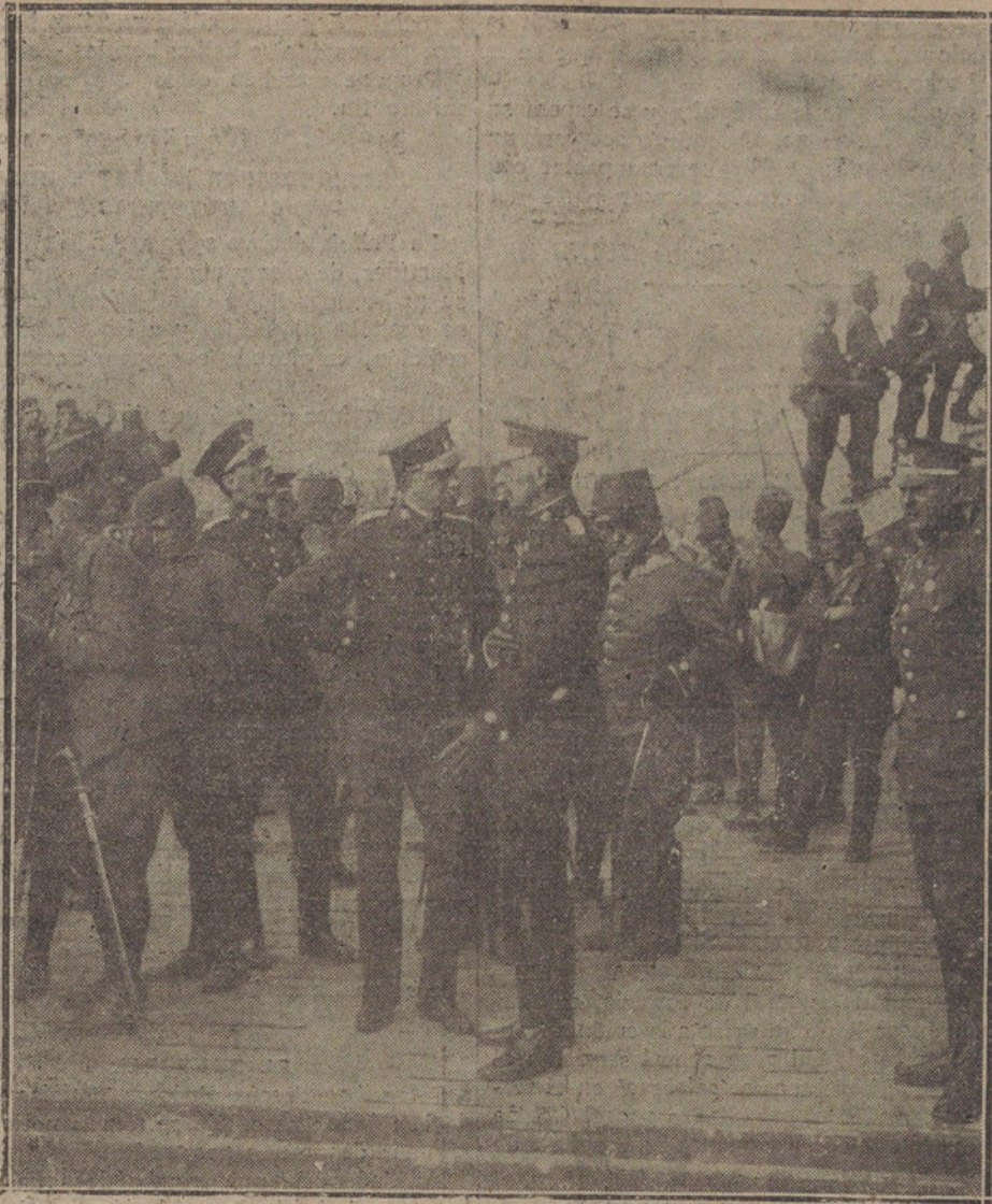
SANTANDER.—Embarque para Marruecos, a bordo del «Legazpi», del regimiento de Talavera. S. A. el infante D. Fernando presenció el embarque.

abierta para regalar un aeroplano al Ejército.