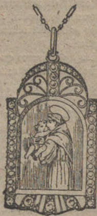
Núm. J. 8.459.—Medalla oro y platino, brillantes rosas y piedras finas. Pesetas 225.

Venta al por mayor y menor.--Exportación a provincias y América