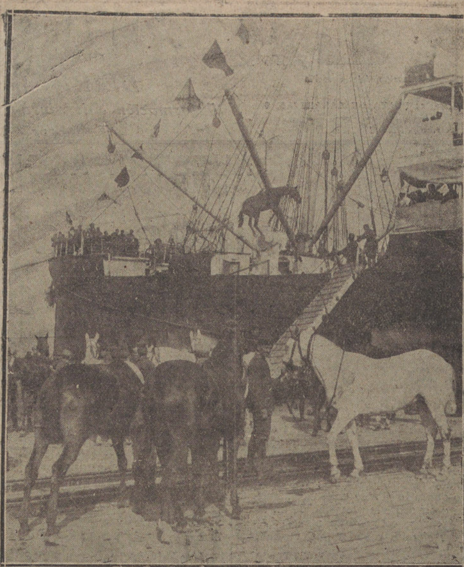
SANTANDER.—Embarque para Marruecos, a bordo del «Legazpi», del regimiento de Talavera. Embarcando caballos.