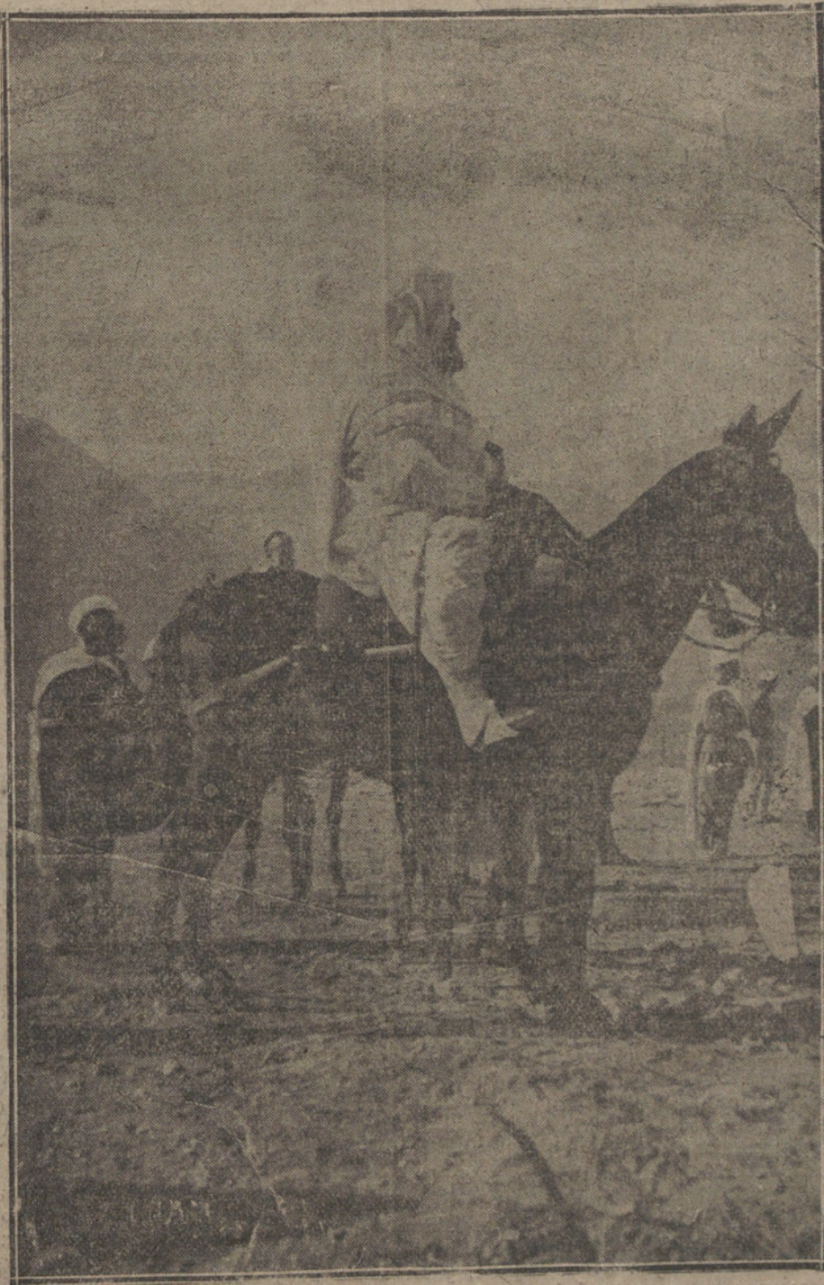
El cherif Er-Raisuni, que debe su prestigio entre los moros a la influencia religiosa que le presta el ser descendiente directo de Mahoma.