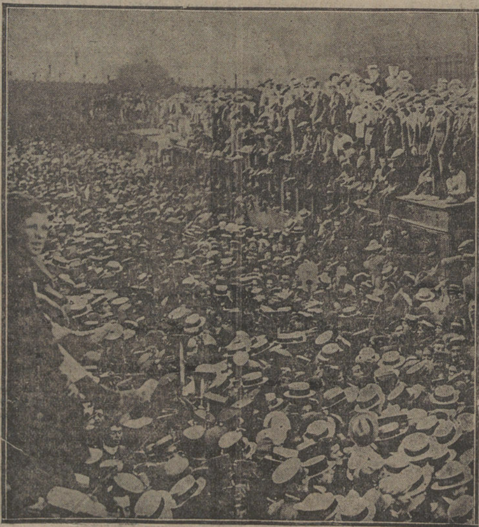
EN LA ESTACION DE M. Z. A.—Salida del batallón de Saboya para Marruecos.