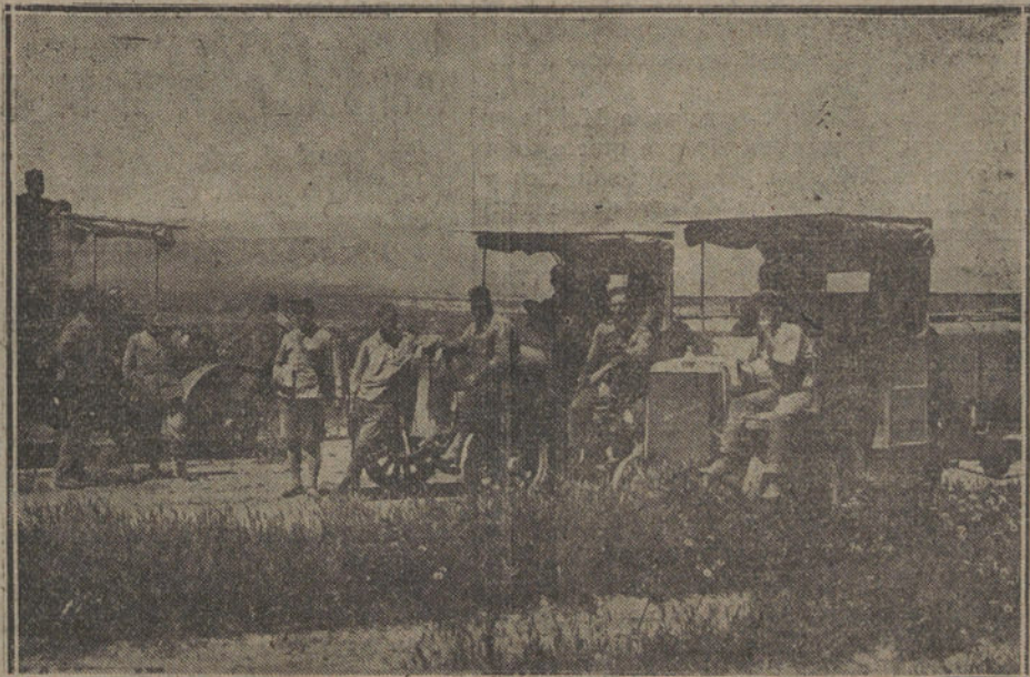
MELILLA.—El camión correo y dos tanques de agua, que fueron tirados por el enemigo, llegando a Batel sin novedad.