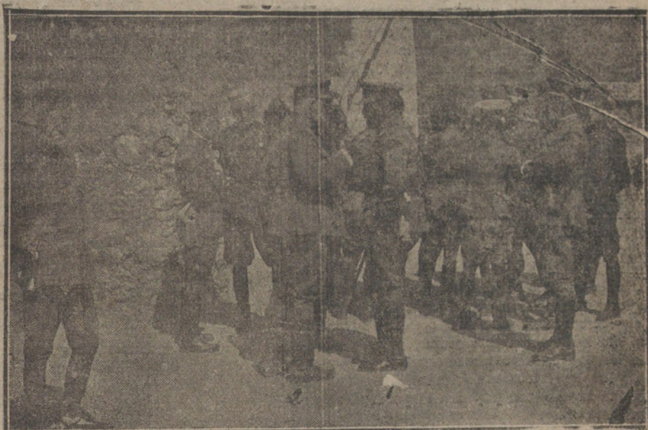
MELILLA.—El general Navarro (1) conferenciando con el teniente coronel Fernández de Tamarit (2), jefe del destacamento, en su última visita.

¿Cómo realizar esto? Imitando lo hecho en el extranjero en los países victoriosos: Creando un organismo que exclusivamente se preocupe de dar a nuestro Ejército material, municiones y aprovisionamientos, buscando para lograrlo los medios nacionales necesarios.