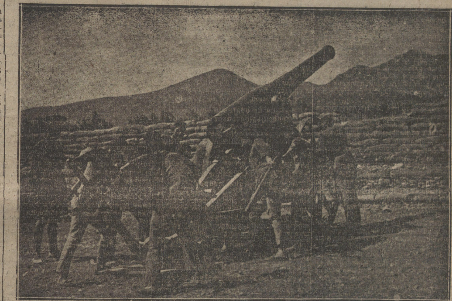
MELILLA.—Cañones de 15 centímetros Verdes Montenegro entrando en batería para hacer fuego contra los rebeldes.

Entre los proyectiles que más necesitamos figuran los de campaña de siete a nueve centímetros. Gran parte de las piezas que forman cada proyectil pueden ser fundidas y labradas por el 90 por 100 de las fundiciones y talleres de construcción mecánica que existen en España, pudiendo