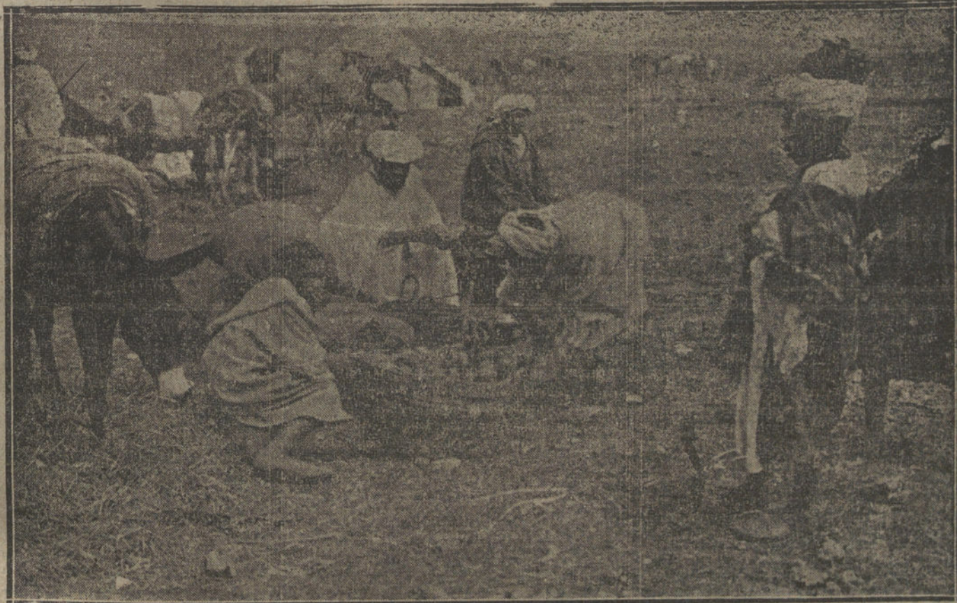
Escenas de zoco marroquí: Vendedores de naranjas.

Dicha incorporación tiene por objeto cumplir la prescripción legal de que el cupo de instrucción reciba ésta durante el año.