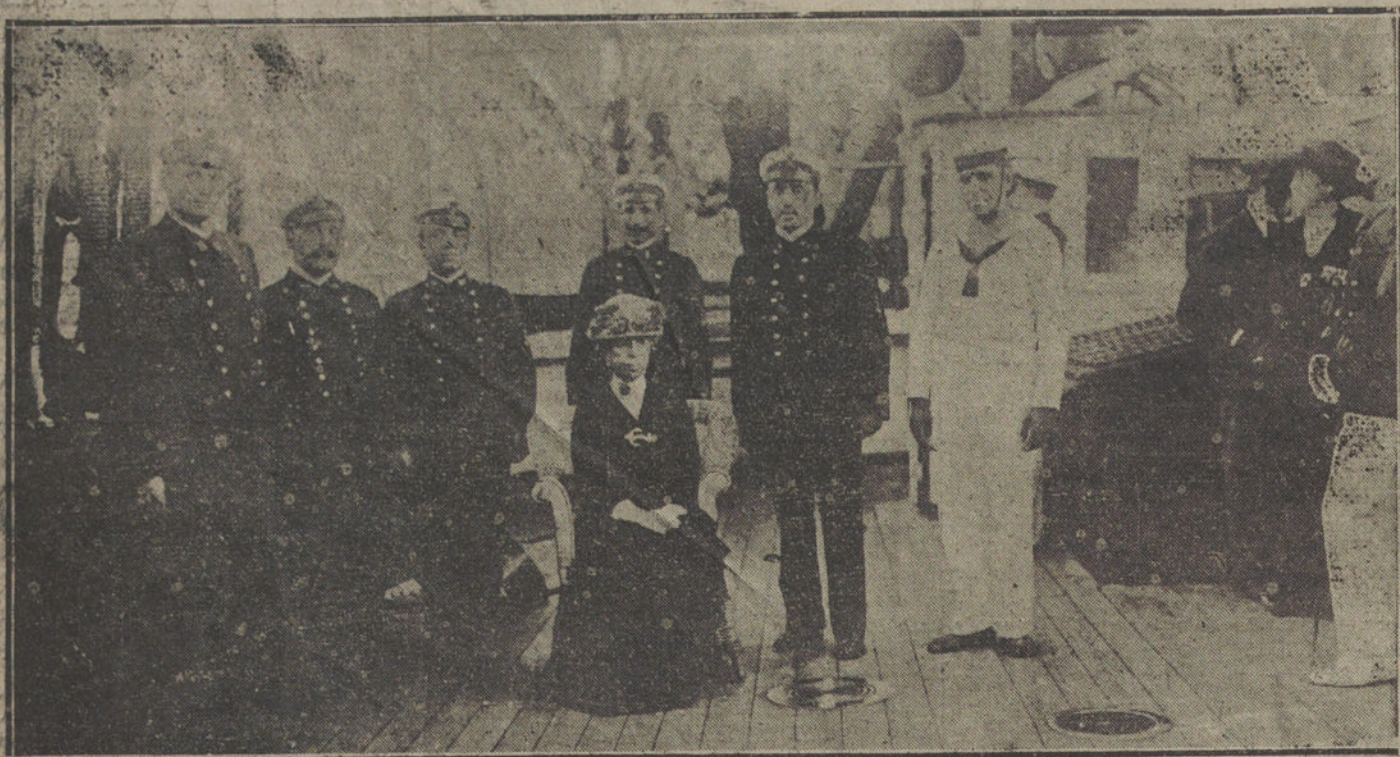
SAN SEBASTIAN.—Su Majestad la Reina Doña Cristina, rodeada de los contramaestres, en la visita que hizo a la corbeta «Nautilus», de la Escuela de guardias marinas.