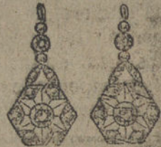
Núm. 5.—Pendientes ocho brillantes y diamantes. Ptas. 450.