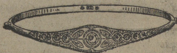
Núm. 2.—Pulsera cinco brillantes y diamantes. Ptas. 550.