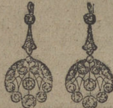
Núm. 9.—Pendientes 14 brillantes y diamantes. Ptas. 475.