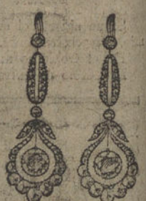
Núm. 27.—Pendientes seis brillantes y diamantes. Ptas. 675.

Factura de garantía en todas las compras