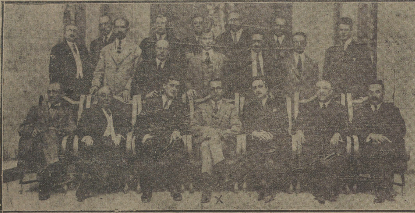
Concurrentes al b... de despedida, ofrecido en el Ritz a Mr. Palmer (X), cónsul de los Estados Unidos, con motivo de su traslado a Bucarest.