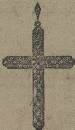
Núm. 20.—Cruz 20 brillantes y diamantes. Ptas. 500.