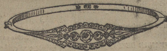
Núm. 7.—Pulsera tres brillantes y diamantes. Ptas. 625.