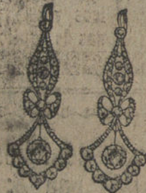
Núm. 24.—Pendientes ocho brillantes y diamantes. Ptas. 550.