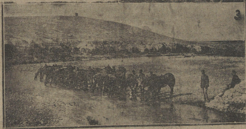
MELILLA.—(1) Campamento de Kaulada, que después de una heroica defensa fue incendiado por el enemigo.—(2) Campamento de Hassi Benihasen, recientemente asaltado por los cabilenos, ignorándose el paradero de toda la guarnición.—(3) Río Kert y fortín de protección, que se defendió heroicamente.

Dicho esto, ¿cómo hay quien no vea toda la gravedad del mal, la necesidad de cambiar radicalmente de métodos y de personas, por grandes que sean las protestas interesadas, y de asegurar la independencia de España? ¿Cómo no ver la urgencia de dotar verdaderamente al Ejército de todo lo necesario, gracias a un organismo integrado por civiles aptos y competentes, organismo que pueda hablar de tú a cualquier otro?