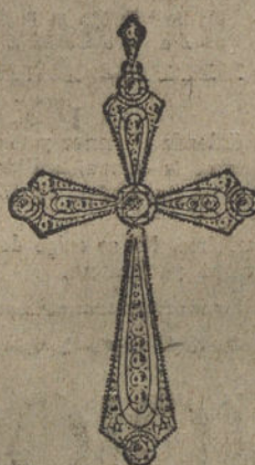
Núm. 26.—Cruz cinco brillantes y diamantes. Ptas. 550.