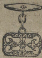
Núm. 13.—Botonadura cuatro brillantes y diamantes. Ptas. 400.