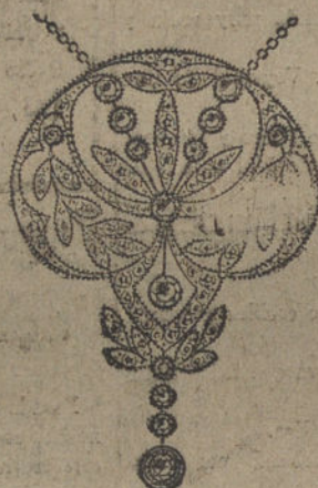
Núm. 15.—Pendiente 12 brillantes y diamantes. Ptas. 675.