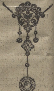
Núm. 18.—Pendiente seis brillantes y diamantes. Ptas. 1.200.