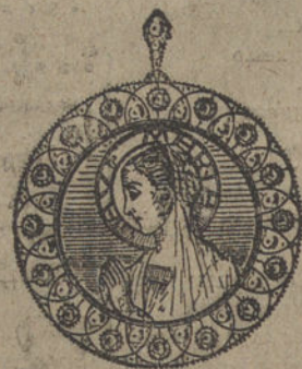
Núm. 6.—Medalla 16 brillantes y diamantes. Ptas. 575.