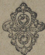
Núm. 4.—Sortija tres brillantes y diamantes. Ptas. 500.