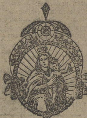
Núm. 21.—Medalla seis brillantes y diamantes. Ptas. 600.