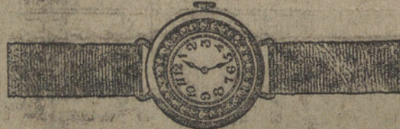
Núm. 25.—Reloj áncora platino y oro, con diamantes y pulsera de mano. Ptas. 475.