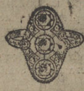
Núm. 10.—Sortija cinco brillantes y diamantes. Ptas. 650.