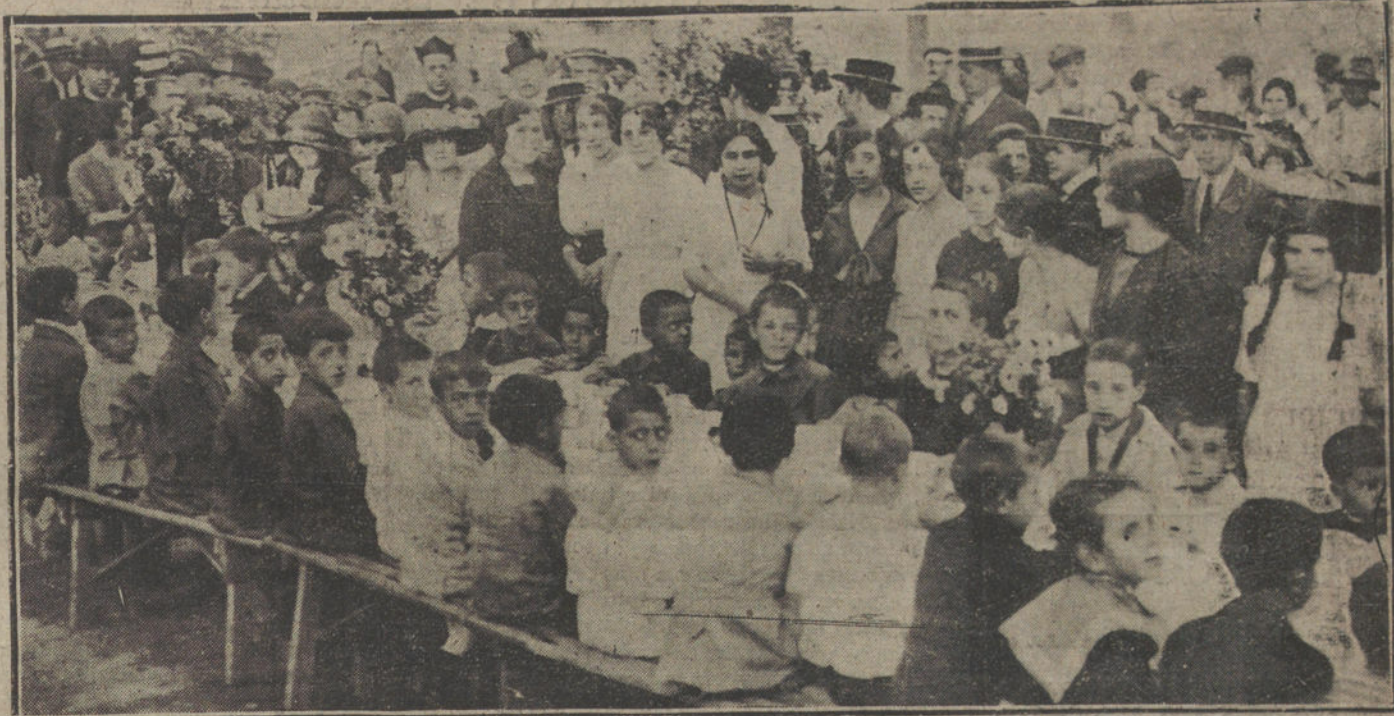
LAS FIESTAS DE LA VIRGEN DEL PUERTO.—Merienda ofrecida a los niños de las escuelas municipales.

Después pronunció un discurso a propósito de la situación en Rusia el delegado Sr. Nansen.