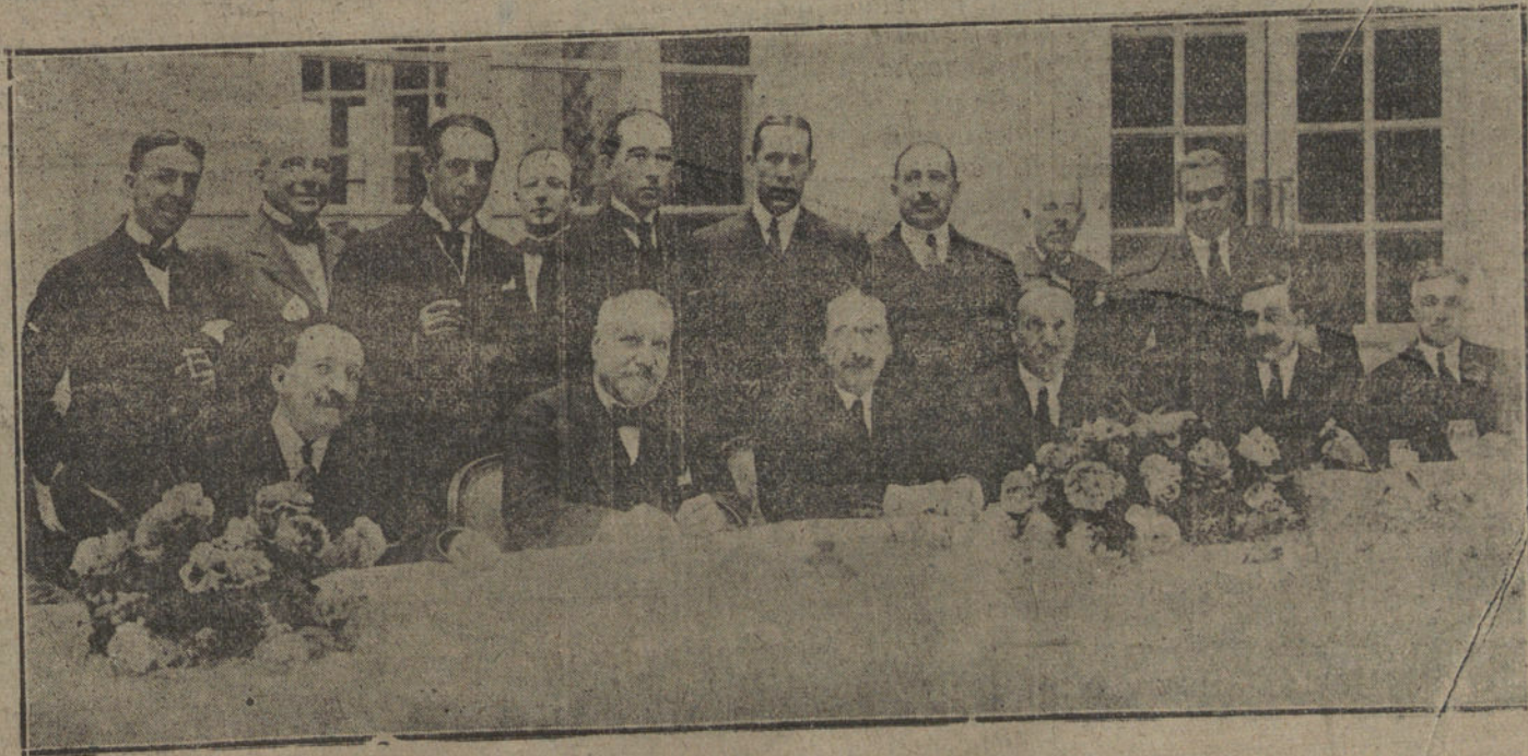
Banquete ofrecido en el Pinar al Gobierno por el encargado de Negocios de la Argentina, Sr. Lecrifier, a motivo de haber sido aceptadas a colización oficial en las Bolsas de España las Cédulas hipotecarias argentinas.

Terminó el jefe del Gobierno diciendo que de lo demás no había nada nuevo, y que todo marchaba normalmente.