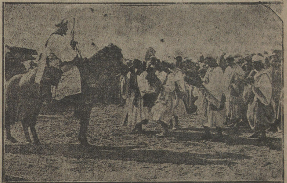
La vida en el Rif.—Típico acompañamiento de una boda.—Músicos indígenas.

No creemos que esto sea tan descabellado que no se pueda intentar. La idea, en