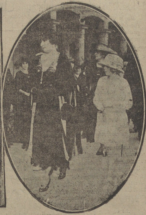
SAN SEBASTIAN.—Don Manuel Alonso, campeón de tennis.—Becerrada benéfica, organizada por los jockeys de Lasarte para los soldados de Melilla.—Su Majestad la Reina, acompañada de sus augustos hijos, visitando la tómbola.