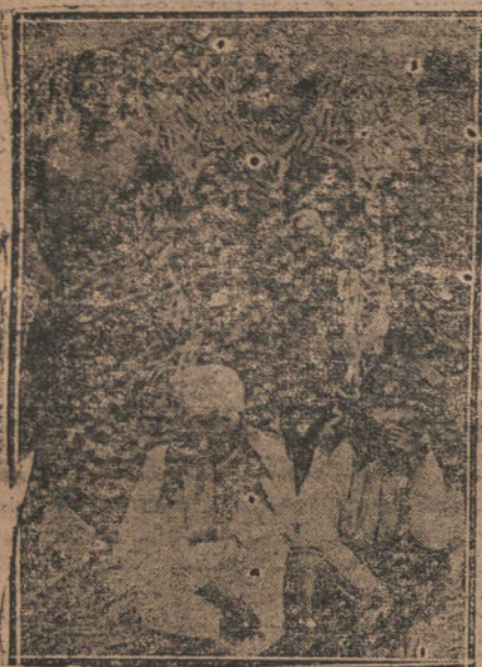
EL ILUSTRE NOVELISTA, EN AMERICA, RODEADO DE ALGUNOS INDIGENAS

de Blasco. Yo he mantenido discusiones, y como era yo, representante verdadero de los nuevos géneros, el que lo defendía, los que lo discutían han buscado al final una fórmula de estar de acuerdo y de no acabarlo de estar.