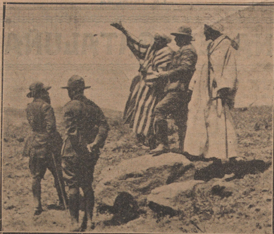
MELILLA.—El general Berenguer conferenciando con unos moros adictos.