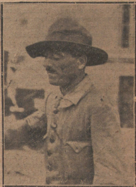
MELILLA. EL TENIENTE CORONEL MILLAN ASTRAY, HERIDO EN LAS OPERACIONES DEL SABADO

Y es que no hemos comprendido, o no hemos querido comprender—que es peor—la psicología del moro. Raza nómada y enemiga de dominios, sólo reconocen como jefes aquellos nacidos en el seno de la misma cabila, que muchas veces es enemiga de la vecina; admiradores fieles del fácil lucro y, por consecuencia, de la rapina, les fué siempre cómoda nuestra protección, que los hacía más fuertes, casi invulnerables, calcúlese cuando, encima de esto, les hemos dado dinero, fusiles, cartuchos, e incluso nos hemos puesto mal con otras cabilas para proteger a los que, al primer revés de la suerte, nos han dicho muy amablemente: «Nosotros estamos amigos; sí; amigos mientras venzáis. Ahora no hay nada de lo dicho; cuando no venzáis, nosotros estamos amigos, sí, pero del que más pueda, que es el que ha