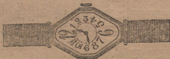
Núm. 3.—Ancora de precisión, 15 rubíes, oro de ley 18 quilates, con pulsera de moiré. Pesetas, 150.