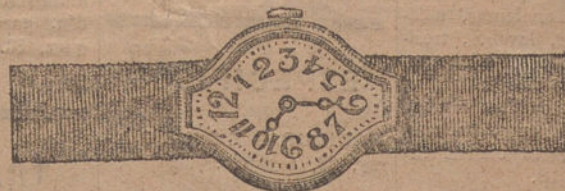
Núm. 2.—Máquina de precisión sobre rubíes, oro de ley 18 quilates, con pulsera de moiré. Pesetas, 125.