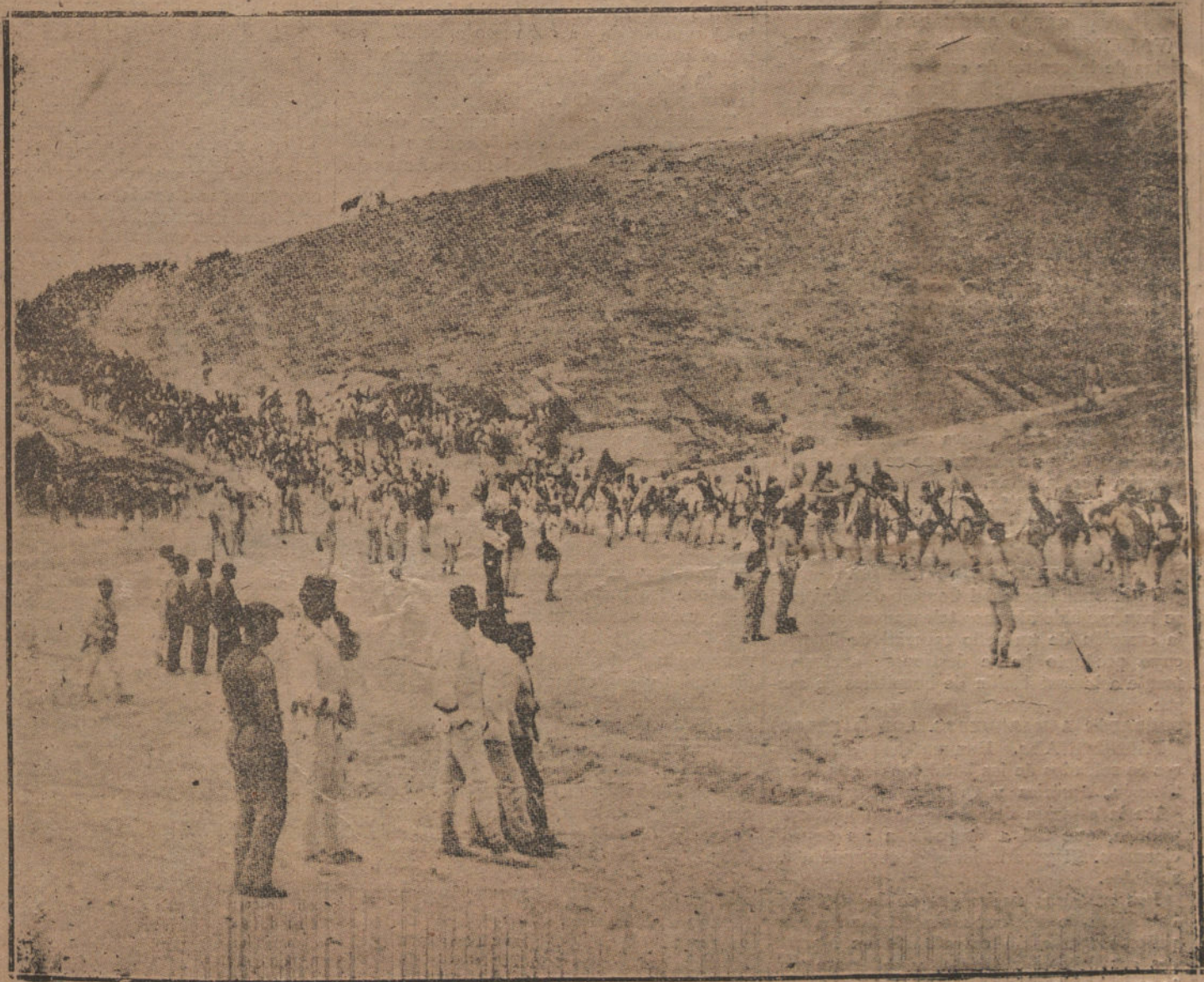
MELILLA.—Una columna en marcha para Nador.