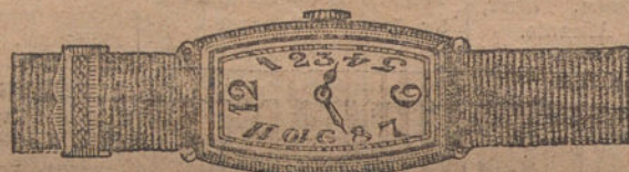
Núm. 5.—«Tonneau», áncora de precisión, oro de ley 18 quilates, con pulsera de moiré. Pesetas, 200.