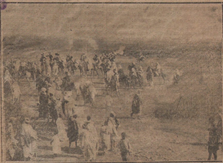
EN LA LLANURA DEL GARET. — Los moros corren la pólvora en señal de regocijo.

A las cuarenta y ocho horas se recuperó Akba-el-Kol-la. En el interior se amonto-