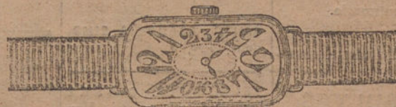
Núm. 4.—Ancora de forma, oro de ley 18 quilates, con pulsera de moiré. Pesetas, 175.