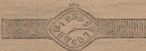
Núm. 1.—Rombo, máquina fina, oro de ley 18 quilates, con pulsera de moiré. Pesetas, 110.

Formas modernas y elegantes :: Máquinas finas de precisión Garantía efectiva de buena marcha por cinco años