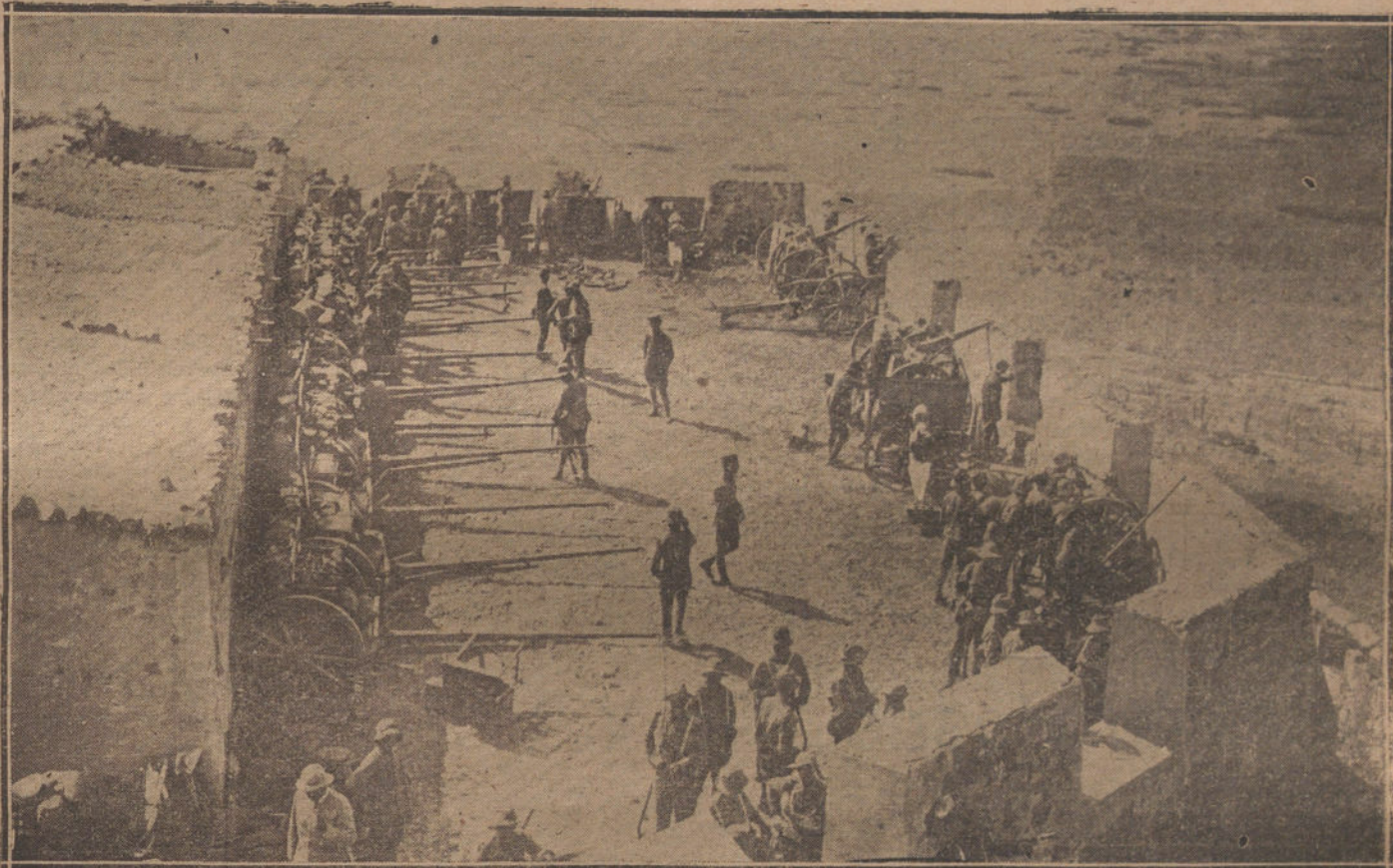
EN TAUIMA.—Emplazamiento de una batería para combatir al enemigo.