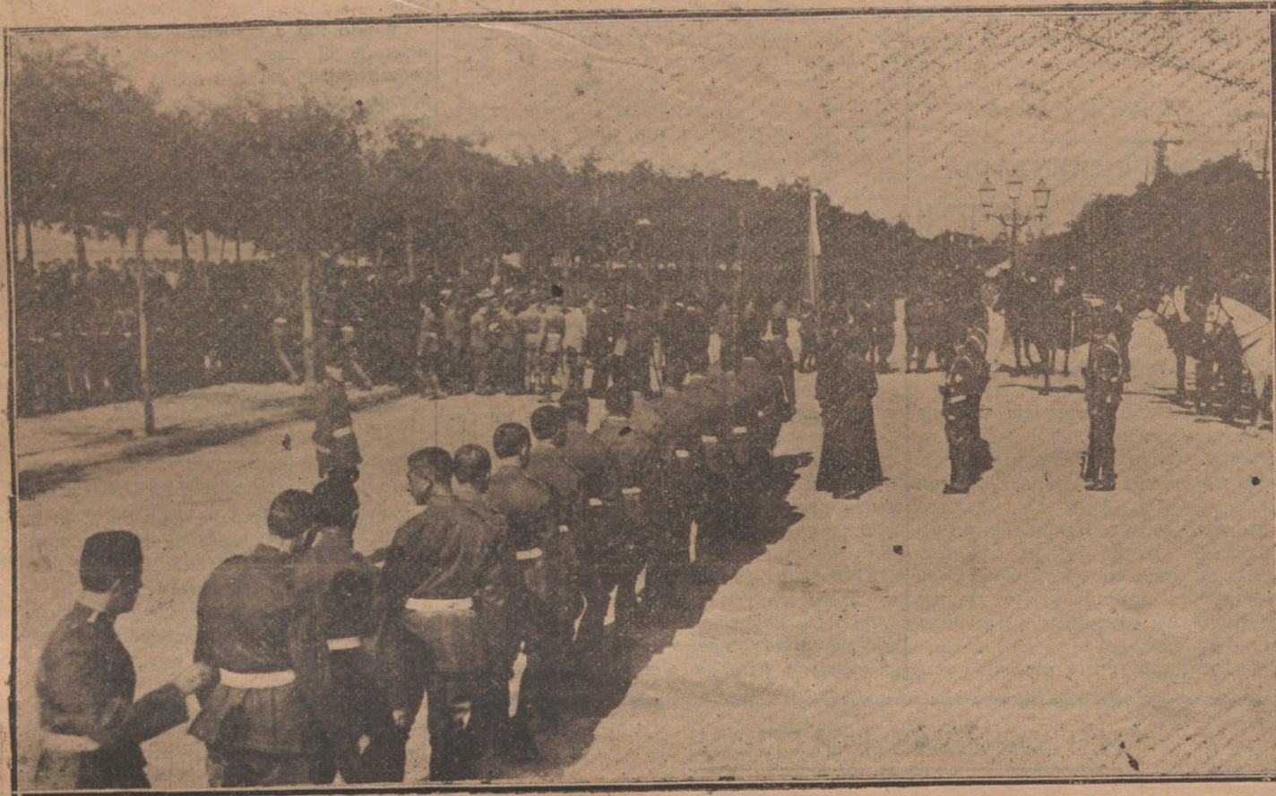
EL ACTO DE HOY.—Los reclutas jurando la bandera en el paseo de Rosales.

Los Reyes presencian desde los balcones de Palacio el desfile de las tropas