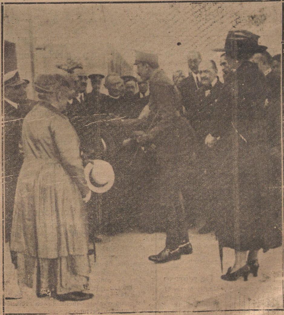
AYER, EN CUATRO VIENTOS.—Su Majestad la Reina Victoria, madrina del aeroplano «Salamanca número 1», rompiendo una botella de champaña sobre el aparato.

Continúa interrumpido el tránsito por las calles donde estaba enclavado el edificio destruido.