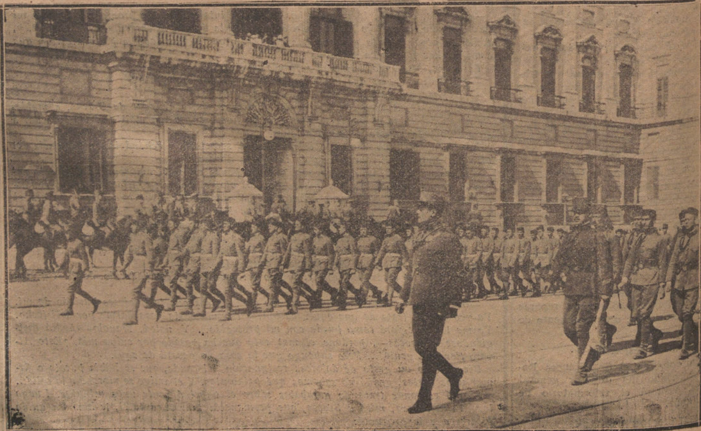
EL ACTO DE HOY.—Los reclutas de la guardia desfilando ante Palacio, después de jurar la bandera.

La familia real presenció el desfile desde el balcón de la puerta del Príncipe.