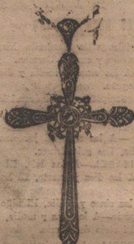
Núm. J. 8.588.—Cruz oro y platino, un brillante y 31 rosas. Pesetas 275.