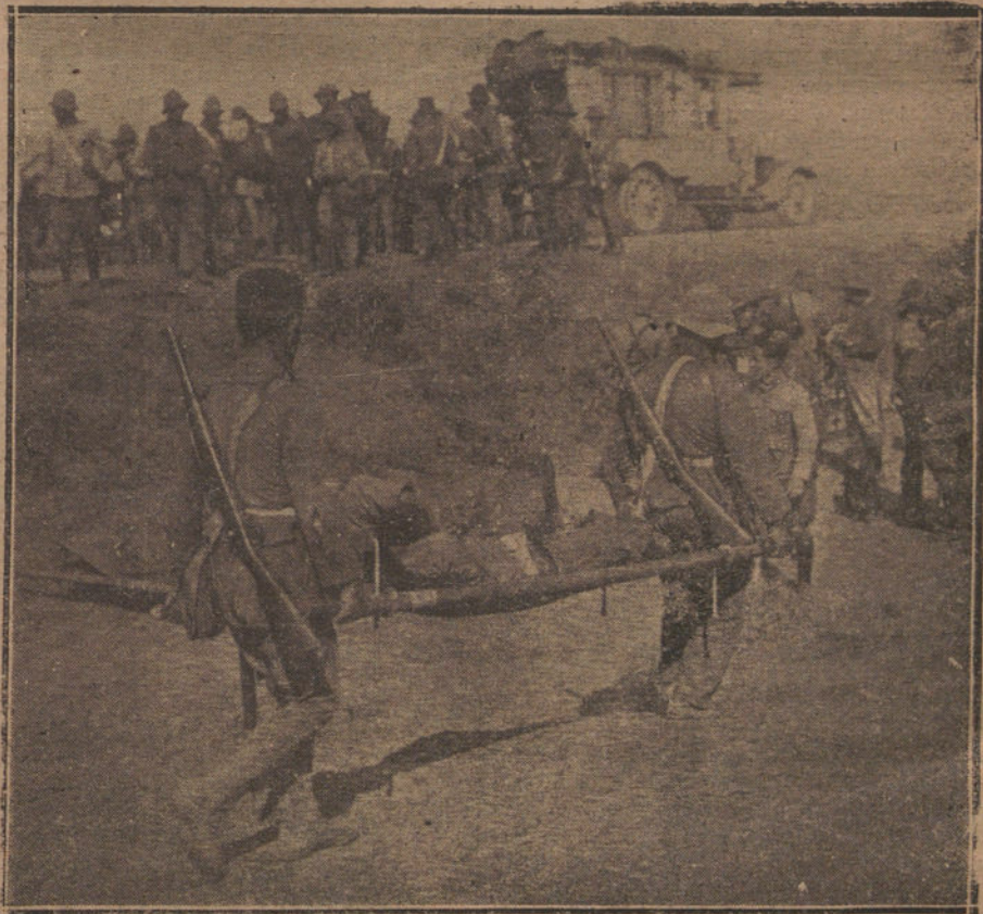
LA GUERRA.—Conducción de un herido desde la línea de fuego al puesto de socorro.

tomase otra dirección, pues el hombre estaba empeñado en subir por el glacis, atravesando la alambrada: el sitio más se-