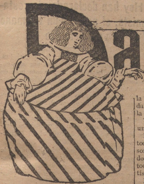
"Maria Begonia" en la Comedia