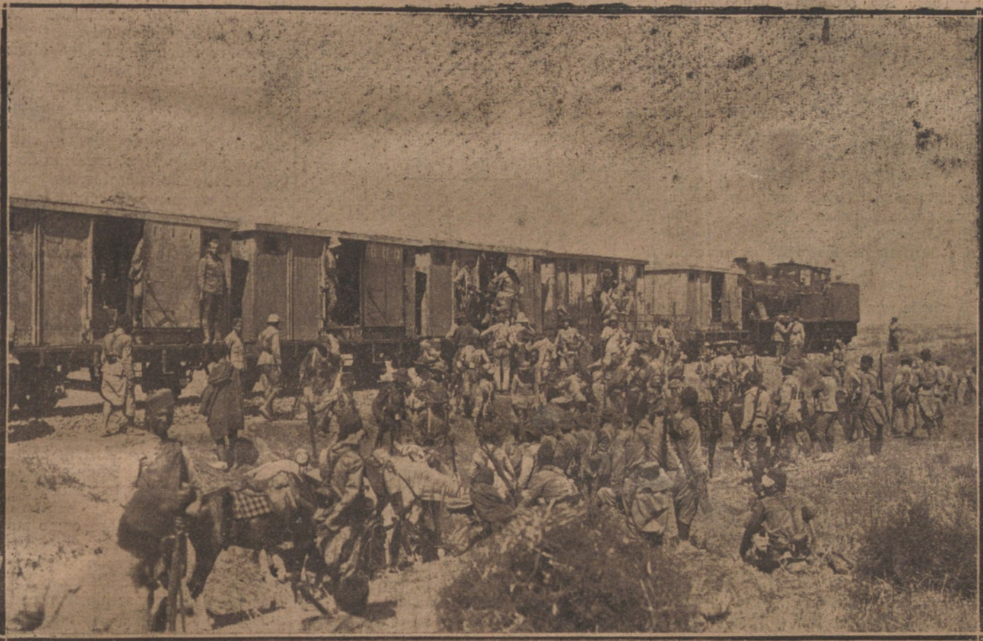
MELILLA.—Un tren blindado en la estación de Tauima.