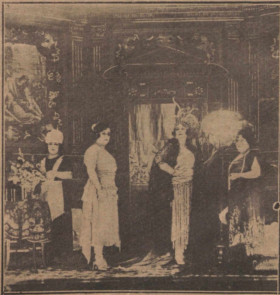
EN LARA.—Una escena de «La sin ventura».

—Salida para Palencia y continuación por León, Oviedo, Gijón, Avilés y Zaragoza. En esta última plaza estarán por Carnaval.