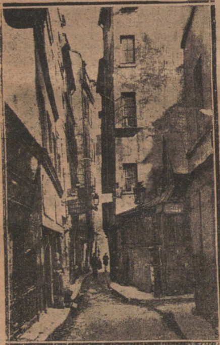
En sus estaciones cansadas de ver pasar trenes: París.

Y después de pasar todo el largo camino,