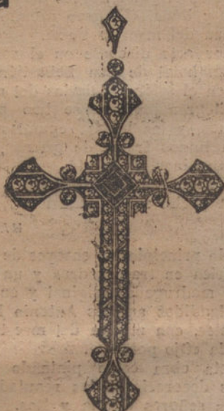
Núm. J. 2.371.—Cruz todo platino, 65 brillantes primera calidad y un zafiro. Pesetas 1.750.

Garantizo el valor con factura :: Relojería de alta precisión