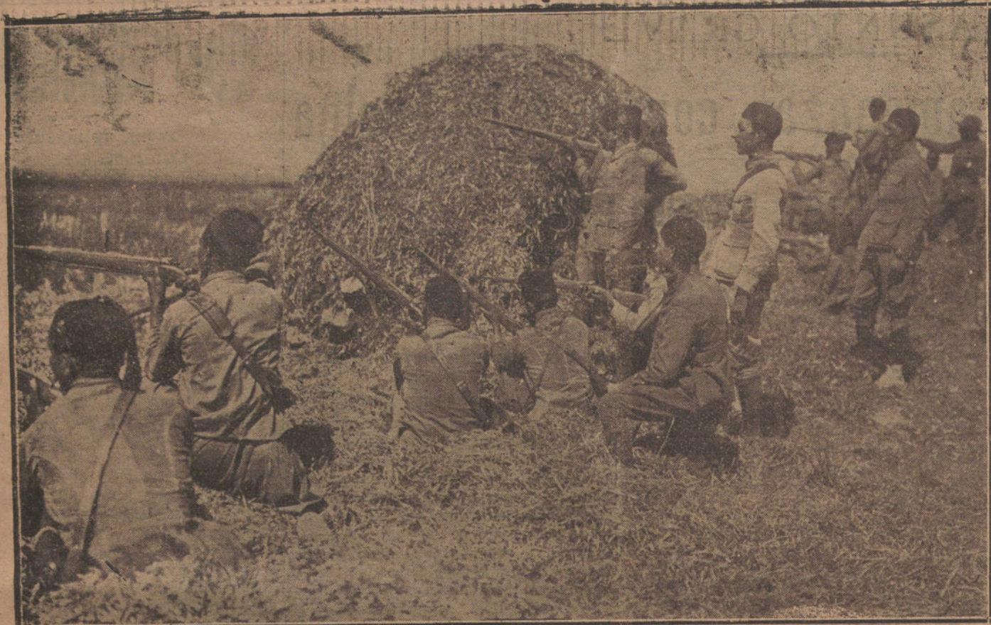
LA GUERRA.—Los Regulares combatiendo en la línea de vanguardia.