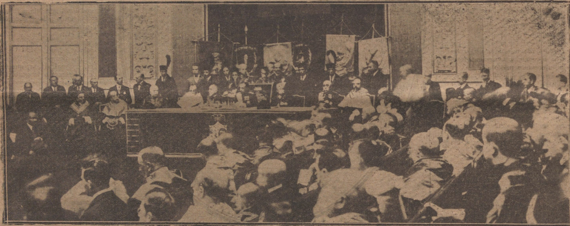
Su Majestad el Rey presidiendo la solemne sesión de apertura del curso académico, celebrada esta mañana a

«La Universidad autónoma, en su amplia vida de relación con todas las clases sociales, sin excluir, por presunciones de jerarquía, a las más humildes, ni por espíritu sectario