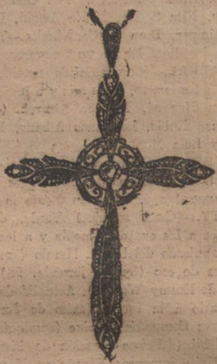
Núm. J. 8.583.—Cruz oro y platino, un brillante, 15 rosas y onix. Pesetas 270.