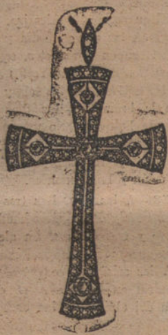
Núm. J. 2.351.—Cruz oro y platino, 5 brillantes y 70 rosas primera calidad. Pesetas 775.