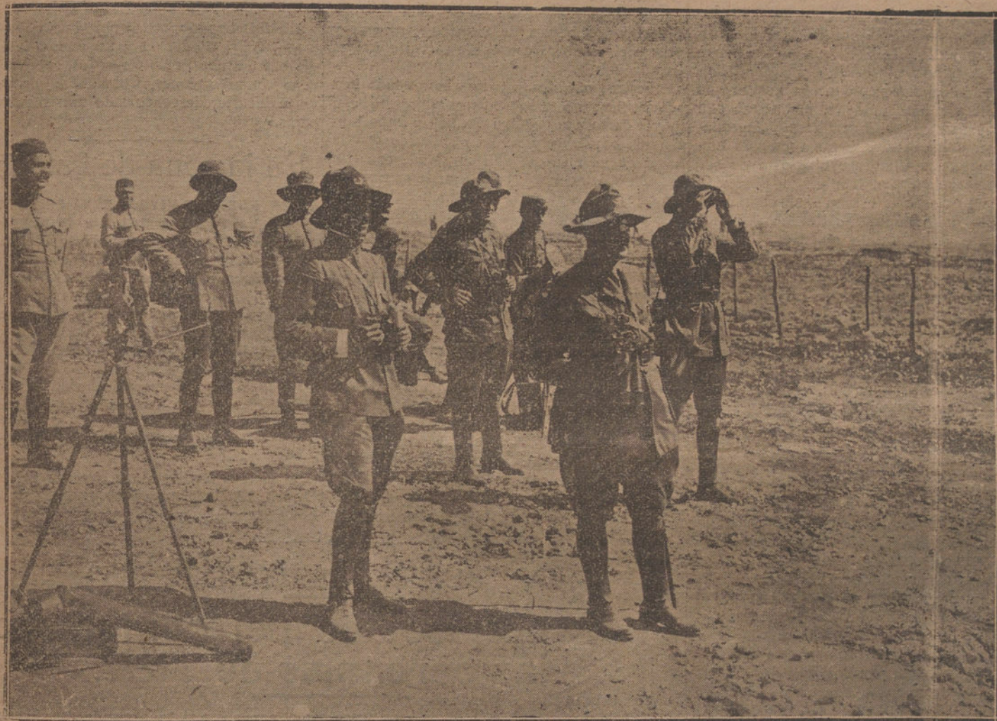
TIZZA.—El comandante general marqués de Cavalcanti momentos antes de lanzarse al asalto sobre el enemigo.

Si, señores; también aquí hay cornejas. Cornejas y cuervos. Los cuervos habitan en el campo. Nuestro automóvil levanta bandadas de ellos al cruzar las carreteras. Las cornejas viven en la ciudad y están disfrazadas de personas respetables, de queridos amigos nuestros, de conocidos de café, de sirvientes y camareros que nos suministran los platos de la cena, el aperitivo de las ocho, el café con tostada del pisco de media noche y hasta del propio conserje del hotel que nos abre la puerta, diciéndonos sentenciosamente: