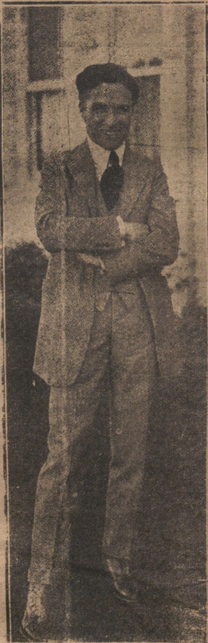
CARLOS CHAPLIN EN SU VERDADERA FIGURA

La multitud que en las películas se precipita y se empuja y cae, envolviéndose unos a otros, la multitud «que se hace bola de nieve», como ha dicho muy bien Ivan Goll, le persigue por todos lados, y todas las mujeres quieren ser sus novias, y las antiguas novias le reclaman su parte.