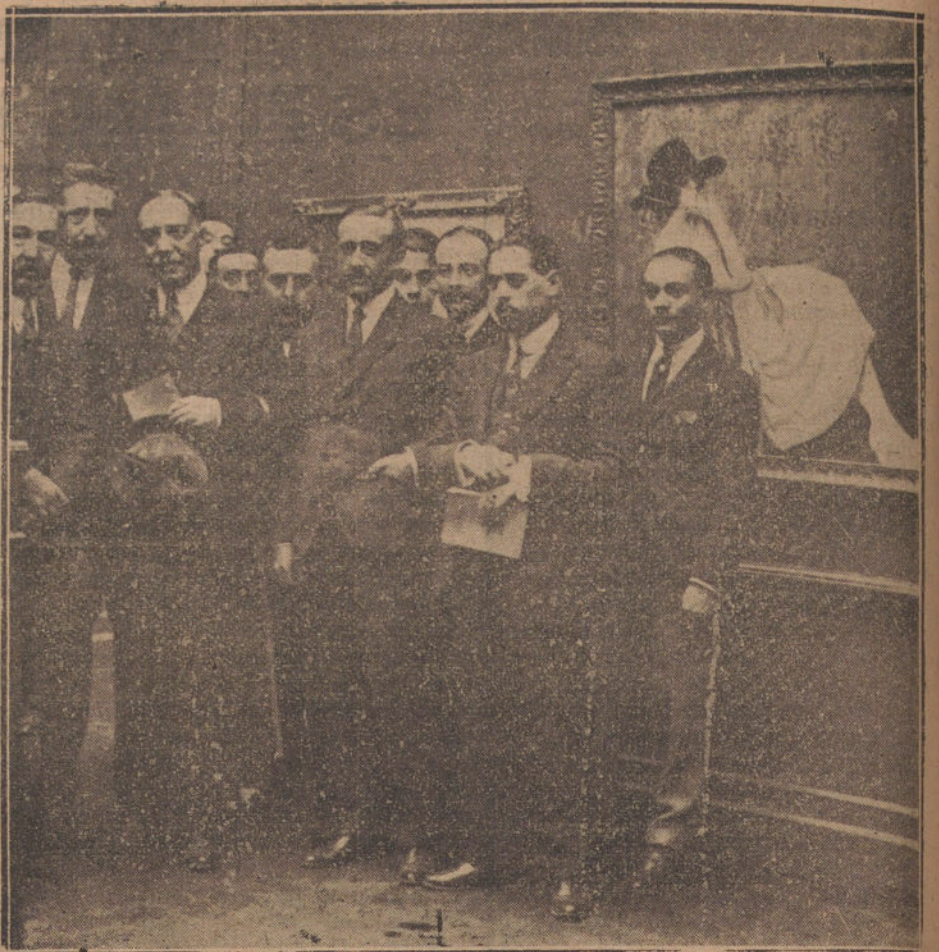
El director general de Bellas Artes, acompañado de varios artistas, en el acto de inauguración oficial del II Salón de Otoño.

Los imitadores, los falsos Charlots que abundan por todos lados, se ocultan en los rincones más oscuros y perdidos, temerosos de que les vea el verdadero, que por fin «ha venido». ¡Pobres Charlots del carnaval de los Charlots!