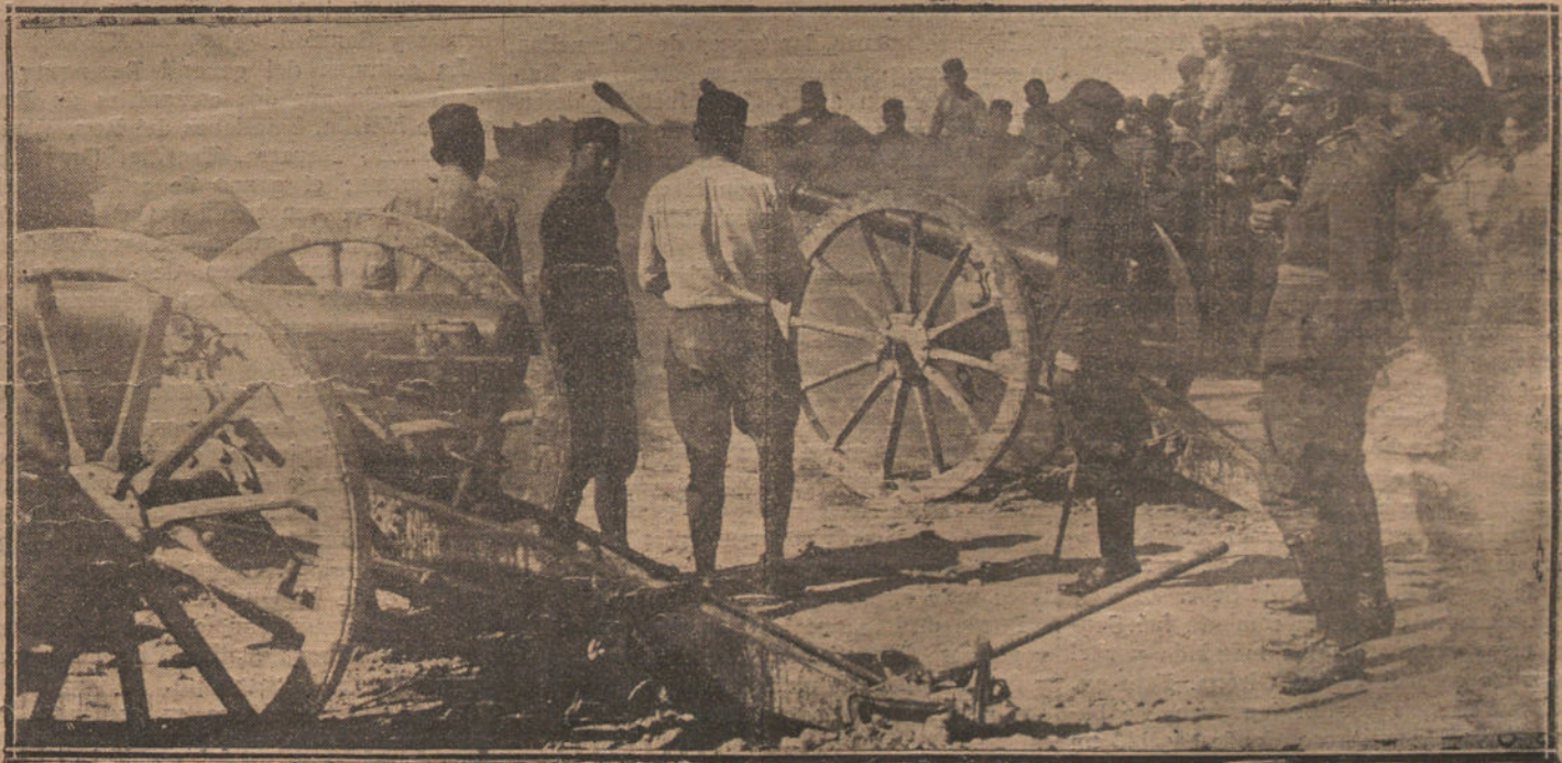
EL COMBATE DE TIZZA.—La batería de la posición de Sidi-Amara protegiendo el avance del convoy.

Los expedicionarios cuentan que en la Habana se les hizo una entusiasta despedida.