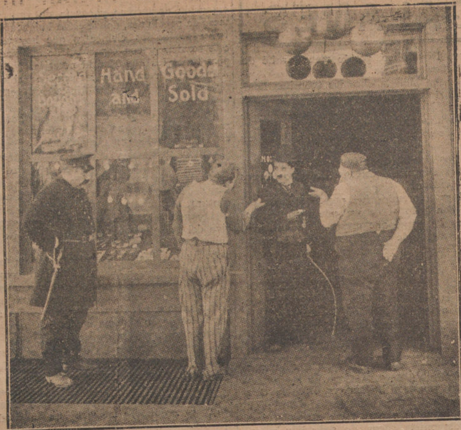
Charlot en casa del prestamista.

le impuso ese nombre el pueblo francés, comunicándose Max-Linder, que ha escrito a este propósito: «Soy yo quien le comunicó que se le llamaba Charlot en Francia, y a su hermano Sydney-Julot. Esto les hizo una gracia enorme, y todo el día se han estado llamando así el uno al otro, con grandes carcajadas».