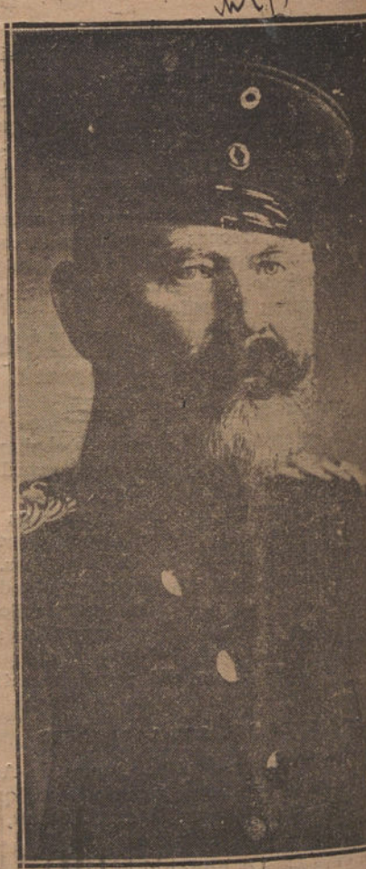
Guillermo II, rey de Wurtemberg, que acaba de morir.

Después de todo, era lo que ellos pretendían.