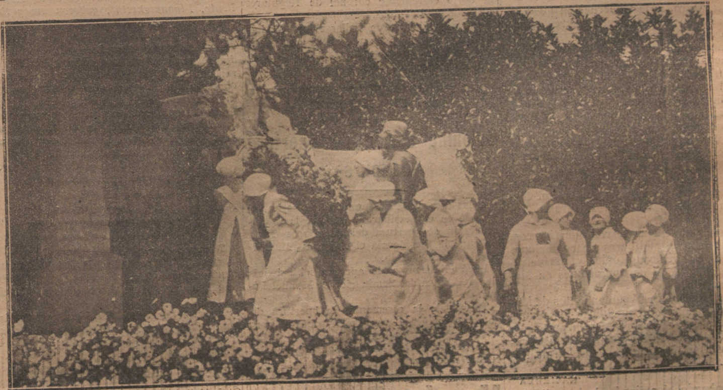
Enfermeras del Instituto Rubio colocando flores en el monumento al ilustre doctor, con motivo de la inauguración del curso actual.

Las señoritas que forman esta Comisión llevaban empleadas doce y quince meses, dando pruebas de su actividad y pericia; pero han sido eliminadas de un modo arbitrario. Sus quejas nos parecen justas y las trasladamos al Sr. Cambó.