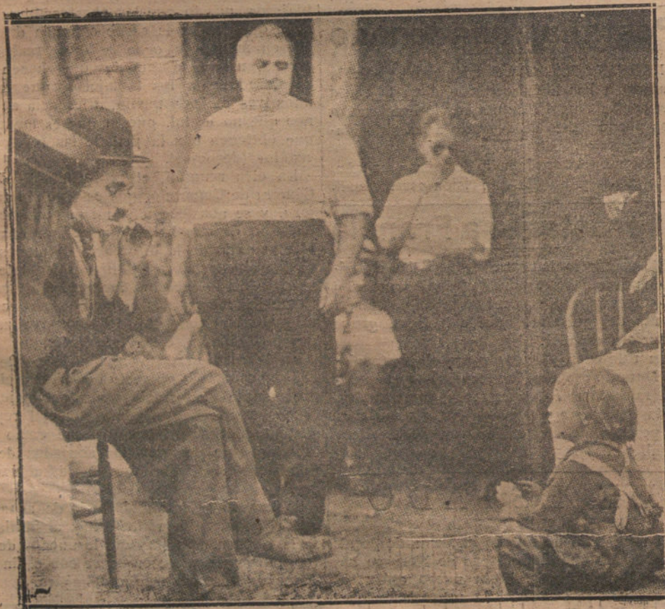
Una pausa de Charlot durante la impresión de una película.