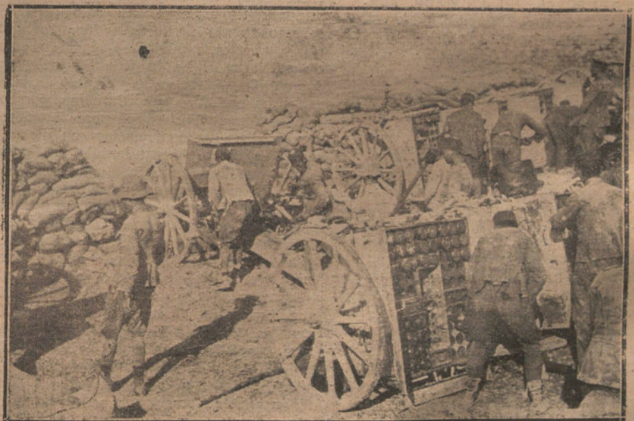
LA OCUPACION DE SEBT—Entrada a la posición

llegará, pues para venir de Málaga encontraría mar de proa... Lo suficiente para no llegar en una semana. Hoy no hemos recibido el correo de España, y se duda que de aquí pueda salir un barco. Por si sale, garrapearlo está cróniquilla, arrullado por los rugidos del huracán. Los cañones están mudos desde ayer. En el Gurugú no se ha visto un moro. Los vecinos del barrio del Real han pasado la noche tranquilos. Ya era hora. Nosotros, los de la harca periodística, tenemos hechos los preparativos para salir mañana, si el tiempo no lo impide, a presenciar la toma del Avanzamiento y San Juan de las Minas, al pie de Yebel-Uixan; cuestión de un pequeño paseo militar de tres kilómetros. Dudo que se avance más, porque el Uixan tanpoco será tomado de frente—lo cual costaría