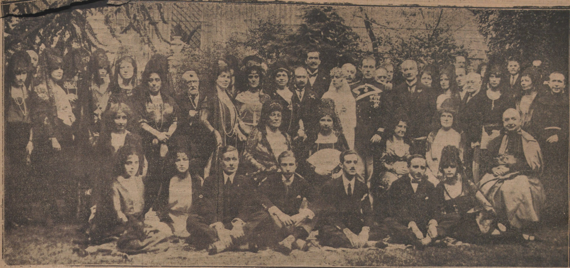
BODA ARISTOCRÁTICA.—La marquesa de Belvis de las Navas con su esposo, el príncipe de Hohenlohe, sus padrinos y los invitados al acto en el jardín del palacio de Parcent, después de celebrada la ceremonia nupcial.