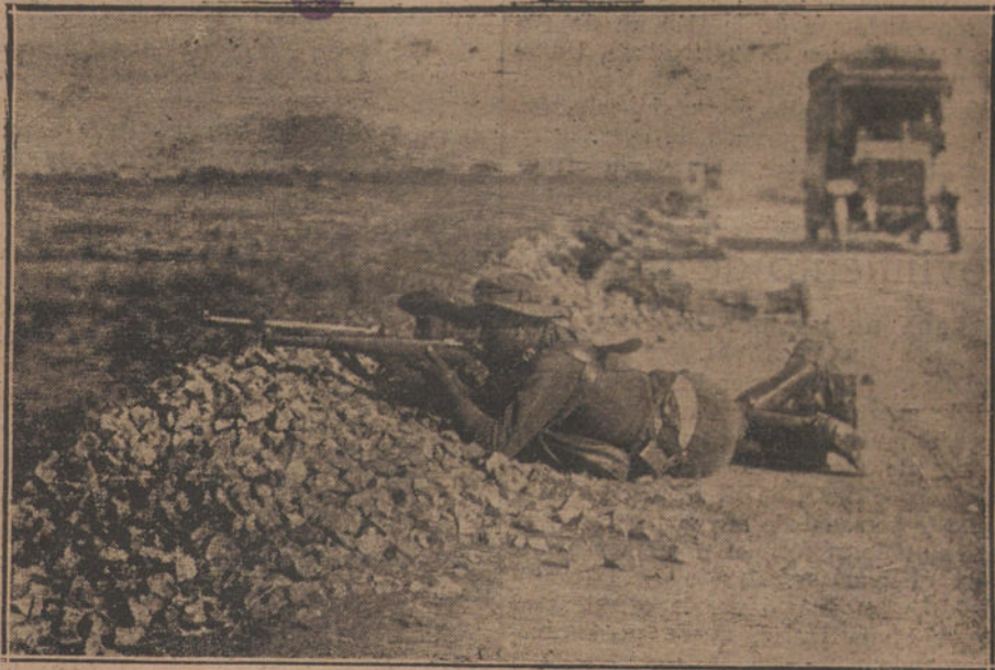
LA GUERRA.—Soldados de caballería protegiendo el paso de un convoy de Sanidad.

De la plaza no debieron ver la enseña nacional ondear al viento. Melilla permaneció muda. Sólo al cabo de tres cuartos de hora, cuando ya el pico de Hardú horregaba de soldados del Tercio y del regimiento de la Princesa número 4, los primeros en subir, y había sido clavada la bandera en un mástil más alto, rompió en salvas de artillería la batería del Ataque Seco y oímos el confuso rumor de las campanas volteando alegremente. Me han contado que Melilla no se entusiasmó poco ni mucho, ni salieron las músicas, ni hubo vivas y aclamaciones. Sólo una señora se asomó al balcón y dió un viva España. Los edificios públicos izaron la bandera, los casinos pusieron colgaduras; el vecindario no secundó estas muestras del regocijo oficial. ¿Por qué? Yo no sé contestar la pregunta. A nosotros, que contemplábamos el espectáculo desde la sierra, se nos nublaron los ojos y aplaudimos a rabiar los gallardos movimientos que la brisa imprimía a la tela roja y ama-