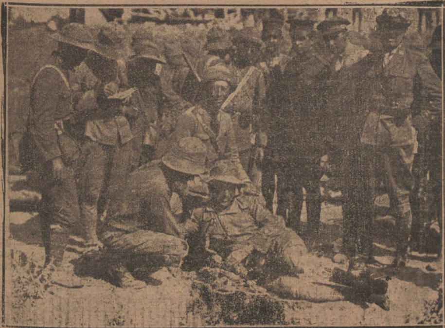
LA GUERRA.—Cada al capitán del Tercio Sr. Franco en el campo de batalla.

La primera en llegar a las cumbres fué la columna del general Berenguer, que, ascendiendo al pico de Kolha, enarboló la bandera al grito de «viva España», que fué contestado con gran entusiasmo por todos. Se sabe que el enemigo tuvo considerable