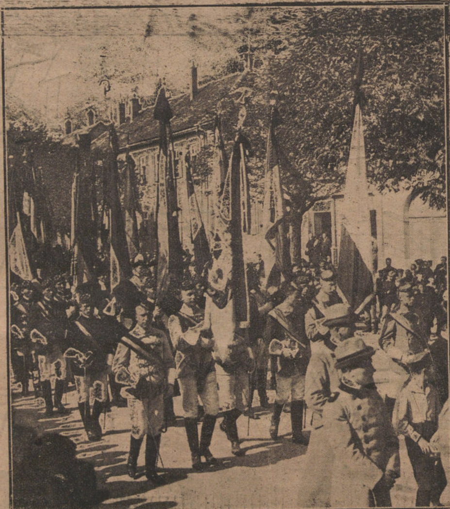
ALEMANIA.—Representaciones de estudiantes en el entierro del ex rey de Wurtemberg.