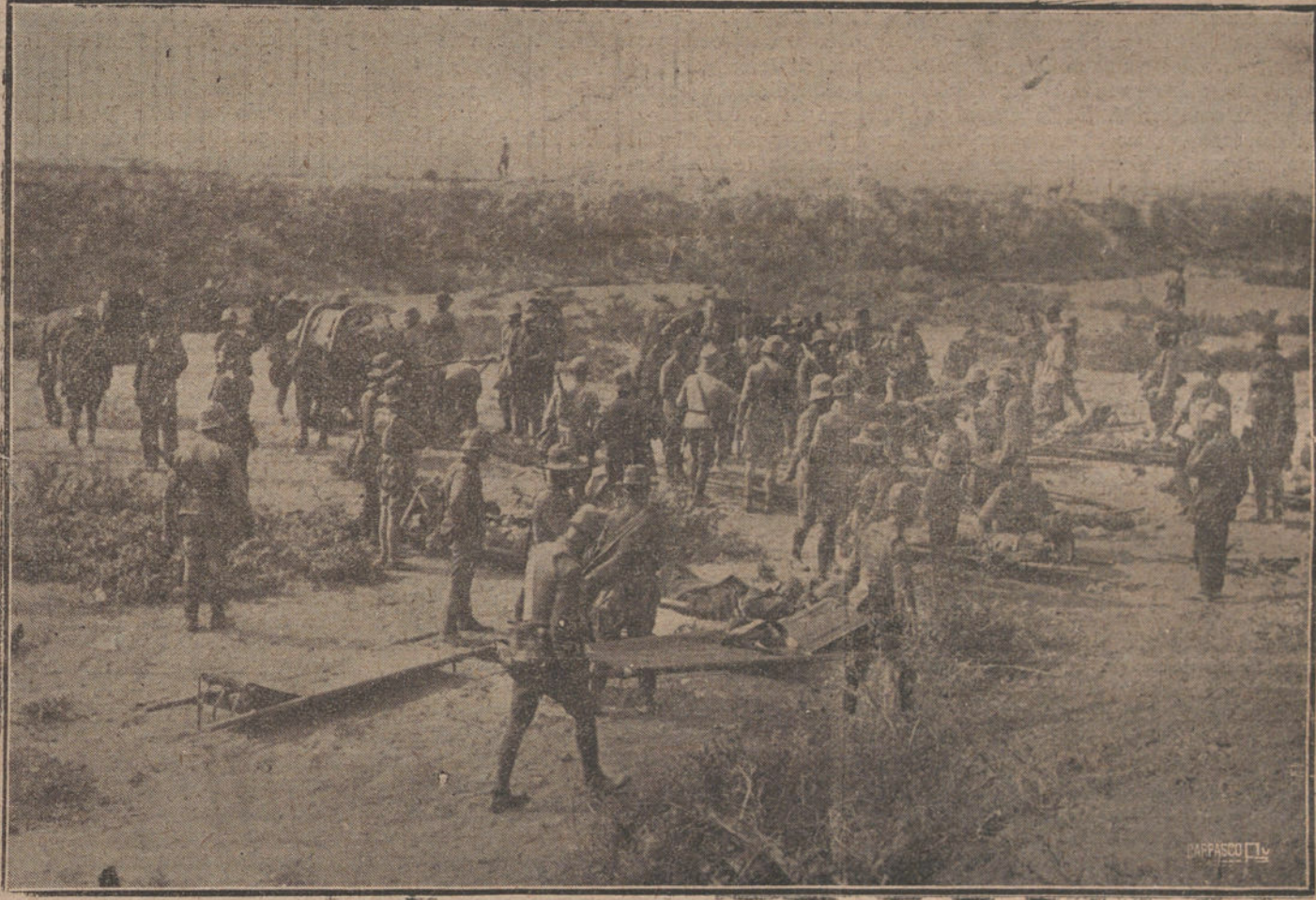
ESTAMPAS DE LA GUERRA.—Un puesto de socorro en la línea de fuego.