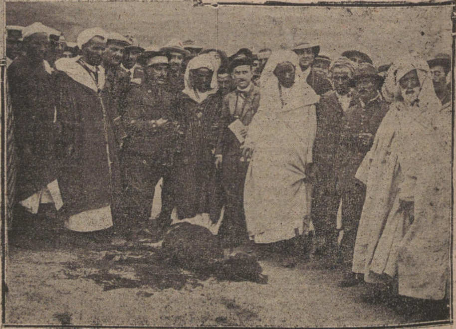
I. El coronel Riquelme leyendo el documento de sumisión entregado por Abd-el-Kader.—II. Los cabileños llegan con la inevitable ternera.—III. Preparando el sacrificio.—IV. La ternera degollada, y todos tan amigos.