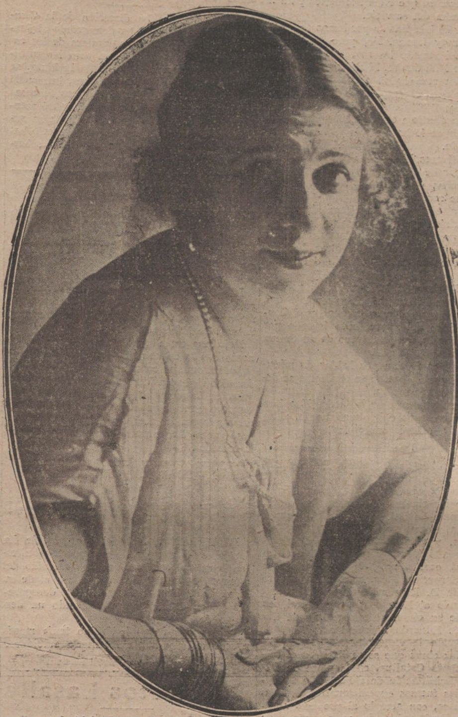
AURORA JAUFFRET, «LA GOYA»

Después de una larga y provechosa campaña por América, la genial tonadillera ha vuelto a Madrid, y actúa, llena de gracia, de expresión y de casticismo en el popular teatro de Maravillas.