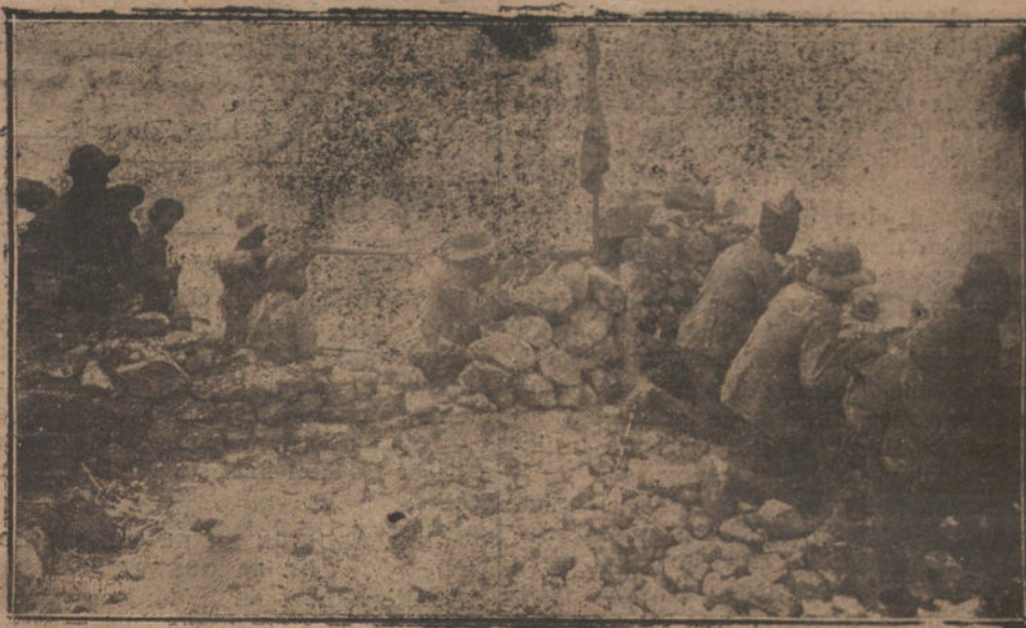
ESTAMPAS DE LA GUERRA.—Los legionarios combatiendo desde una de las alturas del Gurugú.

Por la tarde hubo un aficionado a la populacheria; pretendió organizar una manifestación con música, olvidando que a aquella misma hora los cadáveres gloriosos de los que tomaron el Gurugú estaban insepultos, y que el trasiego de heridos se estaba efectuando. Algún, caballero y humano, hizo fracasar el plan bullanguero con el que se quería halagar a quien