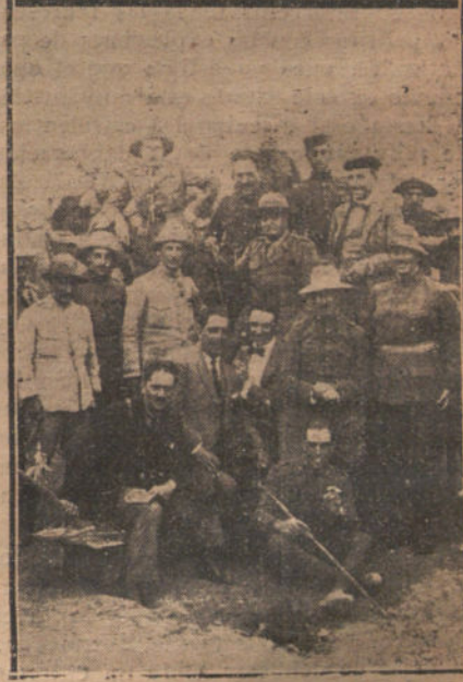
I. El general Berenguer (D. Federico) y el coronel del regimiento del Rey, Sr. Saro.—II. Abd-el-Kader, el santon de la Puntilla, y otro moro amigo de España.—III. Jefes de la tribu de Mazuza, que se han sometido a nuestras tropas.—IV. Varios corresponsales de guerra fraternizando con el Ejército.