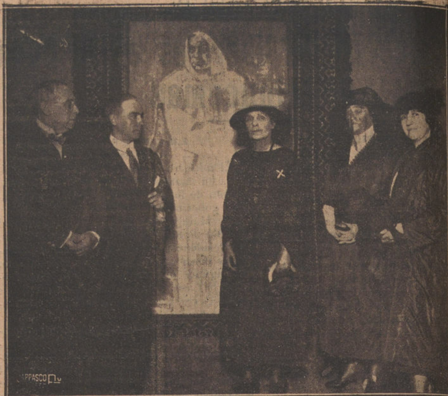
Su altera la infanta doña Eulalia en su visita a la sucursal del diario argentino «La Nación», donde se halla expuesto el retrato de Rubén Darío, pintado por Vázquez Díaz.

TORTOSA. Ayer, a las cinco y veinte minutos de la tarde, se registraron grandes cadas de un terremoto lejano. También hoy, a las cinco, diez y ocho minutos y dos segundos de la mañana, hubo un nuevo temblor, cuyo epicentro está a una distancia superior a 1.300 kilómetros.