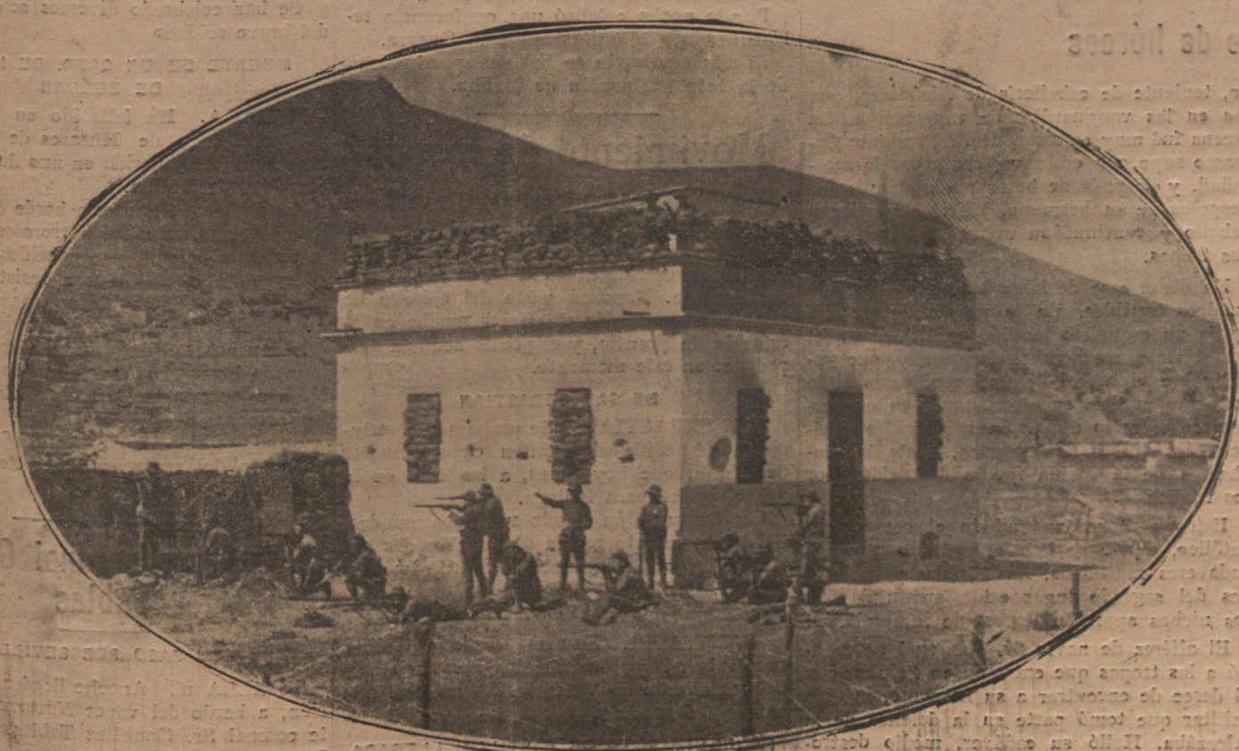
LA GUERRA.—Tiroteo con el enemigo desde la caseta del ferrocarril de Nador.

El trato que se les da allí es excelente.