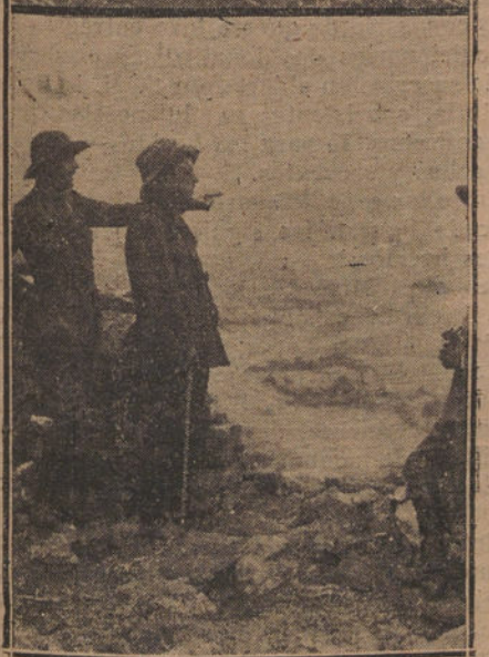
I. Vanguardia de una columna que va en busca del enemigo.—II. Tendiendo la alambrada en una nueva posición.—III. Ametrallando al enemigo desde una altura.—IV. El general Sanjurjo contemplando el panorama desde la cima del Gurugu.