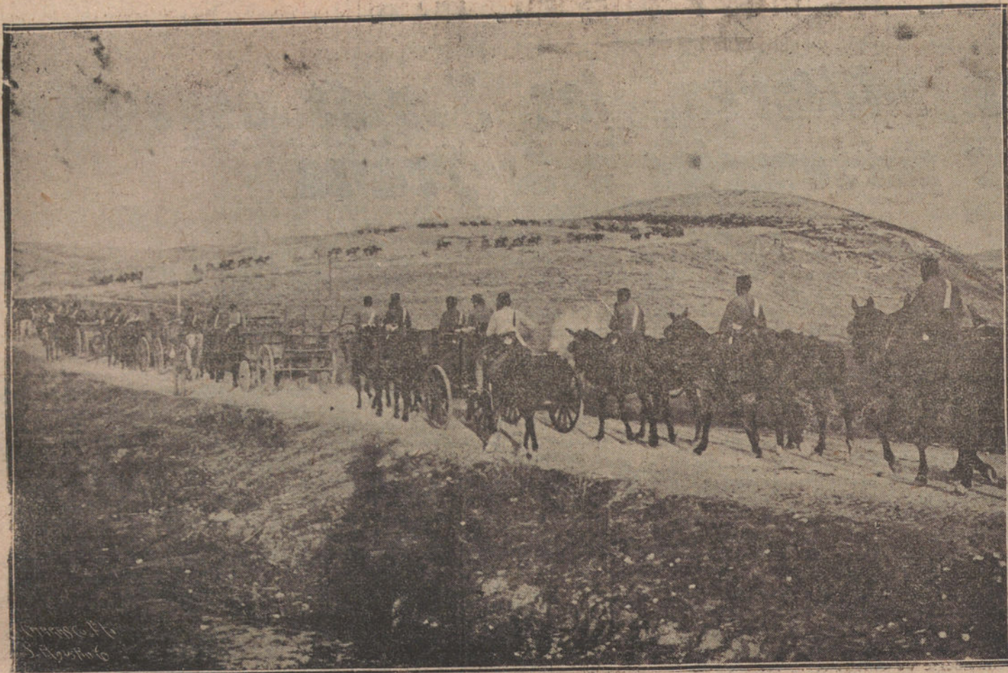
ESTAMPAS DE LA GUERRA.—Una columna de artillería dirigiéndose al Gurugú.