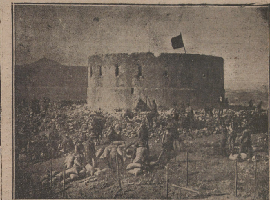
MELILLA. OCUPACION DE ZELUAN.—Fortín de Bugermanin ocupado por las tropas. La bandera del Tercio ondeando sobre el fortín.

—¿A ver esos planes!—pedirá un diputado de ronca voz, que no será Indalecio Prieto, que ha estudiado bien todo.