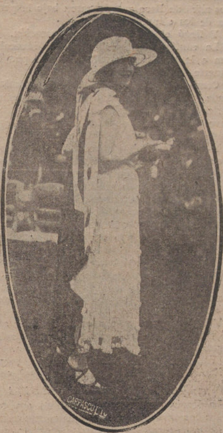
Modelo visto en las carreras de caballos de San Sebastián.