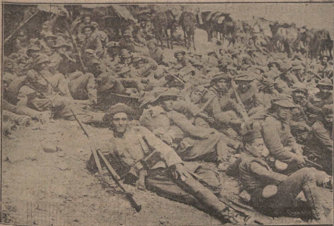
ESTAMPAS DE LA GUERRA.—Un descanso en la marcha.

En territorios Ceuta y Lázaro, sin novedad.