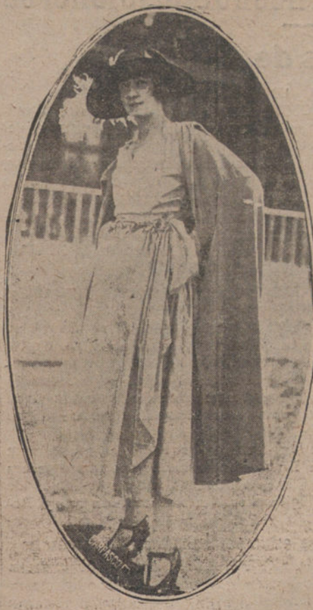
Modelo visto en las carreras de caballos de Madrid.

conteniendo de las bridas a su caballo para que ganase el otro, el conveniente.