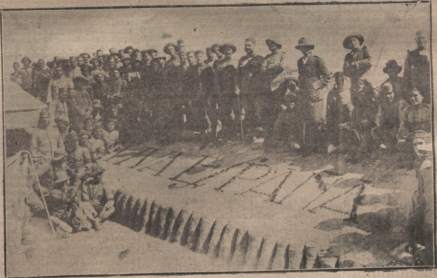
ESTAMPAS DE LA GUERRA.—Una inscripción patriótica en la fortificación de Sidi-Amorán.

El jefe de las oficinas de interpretación, el veterano Cerdeira, me sirvió de acompañante, introductor e intérprete. S. A. I. nos aguardaba, con su gran visir, en un pabelloncito del jardín, donde recibe las audiencias en verano. En Tetuán aún es verano. Después de las tres reverencias de rigor y de los saludos de etiqueta, el gran visir tomó la palabra en nombre de su señor. El gran visir es un hombre recio, alto, grande de cuerpo; lo que nosotros llamamos un morazo. Se expresa con un verbo abundante, cárido, enajado de expresiones y de figuras; un morazo que debe tener un enérgico colorido