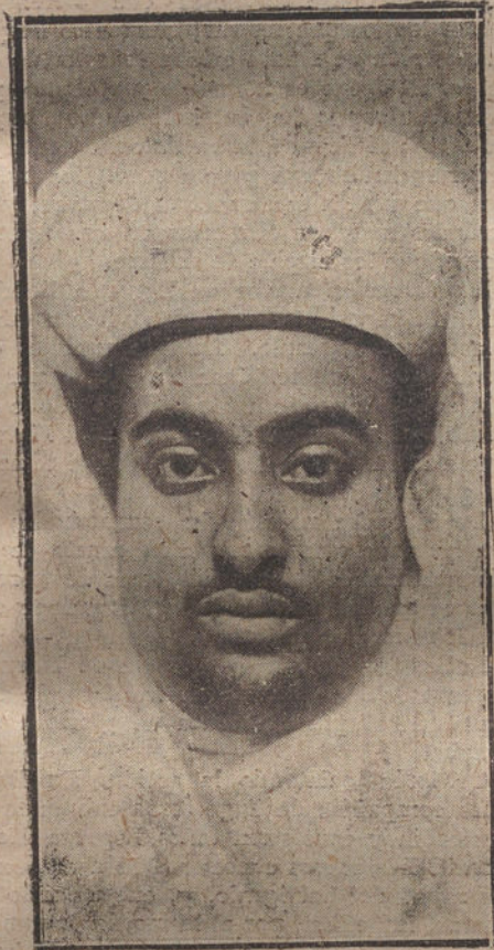
S. A. I. el Jalifa de nuestra zona Muley-el-Mehdi.

digné fijarme el día del sábado y once horas de la mañana.