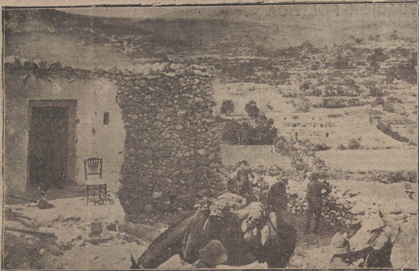
ESTAMPAS DE LA GUERRA. — Un aspecto de las célebres casas de los Chorjos.