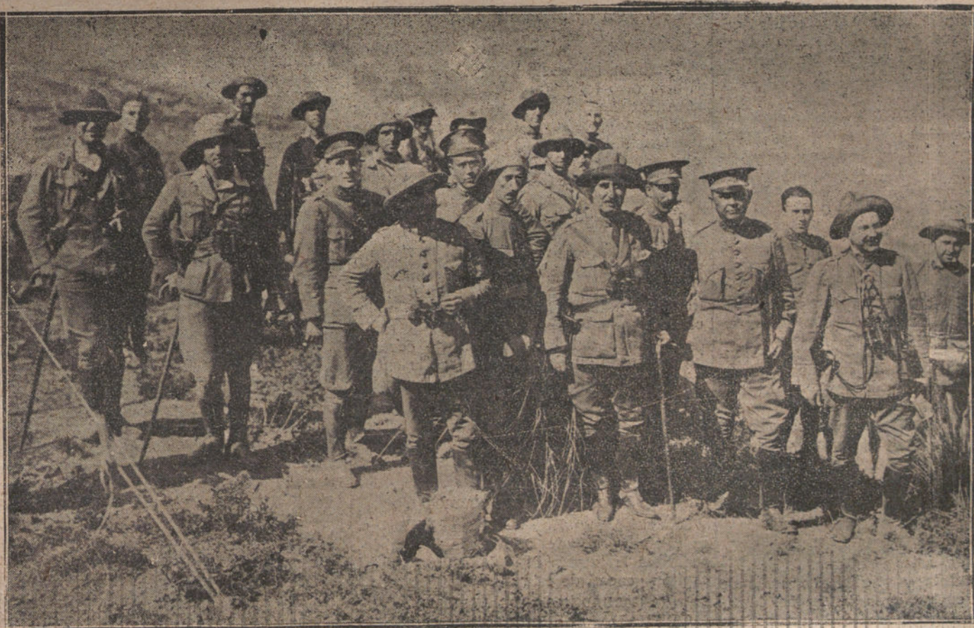
FIGURAS DE LA GUERRA.—El general Fresneda, gobernador militar de Melilla, con su cuartel general

MELILLA. Dos moros que pasaban por el barrio de Tesorillo, fueron apedreados por unos muchachos, librándose de aquella lluvia de piedras, gracias a que sabían correr. También en el barrio del Real un moro