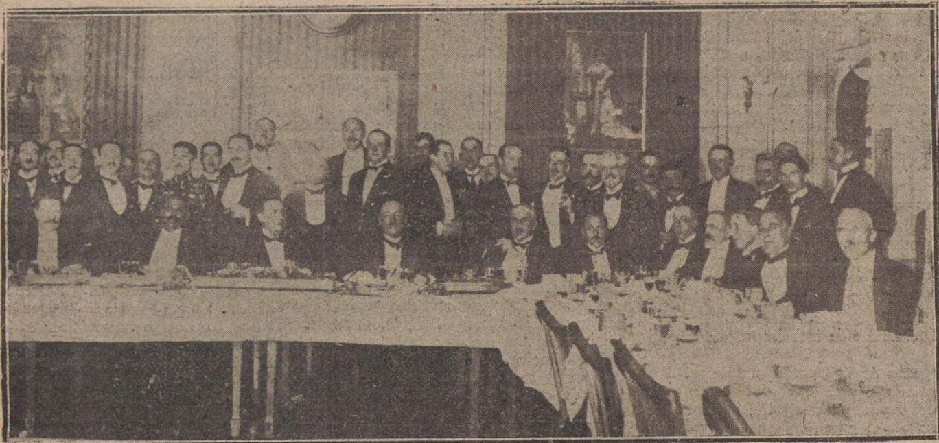
EN EL PALACE HOTEL.—Asistentes al banquete en honor de los delegados del Congreso aeronáutico internacional.

Traía antes los comestibles, las cartas y algunos periódicos un moro, al que apodábamos «Pistolita», porque se presentaba de continuo ante nosotros empujando una pistola. Traía los encargos de nuestras familias; pero interviniéndolo todo, con acritud. Por fortuna, este «consumero» ha sido re-