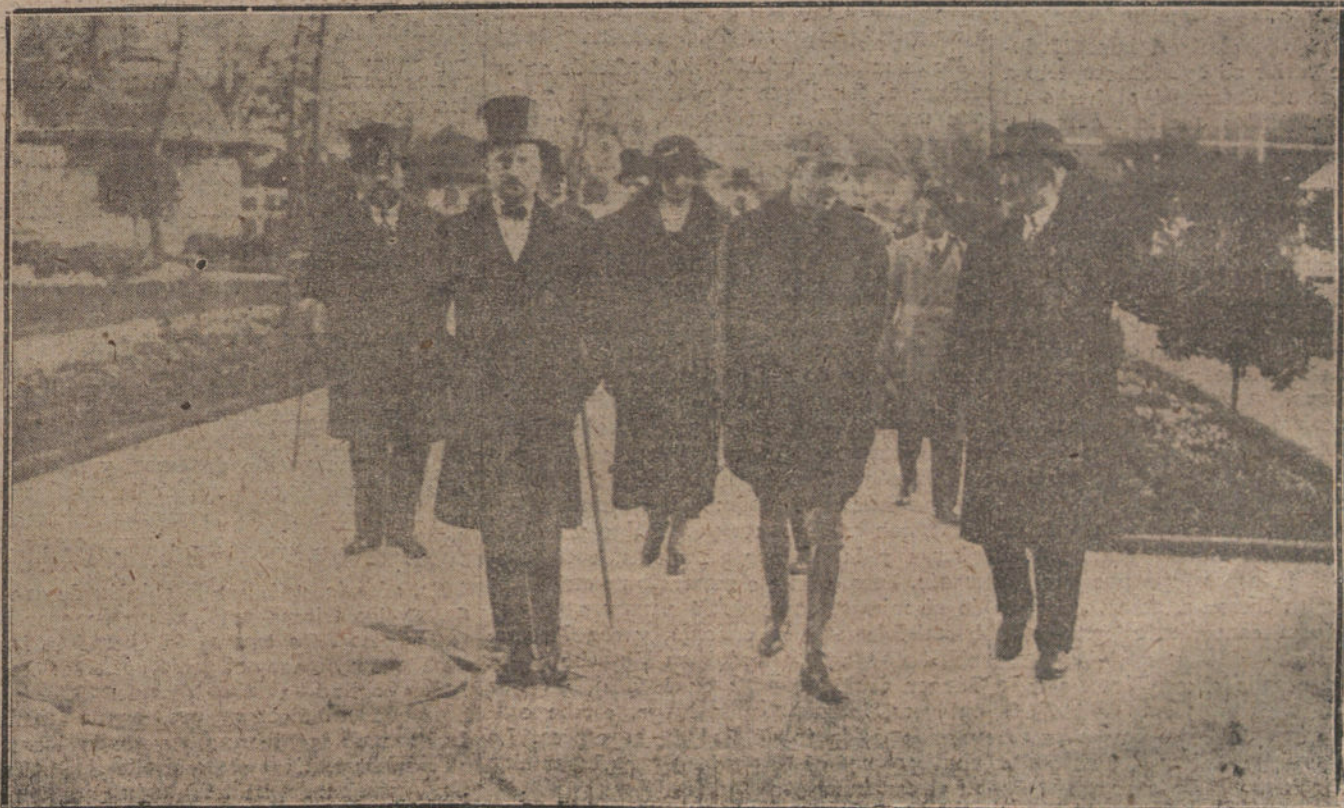
EL PARQUE ZOOLOGICO. — Sus Majestades los Reyes durante la visita a dicho Parque.

Continúan llegando a Ceuta heridos pertenecientes a la mehalla jerrana, Tercio de voluntarios y regimiento de Saboya.