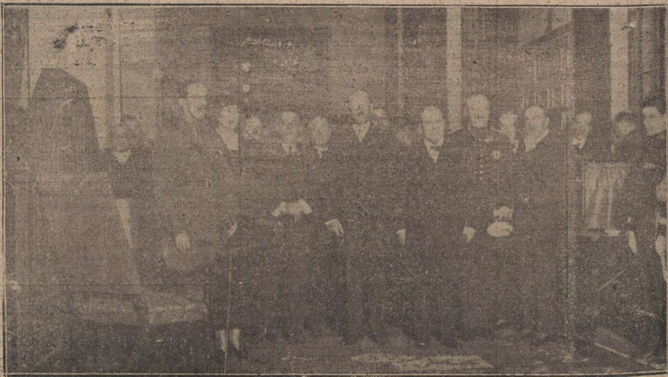
EN LA CASA DE CORREOS.—Sus Majestades los Reyes, que asistieron ayer a la sesión estatutaria de la Federación aeronáutica internacional.

Se sabe que los rebeldes han instalado un taller de reparaciones en Dar-Drius, en que