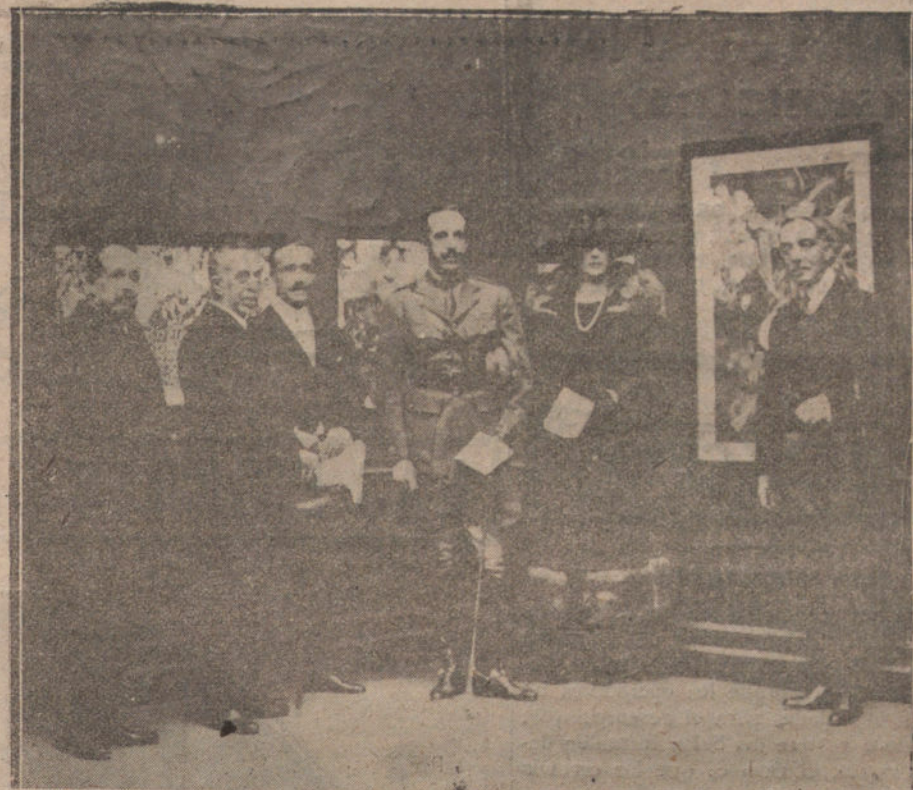
EN EL SALON DE OTONO.—Sus Majestades los Reyes visitando la Exposición.