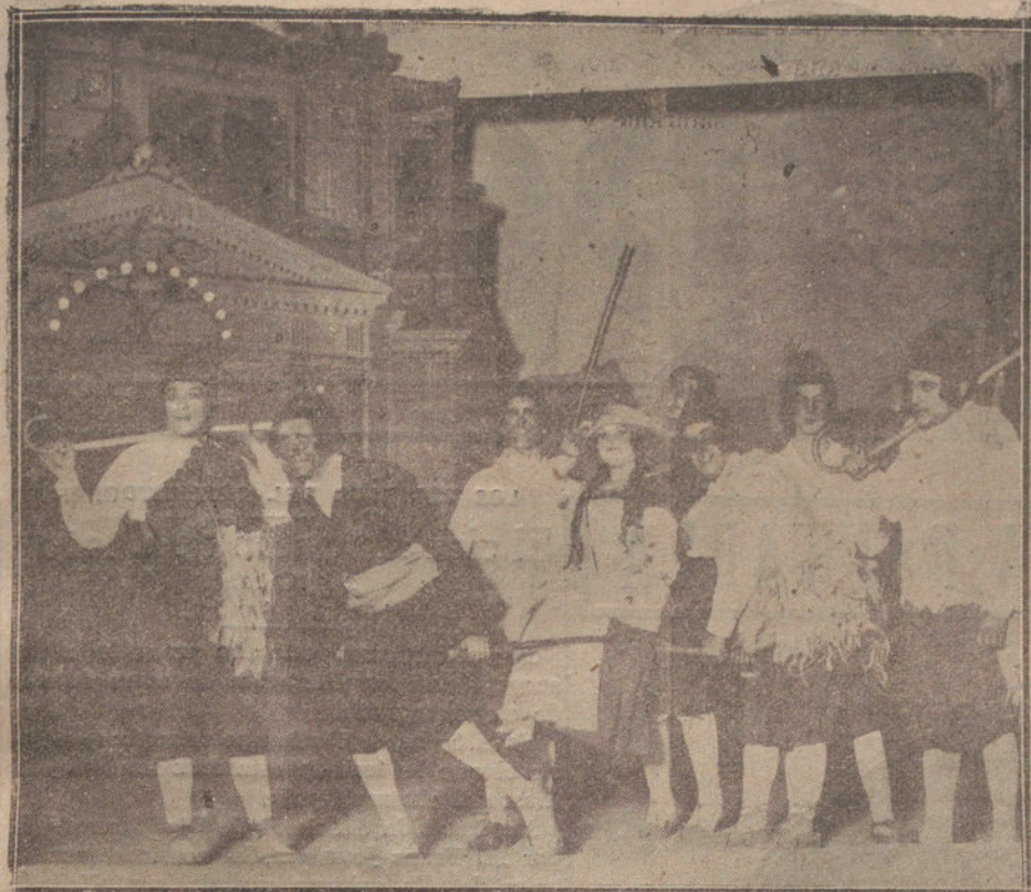
LOS TEATROS.—Una escena de «El sinvergüenza en Palacio», estrenada ayer en Apolo.