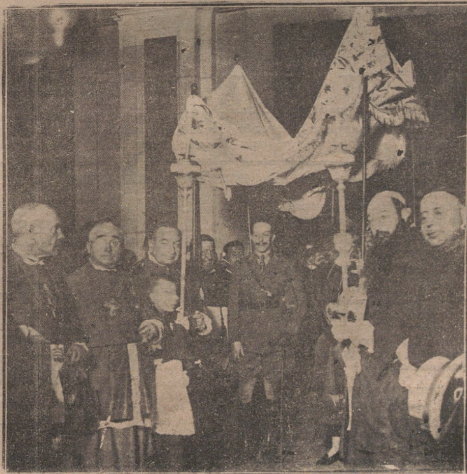
EL CONGRESO TERCARIO FRANCISCANO.—Sus Majestades los Reyes saliendo de San Francisco el Grande, después de la apertura del Congreso.