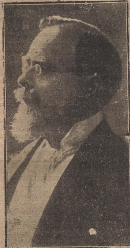
El gran pintor D. Francisco Pradilla, muerto ayer en Madrid.

El glorioso artista, acometido por una gran parálisis, se hallaba en inminente peligro desde hace dos meses. Se le alimentaba artificialmente, carecía del uso de la palabra, y sólo su robusta naturaleza, de