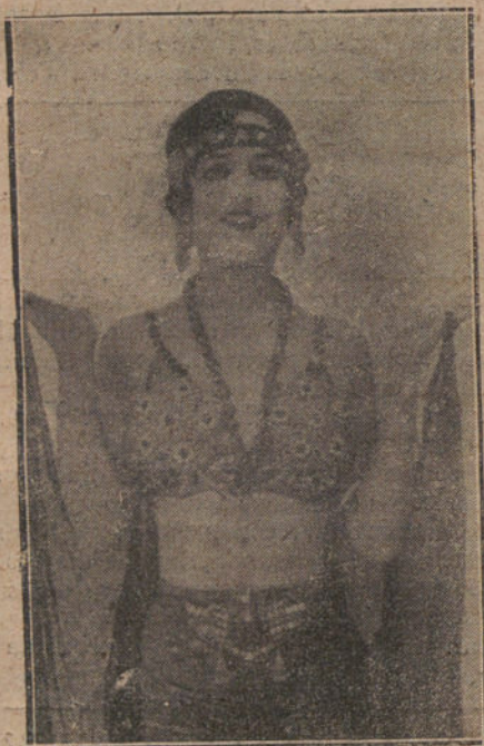
La Bella Rahna, que está obteniendo un gran éxito en París.

Convidadas por las multitudes pudientes que llenan París, exceden la medida de su