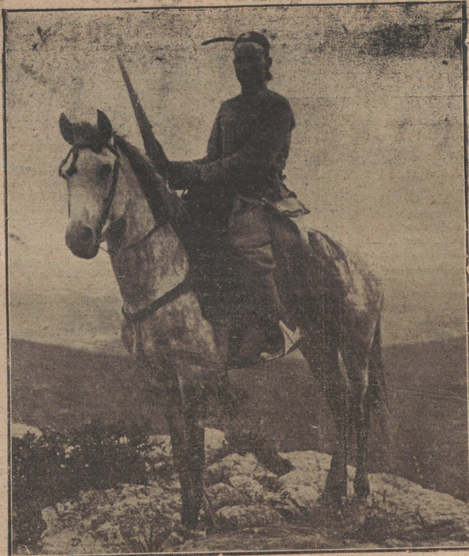
LOS TRAIDORES.—Soldado de la Policía indígena de Melilla, de los que se pasaron al enemigo al surgir el desastre.