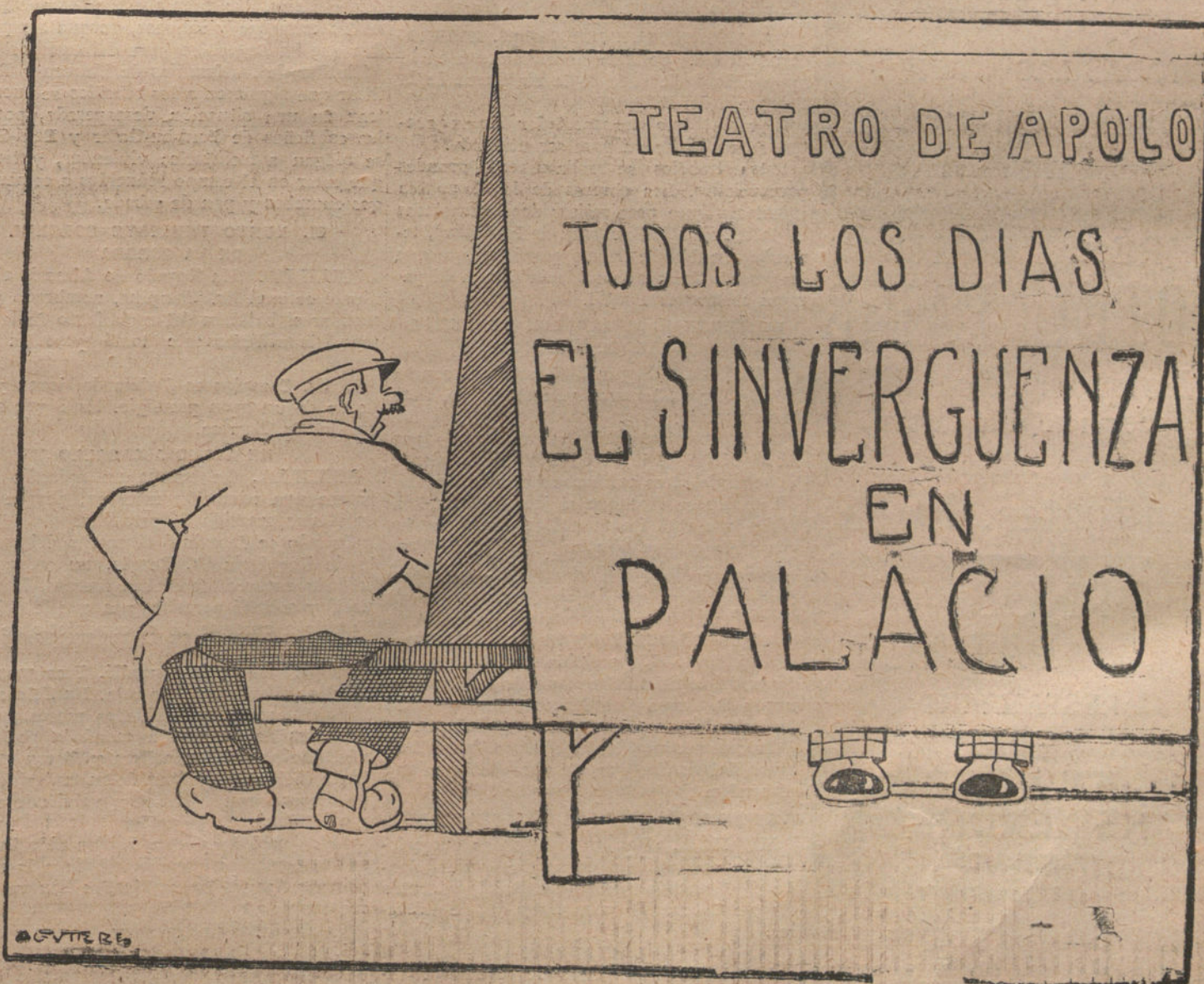
Viendo el cartel de Apolo.