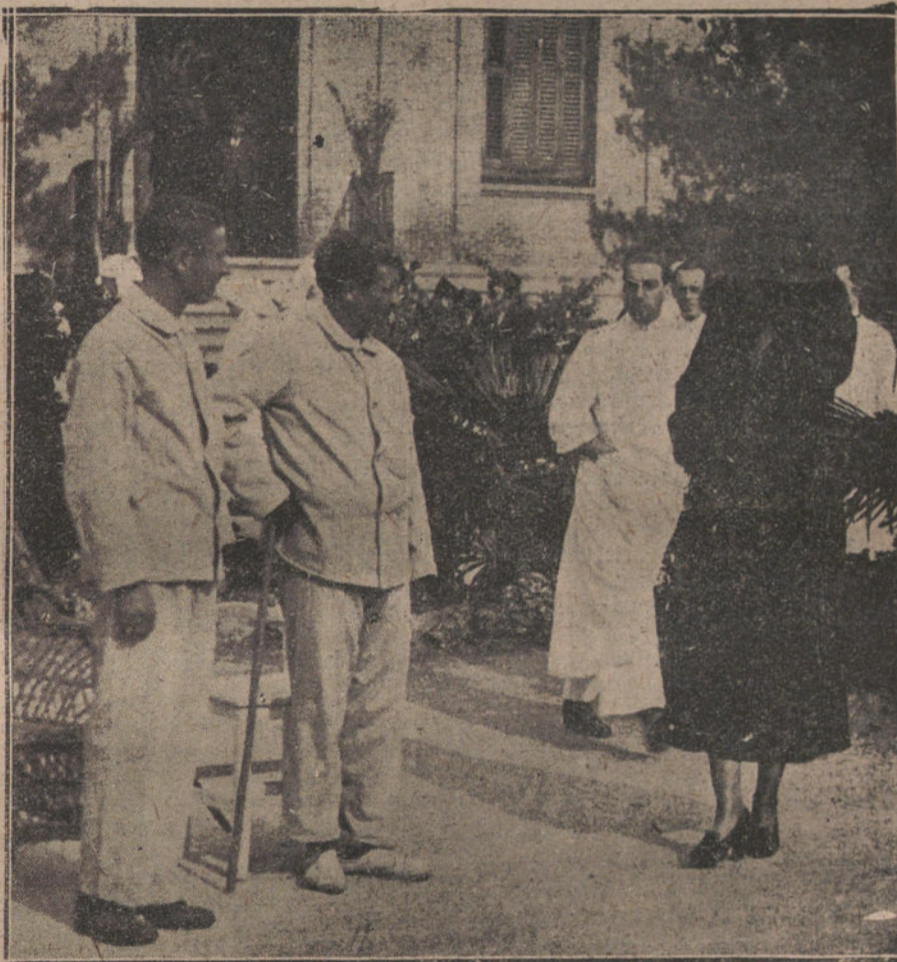
SU MAJESTAD LA REINA CONVERSANDO CON LOS SOLDADOS HERIDOS EN LA GUERRA QUE SE HALLAN EN EL HOSPITAL DE SAN JOSE Y SANTA ADELA

La referencia oficiosa dada por el señor Alba, refleja sintéticamente lo ocurrido en la reunión, en la que el jefe del Go-