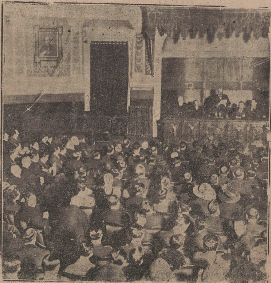
EN EL ATENEO: EL CONDE DE ROMANONES LEYENDO EL DISCURSO DE INAUGURACION DE CURSO