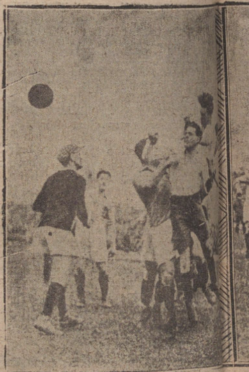
SANTISIMOS MOMENTOS DELA PA GANADO POR EL PRIN DE E