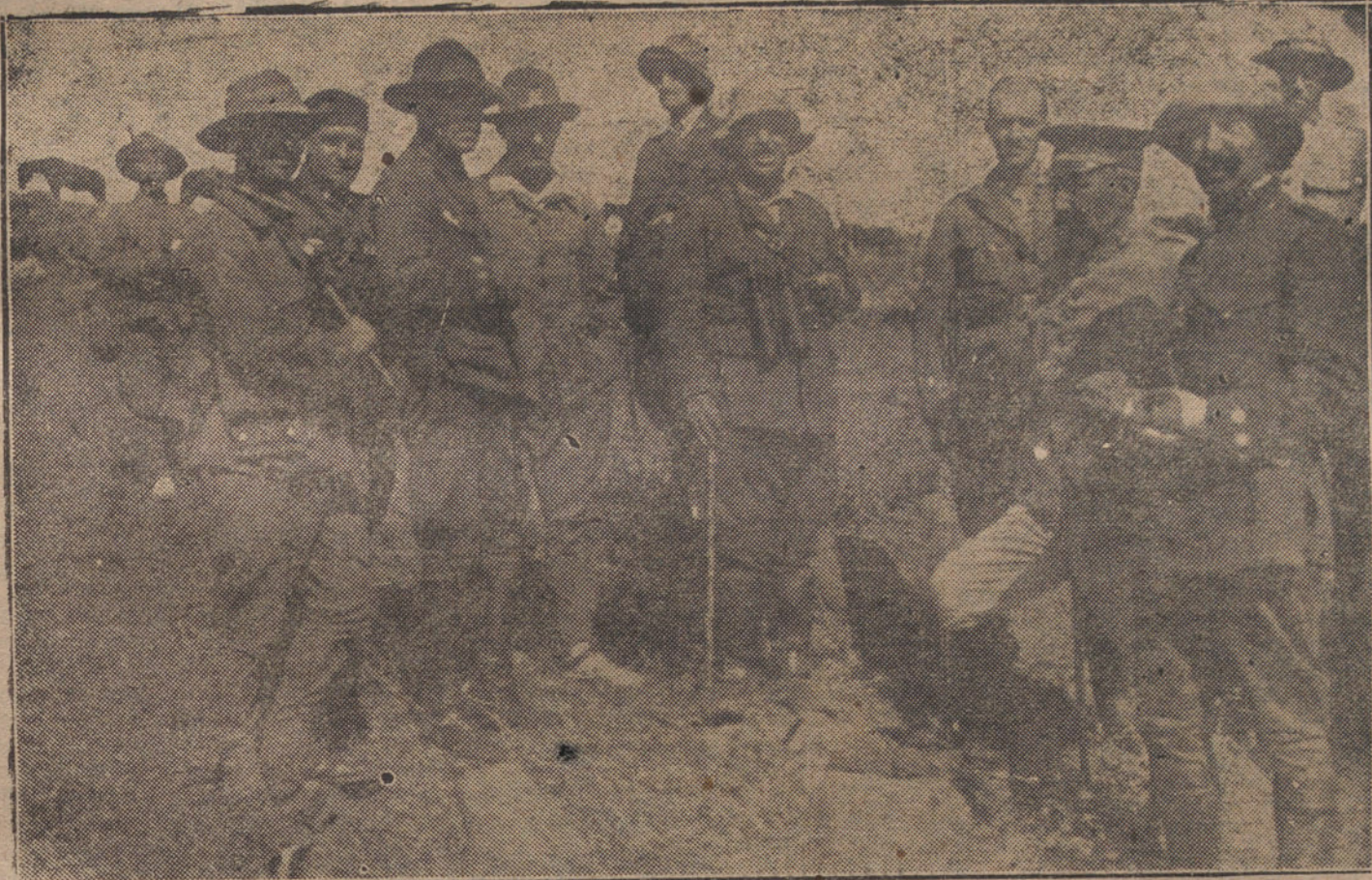
EN MELILLA.—LA TOMA DE LA SIERRA DE LA ESPONJA.—EL GENERAL SANJURJO (1) Y EL COMANDANTE FRANCO (2), QUE EMIGO EN CARGA A LA BAYONETADESALOJARON DE SUS TRINCHERAS AL EN AL FRENTE DE LOS LEGIONARIOS