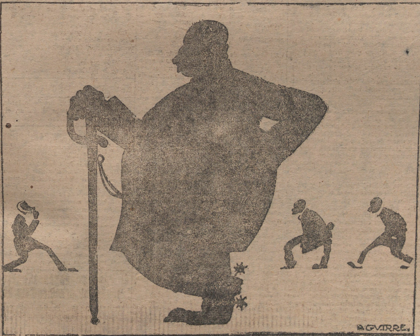
D. Juan Cierva y Peñafiel en la graciosísima película "El general de complemento".