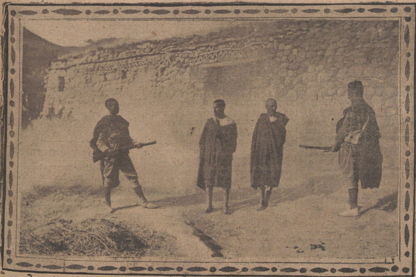
DOZ CAPTURADOS POR LA POLICIA INDIGENA EN EL MOMENTO EN QUE SALIAN DE UNA CASA A LA QUE PRENDIERON FUEGO NUESTRAS TROPAS