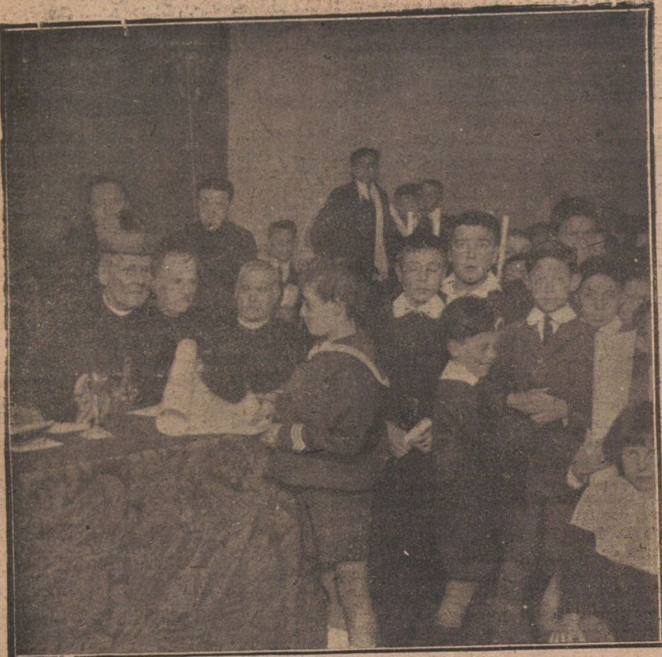
EN EL COLEGIO DE LOS PADRES AGUSTINOS.—EL PATRIARCA DE LAS INDIAS REPARTIENDO LOS PREMIOS A LOS ALUMNOS