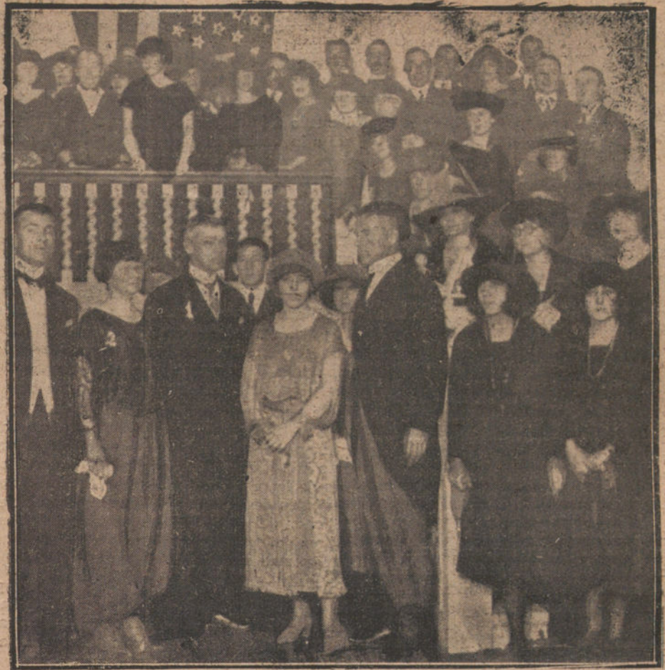
RECEPCION EN LA EMBAJADA DE LOS ESTADOS UNIDOS.—EL NUEVO EMBAJADOR, MR. WOOD (1), Y SU ESPOSA (2), CON LOS CONCURRENTES A LA RECEPCION

El diputado Sr. Gravina resultó herido de gravedad.