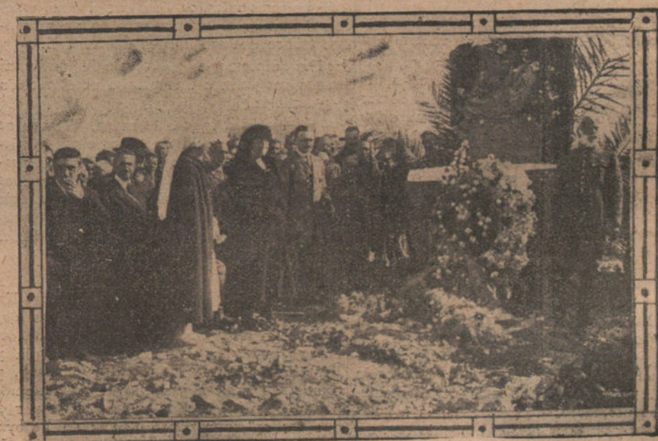
EN MONTE ARRUIT.—EL GENERAL CABANELLAS PRONUNCIANDO UN DISCURSO ANTE LA ZANJA DONDE YACEN ENTERRADOS TRES MIL CADAVERES ESPAÑOLES

Una Comisión de los manifestantes fue recibida por el canciller y por el ministro de Hacienda.