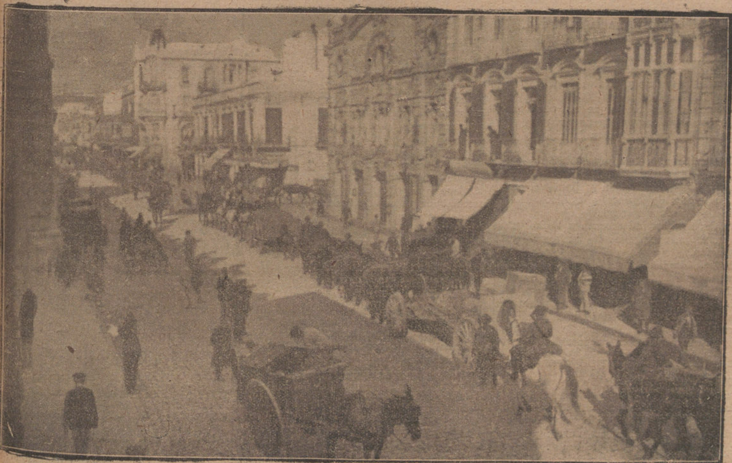
LLEGADA DE LAS TROPAS A MELILLA.—EL GRUPO DE INSTRUCCIÓN DE ARTILLERÍA DESFILANDO POR LA CALLE DE ALFONSO XIII

Se trata, en efecto, de que el Banco London County ha presentado un escrito judicial contra ciertos elementos por considerarse damnificado en 2 700 000 pesetas.