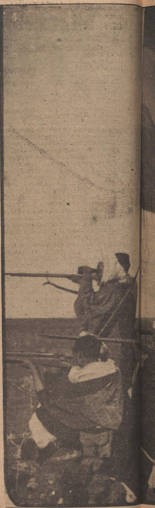
ABD-EL-KADER, JEFE DE LOS BENI-SICAR, JARCA AMIGA DURANTE