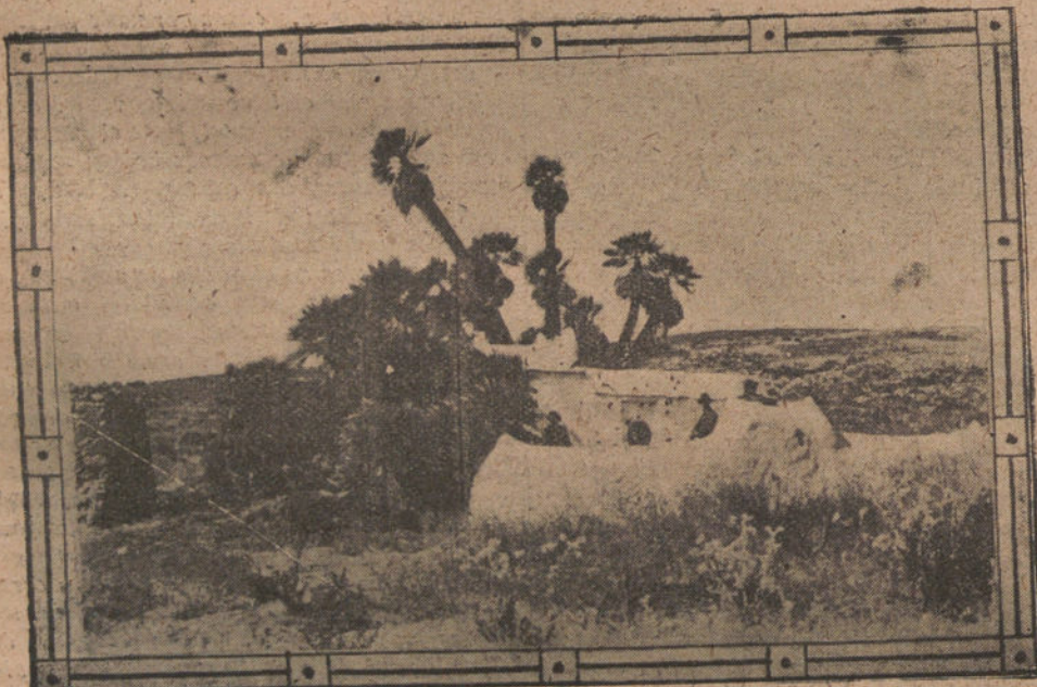
DE MELILLA.—LA PUERTA DEL MORABITO DE BENI-SICAR, ACRIBILLADA A BALAZOS POR NUESTRAS TROPAS.