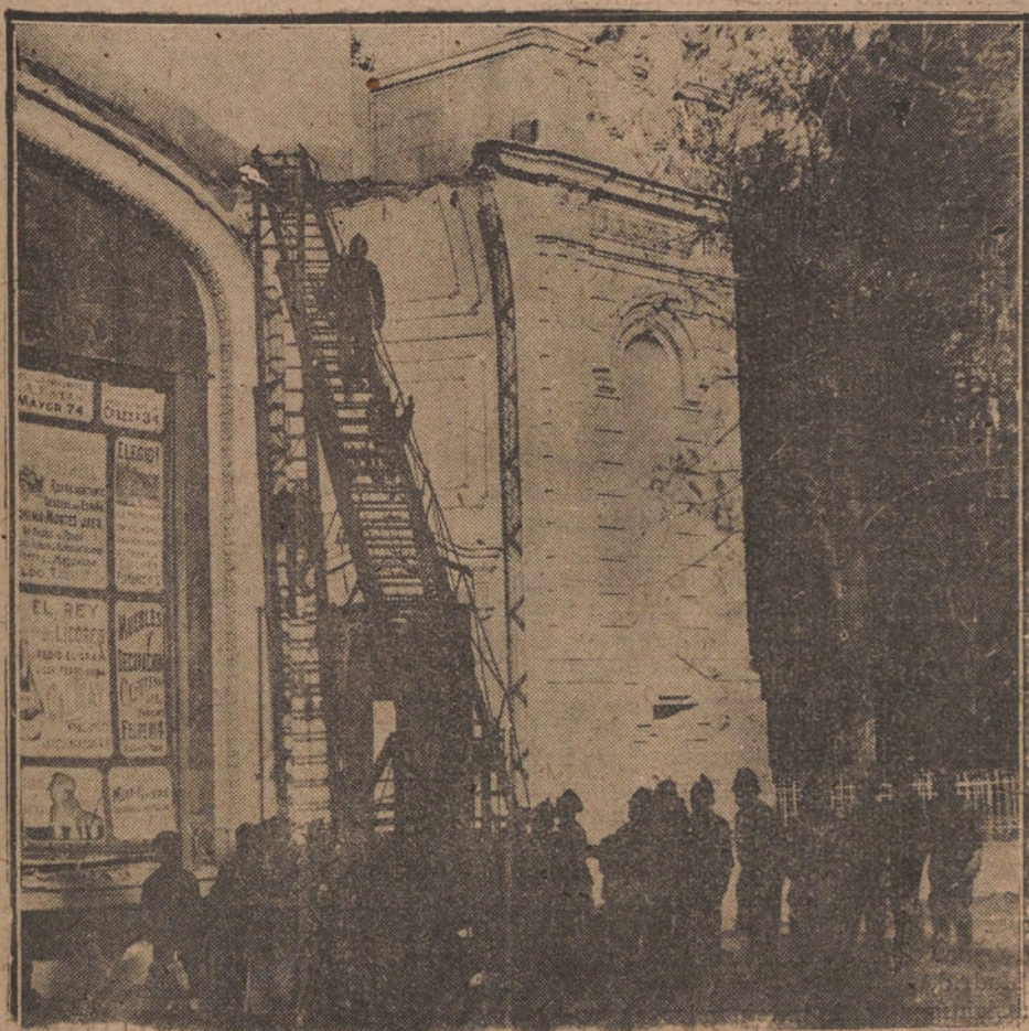
EL SUCESO DEL RETIRO.—COMO QUEDÓ EL ESCENARIO DEL TEATRO DESPUÉS DEL UNIFORME CENSA CORNISA

Hasta esta tarde no podrá saberse nada, con carácter definitivo, acerca de la situación del Gobierno, y muy particularmente, si los partidos constitucionales se declaran en abierta oposición contra él.