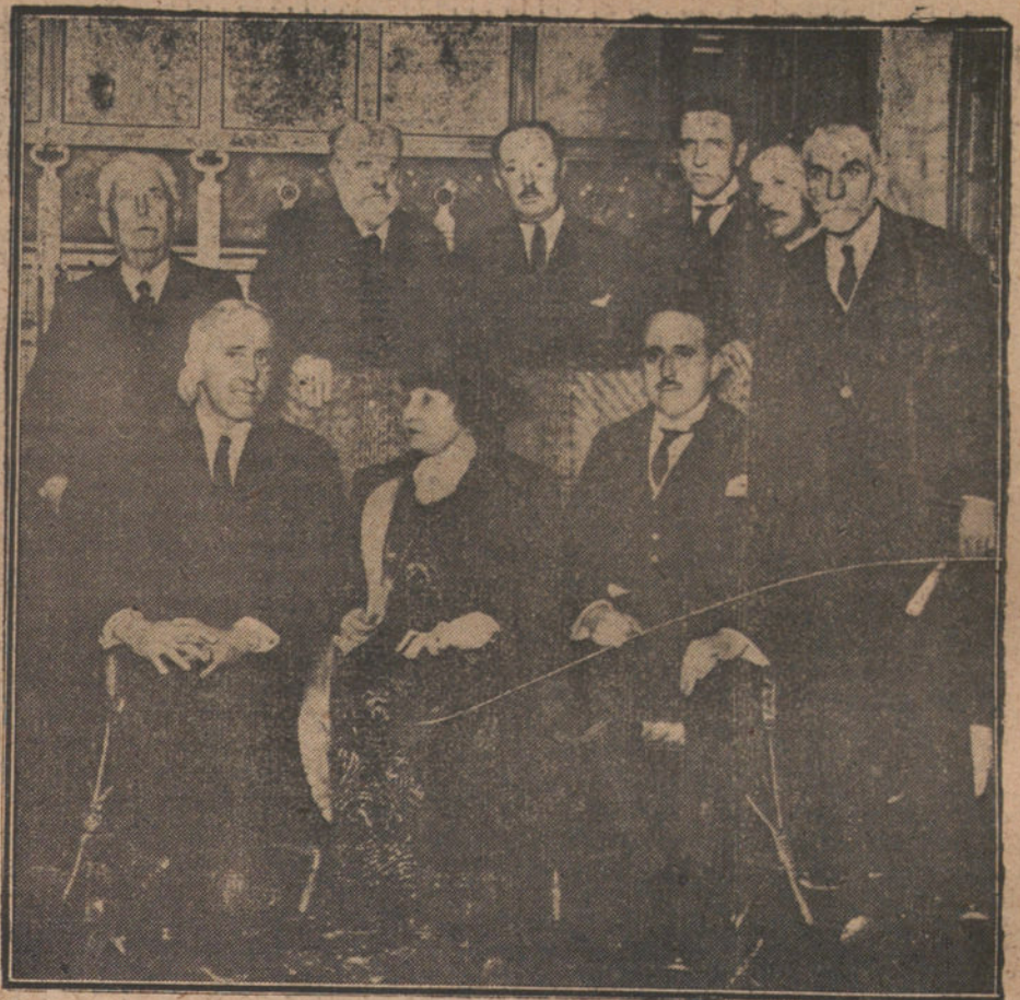
HOMENAJE A FERRARI.—EL HIJO DEL POETA CON LAS PERSONALIDADES QUE TOMARON PARTE EN EL ACTO CELEBRADO EL SABADO EN EL ATENEO

Hasta la fecha se ignoran las causas de este siniestro.