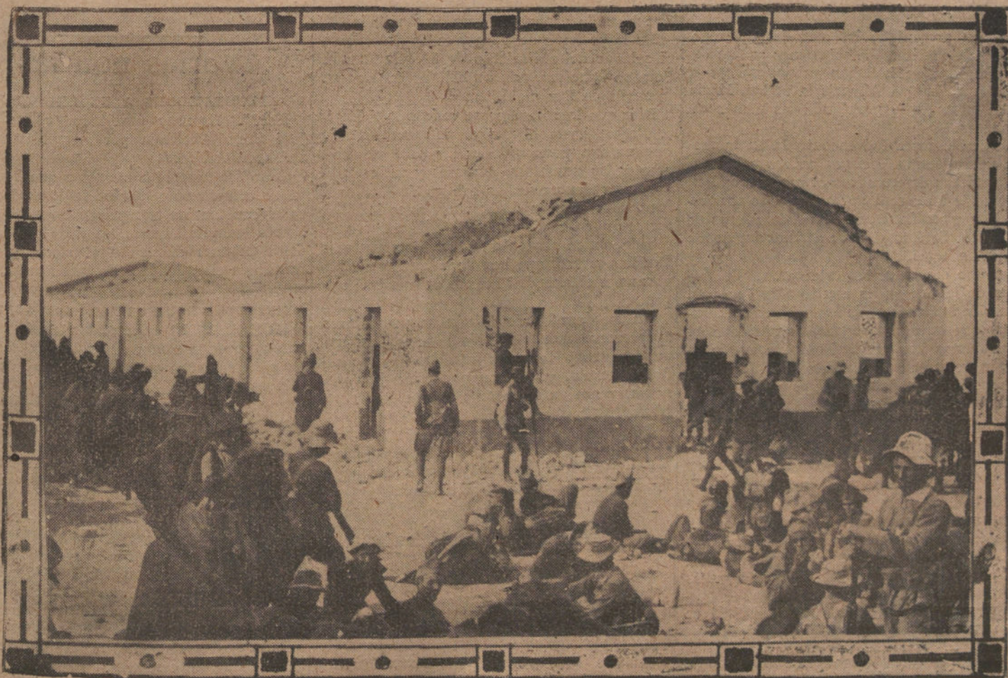
LA OCUPACION DE TAURIAT HAMED.—ESTADO EN QUE SE ENCONTRABA EL INTERIOR DE LA POSICION

Según los informes adquiridos en la residencia del primer ministro, al terminar dicha conferencia, parece que la situación permite abrigar muy pocas esperanzas, aun cuando no parece improbable que llegue a celebrarse una nueva reunión.