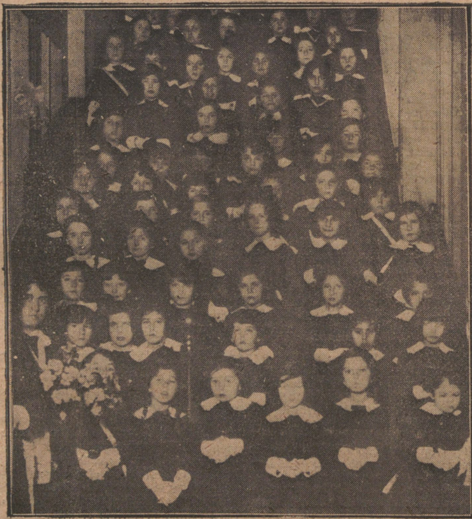
LAS ALUMNAS DEL COLEGIO DEL SAGRADO CORAZON, ESPERANDO LA LLEGADA DE LA FAMILIA REAL PARA INAUGURAR EL ROPERO DE SANTA VICTORIA