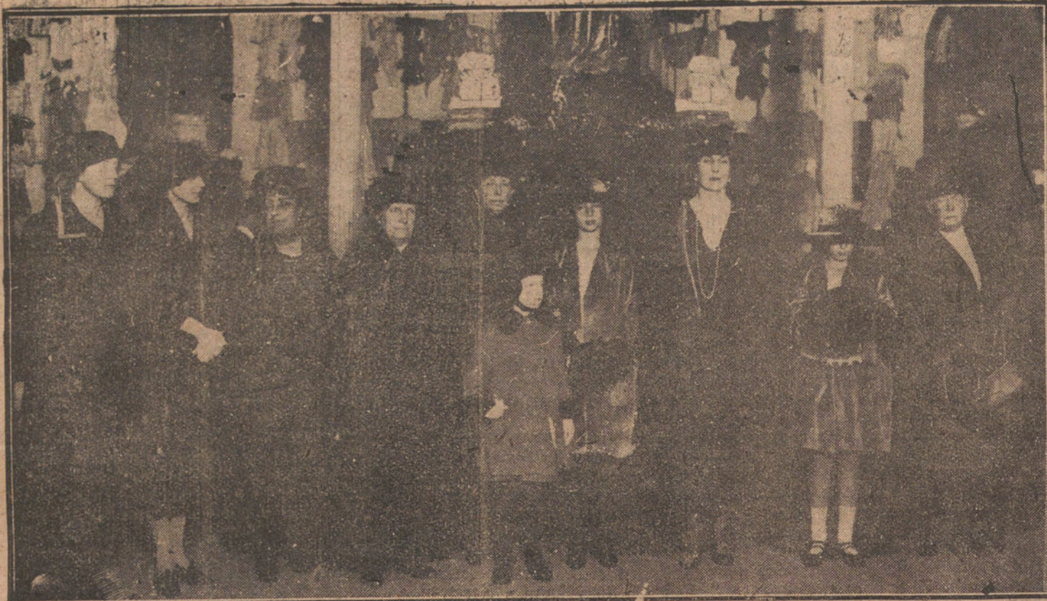
EL ROPERO DE SANTA VICTORIA.—LA FAMILIA REAL EN LA INAUGURACION DEL ROPERO