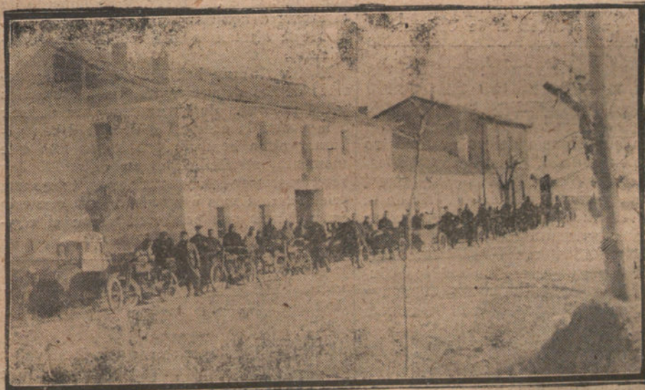
PRUEBAS DEL EQUIPO DE MOTOCICLETAS HARLEY DAVIDSON, QUE ANTE EL ÉXITO OBTENIDO FUERON ADQUIRIDAS Y ENVÍADAS EN EL ACTO A MARRUECOS