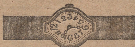
Núm. 2. -- Máquina de precisión, sobre ru- bís, oro de ley, 18 quilates, con pulsera de moiré. Ptas. 125