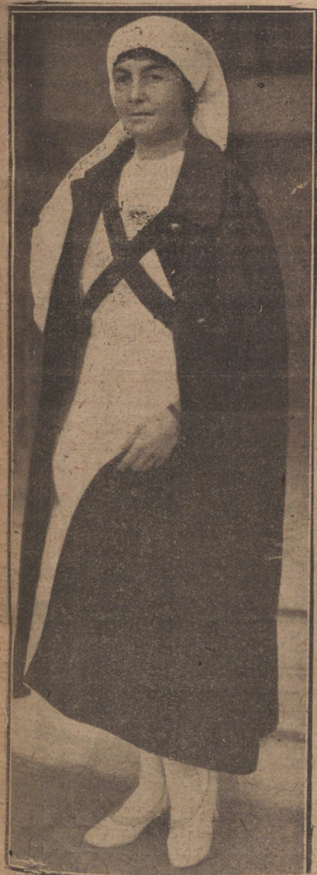
LA DUQUESA DE LA VICTORIA A LA QUE SE HA CONCEDIDO LA GRAN CRUZ DE BENEFICENCIA, COMO PREMIO A SU HERMOSA LABOR EN LOS HOSPITALES DE MELILLA