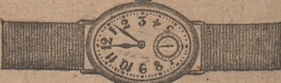
Núm. 6. -- Ovalado, áncora especial, oro de ley, 18 quilates, con pulsera de moiré. Ptas. 225