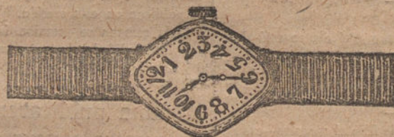
Núm. 1. -- Rombo, máquina fina, oro de ley, 18 quilates, con pulsera de moiré. Ptas. 110.

Formas modernas y elegantes. -- Máquinas finas de precisión. -- Garantía efectiva de buena marcha por cinco años.