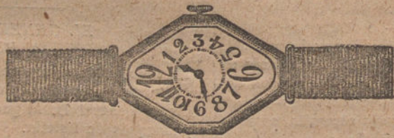
Núm. 3. -- Ancora de precisión, 15 rubíes, oro de ley, 18 quilates, con pulsera de moiré. Ptas. 150