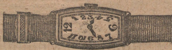
Núm. 5. -- "Tonneau", áncora de precisión, oro de ley, 18 quilates, con pulsera de moiré. Ptas. 200