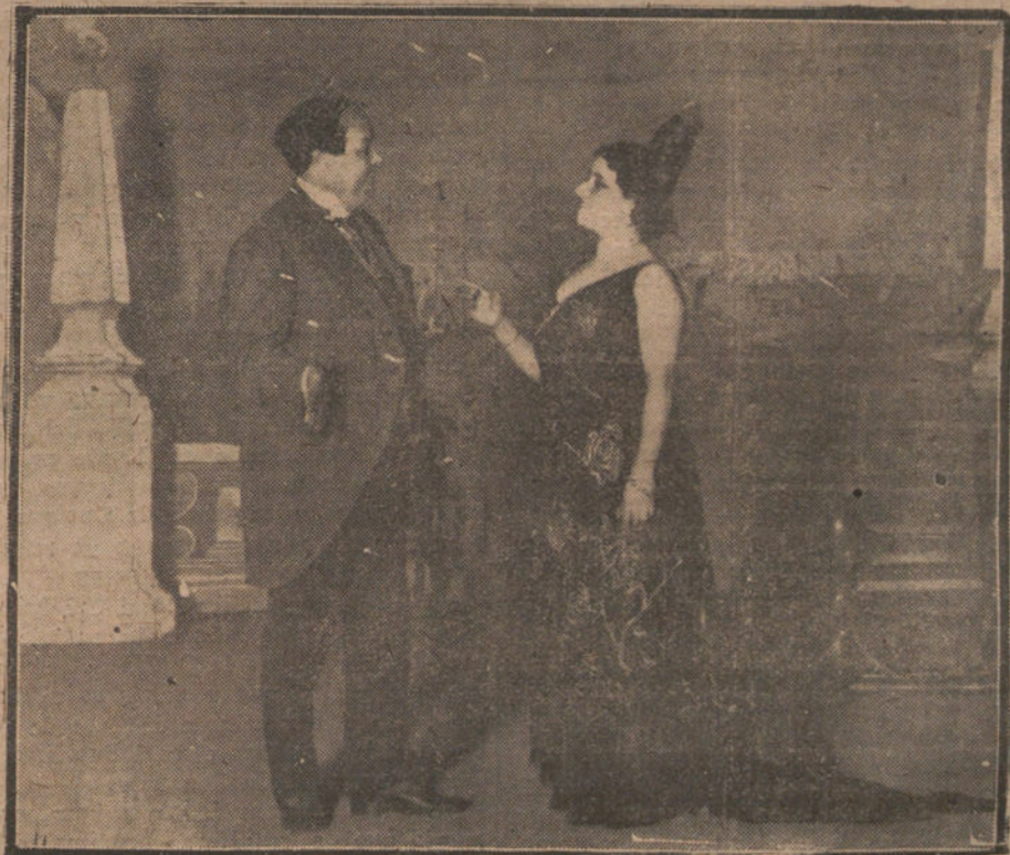
EN EL TEATRO DE APOLO.—UNA ESCENA DE «LA DIABLESE», QUE SE ESTRENA ESTA NOCHE