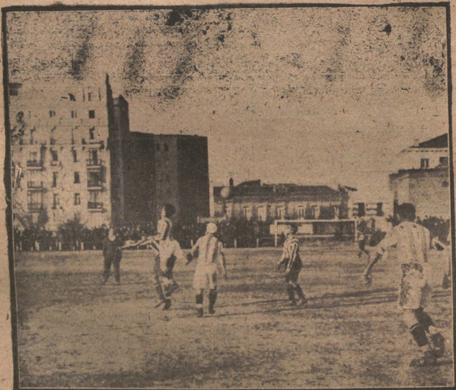
UN MOMENTO INTERESANTE DEL PARTIDO JUGADO AYER ENTRE LA REAL SOCIEDAD DE SAN SEBASTIAN Y EL ATHLETIC, DE MADRID