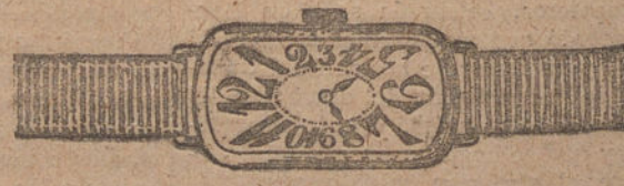
Núm. 4. -- Ancora de forma, oro de ley, 18 quilates, con pulsera de moiré. Ptas. 175