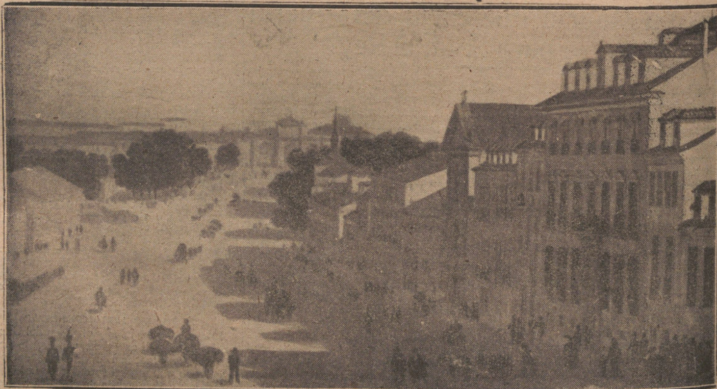
INTERESANTE ASPECTO DE LA BARRA DE LA CALLE DE DE ALCALA, FRENTE A LA CIBELES (PRINCIPIOS DEL SIGLO XIX). EN QUE SE VE YA EN EL SITIO SEÑALADO CON EL NUM. 1 EN LA FACHADA, EL EDIFICIO DEL INSTITUTO HIDROGRAFICO Y CON DOS ASPAS (XX) EL CONVENTO DE LAS BARONESAS