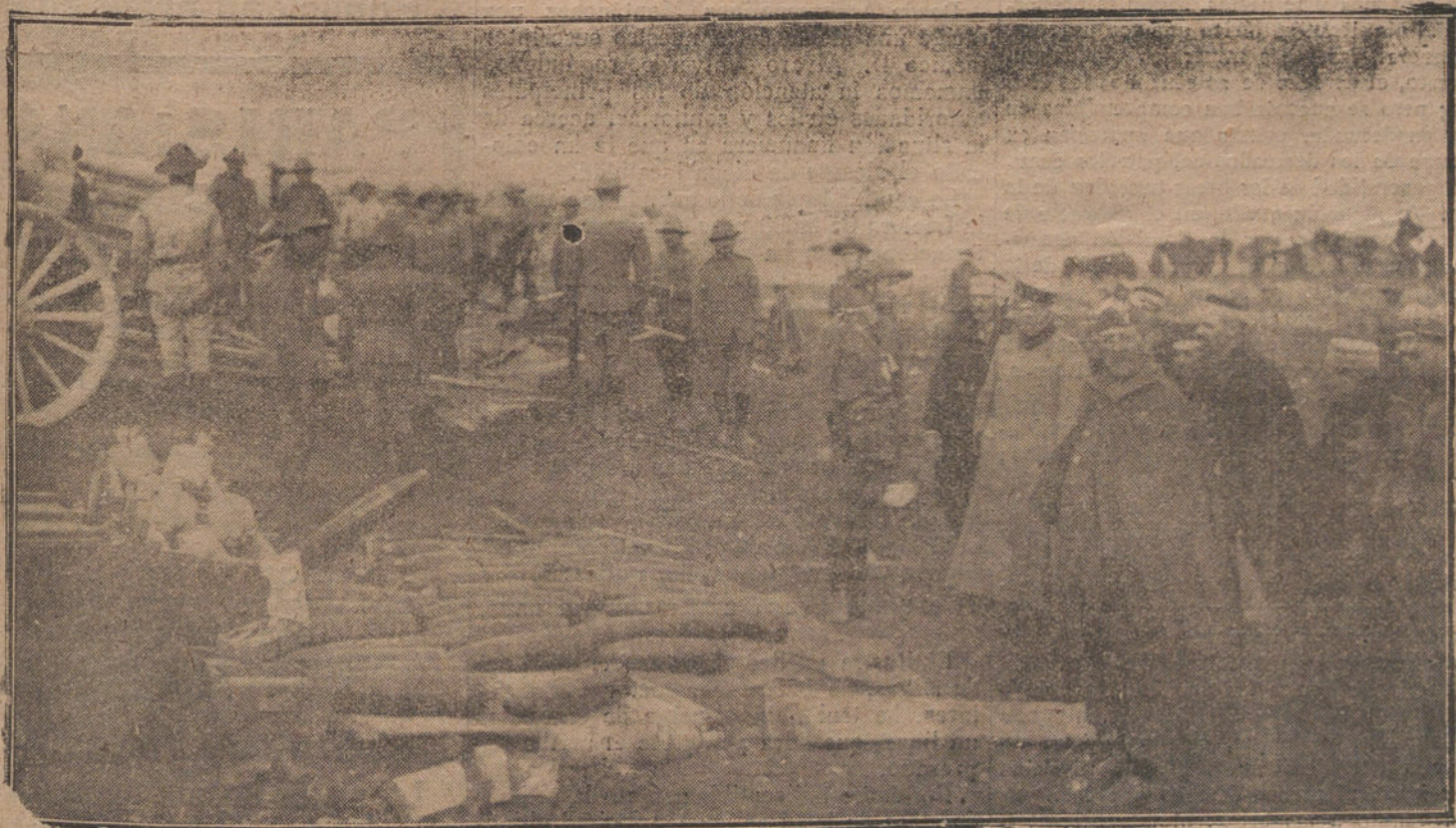
MELILLA. OCUPACION DEL HARCHA.—EL INFANTE D. CARLOS Y EL GENERAL CAVALCANTI VIENDO EL EMPLEAMIENTO DE LOS NUEVOS CARONES DEL GRUPO DE INSTRUCCION, DURANTE EL COMBATE DEL HARCHA

MELILLA 8. La Cámara de Comercio de Melilla ha acordado contribuir con 1.000 pesetas