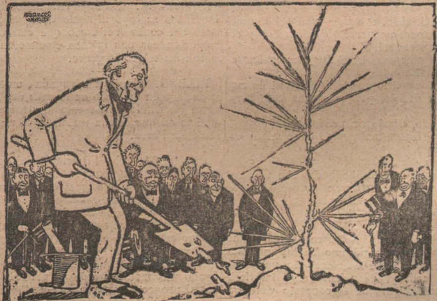
¿VA A PLANTAR LLOYD GEORGE UN ARBOL EN NUESTROS CAMPOS, SIMBOLIZANDO LA AMISTAD DE INGLATERRA POR FRANCIA? (De «Le Rire», de París.)