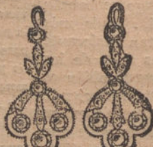
Núm. 4.—Pendientes 10 brillantes y diamantes. Ptas. 500