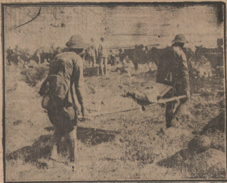
MELILLA. DEL ULTIMO AVANCE.—RETIRAN DO A UN HERIDO DE LA LINEA DE FUEGO