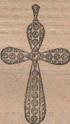
Núm. 1.—Cruz 17 brillantes y diamantes. Ptas. 650

con brillantes de primera calidad :-: Diamantes rosas de Holanda :-: Monturas de platino fino y oro de ley 18 quilates.