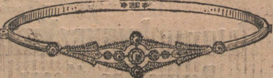
Núm. 8.—Pulsera nueve brillantes y diamantes. Ptas. 450