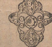
Núm. 6.—Sortija 5 brillantes y diamantes. Ptas. 550