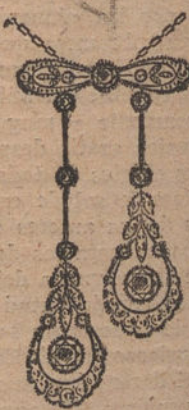
Núm. 5.—Pendiente 7 brillantes y diamantes. Ptas. 675