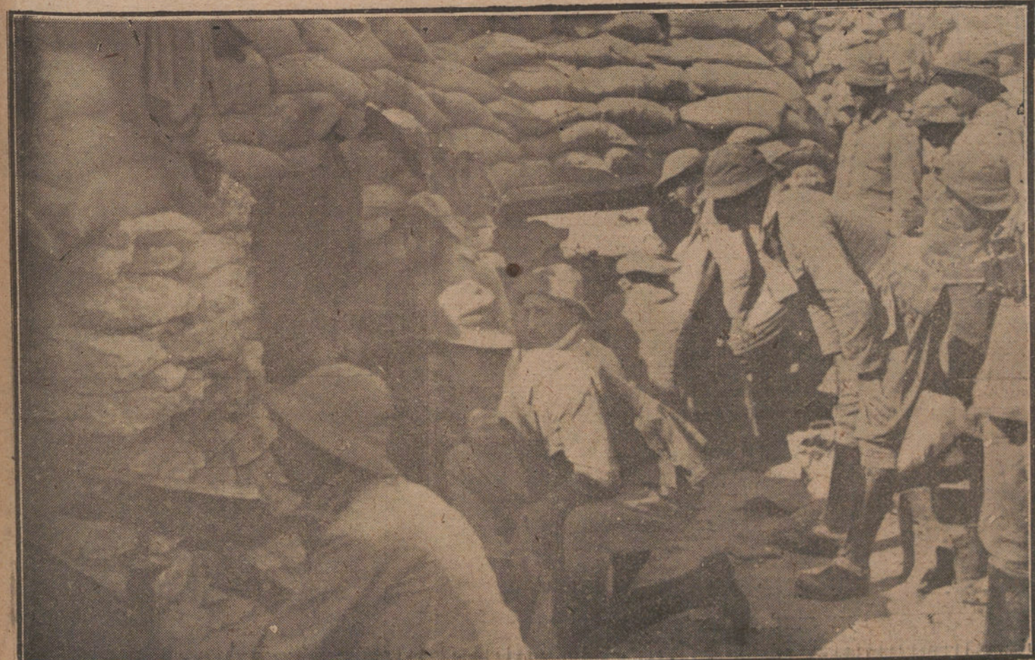
ESTAMPAS DE LA GUERRA.—AMETRALLADORAS DE LA POSICION DE TIZZA PROTEGIENDO EL AVANCE DE UNA COLUMNA

LONDRES 9. Telegrafían de Nueva York al «Daily Mail» que el famoso inventor americano Th. A. Edison ha declarado que, merced a un descubrimiento que acaba de realizar, considera posible hacer oro.