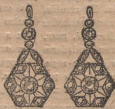
Núm. 2.—Pendientes 5 brillantes y diamantes. Ptas. 450