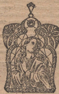
Núm. 3.—Medalla 3 brillantes y diamantes. Ptas. 500