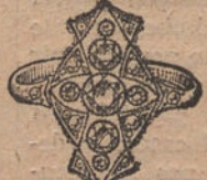
Núm. 7.—Sortija 7 brillantes y diamantes. Ptas. 600