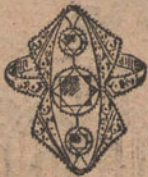
Núm. 9.—Sortija tres brillantes y diamantes. Ptas. 750