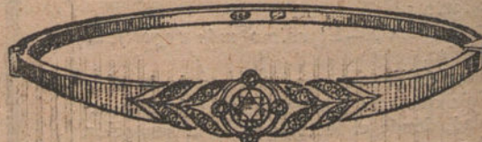
Núm. 10.—Pulsera cinco brillantes y diamantes. Ptas. 650