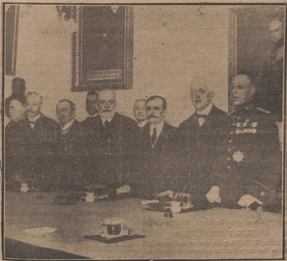
AYER SE CELEBRÓ EN LA REAL ACADEMIA DE LA HISTORIA UNA SESIÓN DE HOMENAJE A LA MEMORIA DEL REY ALFONSO «EL SABIO». EN LA FOTOGRAFIA APARECEN REUNIDAS LAS PERSONALIDADES QUE TOMARON PARTE EN EL ACTO