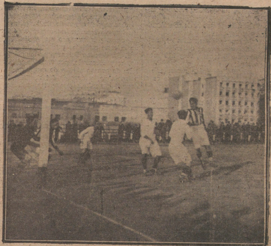
UN MOMENTO INTERESANTE DEL PARTIDO JUGADO ENTRE EL «BETIS» Y EL «MADRID»