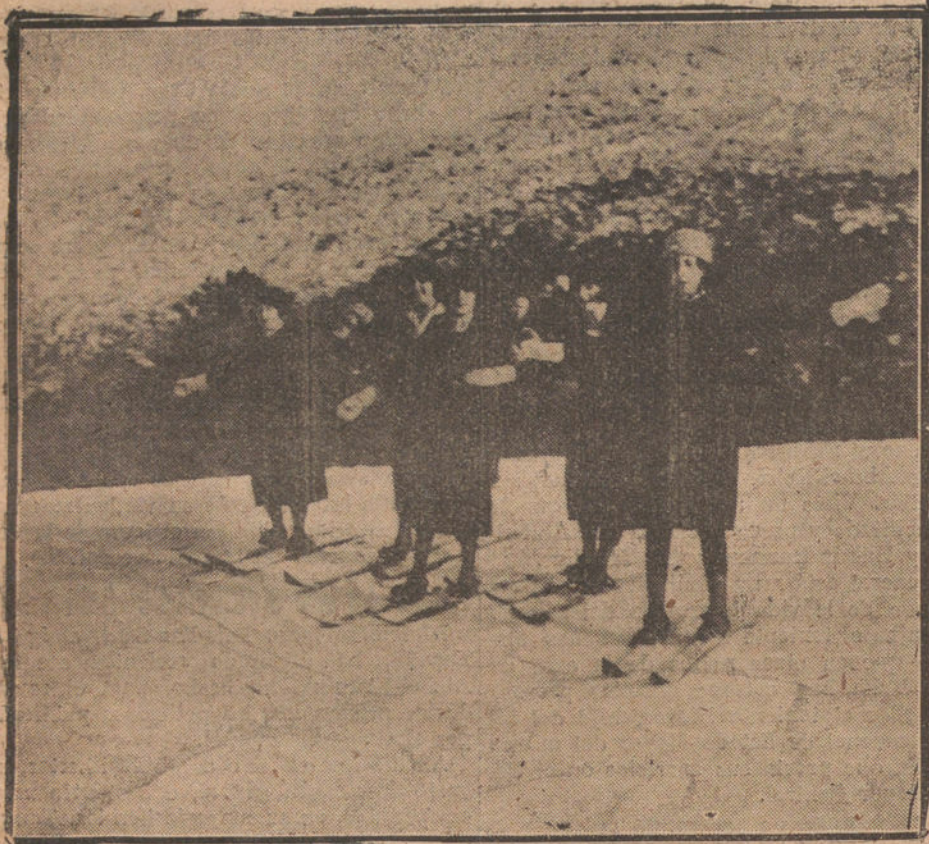
EN LA SIERRA.—LAS PRIMERAS NIEVES.