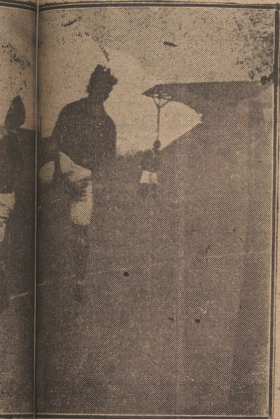
ADO POR EMPLEQUE RECIENTEMENTE. EL C. ABADO REPRESENTA EL EQUIPO DE DEVAQUER