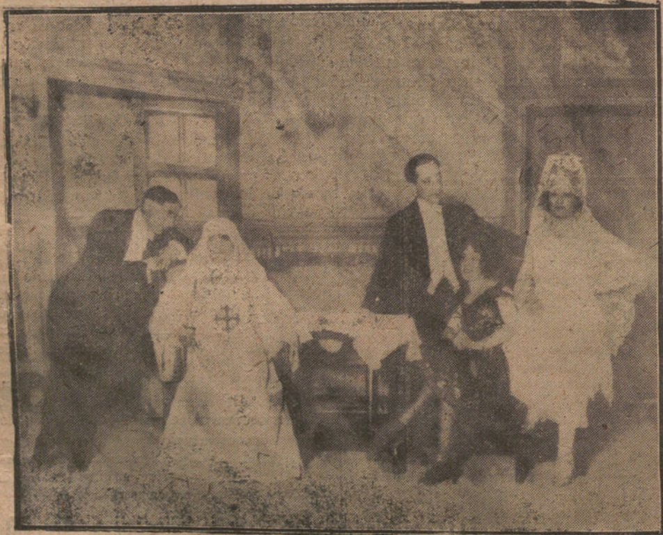
UNA ESCENA DE «LOS ILUSTRES DOCTORES». COMEDIA DE LINARES BECERRA Y ESTREMER, ESTRENADA ANOCHE, CON BUEN ÉXITO, EN EL TEATRO COMICO.

El comercio y los armadores reclaman pidiendo la reanudación de relaciones.