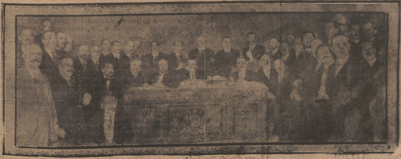
LA ASAMBLEA DE DIPUTACIONES. SESION DE APERTURA

Agua alcalina, sin rival para las vías urinarias. De venta en farmacias y droguerías.