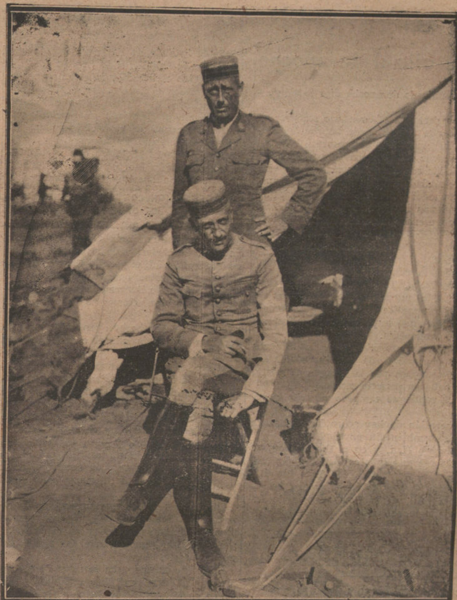
D. FELIPE Y D. RAMIRO DE BORBÓN, EN LA PUERTA DE LA TIENDA DE CAMPAÑA QUE OCUPAN EN EL CAMPAMENTO DEL ZAIO