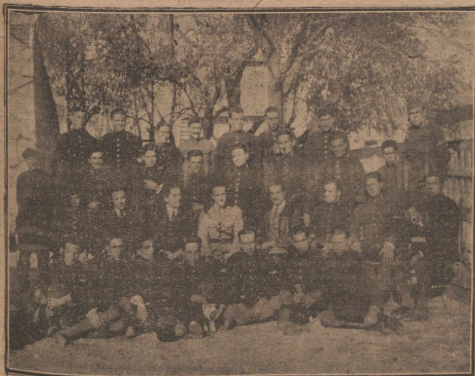
BANQUETE CELEBRADO POR LOS OFICIALES Y SOLDADOS DE AVIACION PARA FESTEJAR A SU PATRONA, LA VIRGEN DEL LORETO