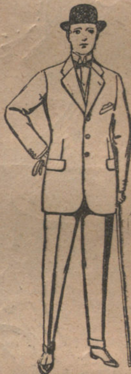
Trajes de cheviot, patén, etcétera.