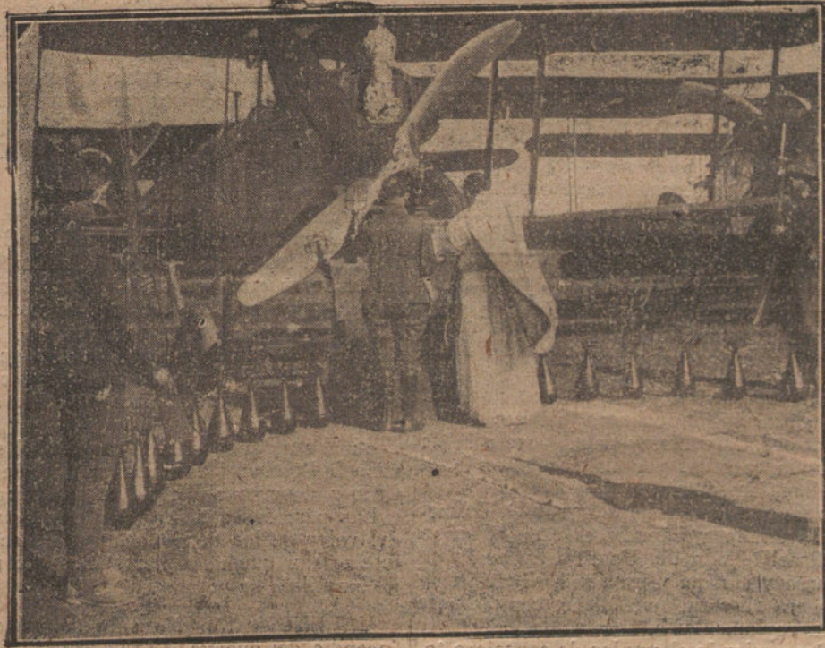
MISA DE CAMPANA CELEBRADA EN TAHUIMA EL DIA DE LA FIESTA DE NUESTRA SEÑORA DE LORETO, PATRONA DE LA AVIACION