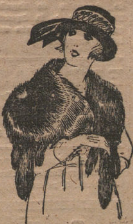
Cuello piel Renardina, en blanco, marrón, gris y negro.