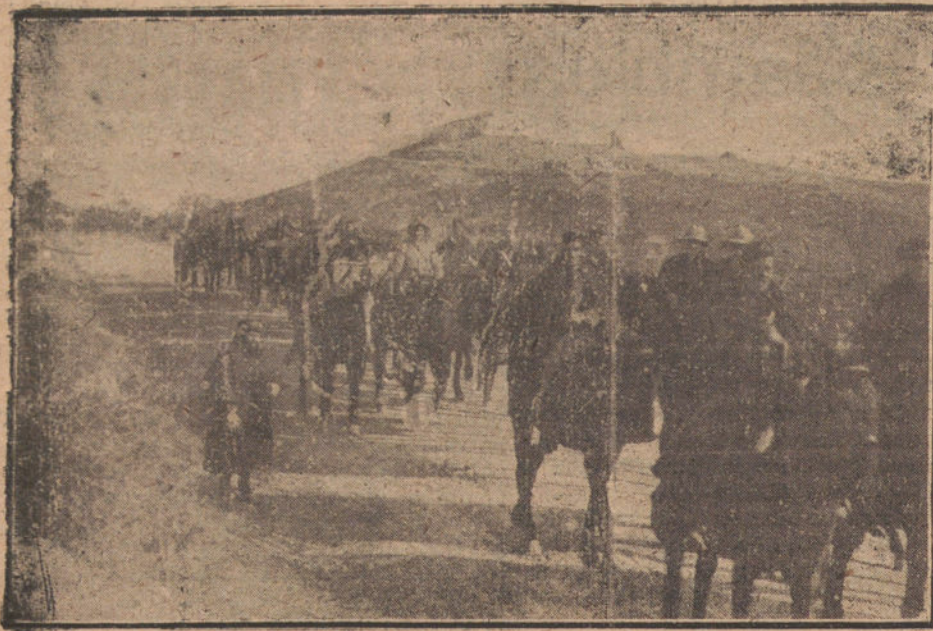
COLUMNA DE ARTILLERIA LIGERA A SU MARCO POR LA DISEÑACION DE MULEY