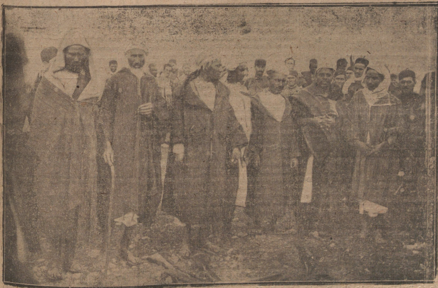
JEFES DE LAS CABILAS QUE SE SOMETIERON A NUESTRAS TROPAS, ENTREGANDO LAS ARMAS