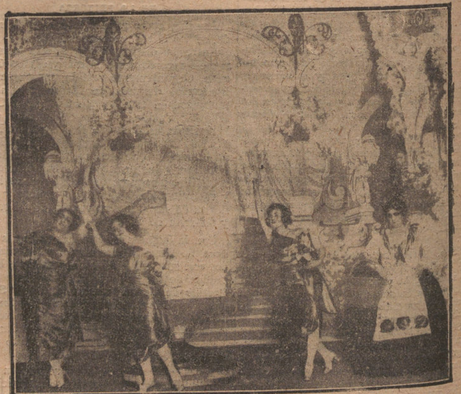
UNA ESCENA DE «LA HOJA DE PARAY», ZARZUELA EN UN ACTO QUE SE ESTRENA ESTE NOCHE EN MARTIN

Restaurante Novelty, Carrera de San Jerónimo, 15 (entresuelo). Cubiertos de 2, 2,50 y 3 pesetas. Abonos de 45, 60 y 75 pesetas las treinta comidas.