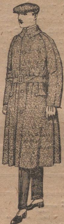
Gabanes de patén cheviot o cover.

Ropas confeccionadas para caballero, señora, niño y niña