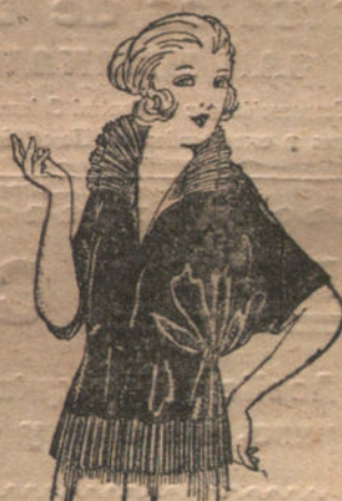
Blusas de charmeuse, granadina, etc., en negro, azul y color.