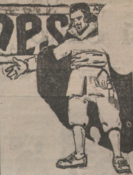
Los de Apolo