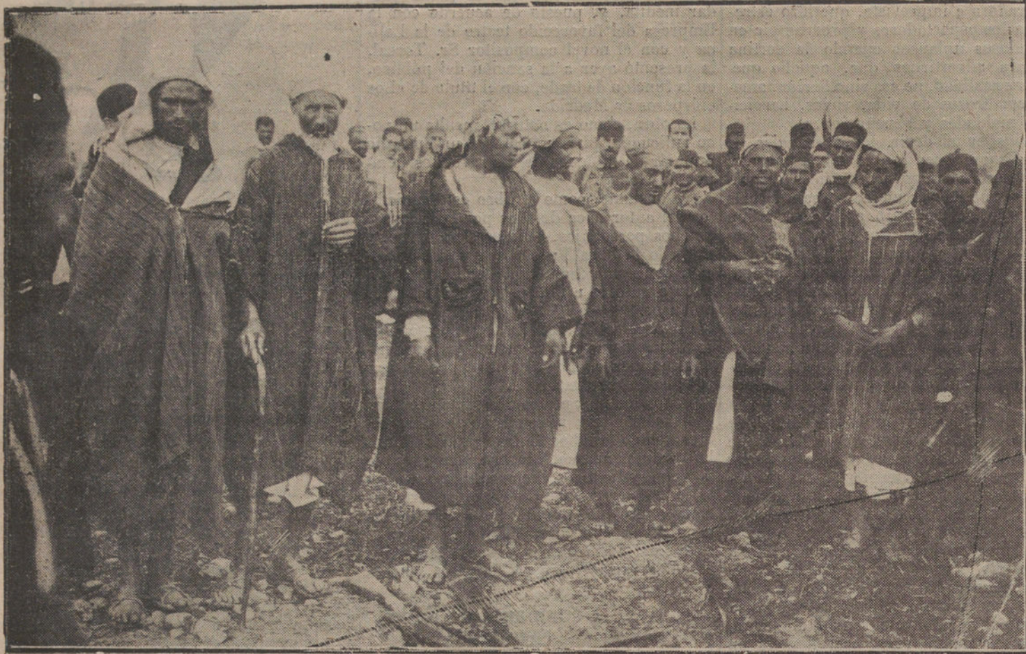
ESTAMPAS DE LA GUERRA.—ANTIGUOS REGULARES DESERTORES DEL EJERCITO DE MELILLA, QUE FUERON HECHOS PRISIONEROS CUANDO DISPARABAN CONTRA NUESTRAS TROPAS Y QUE RECIBIERON EL MERECIDO CASTIGO