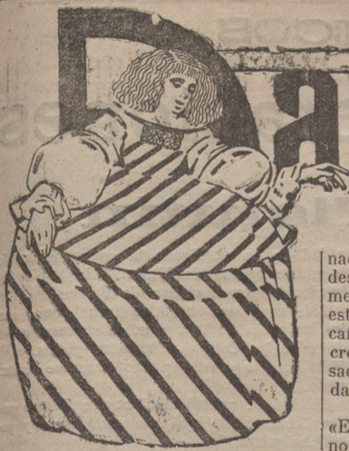
"En el llano"