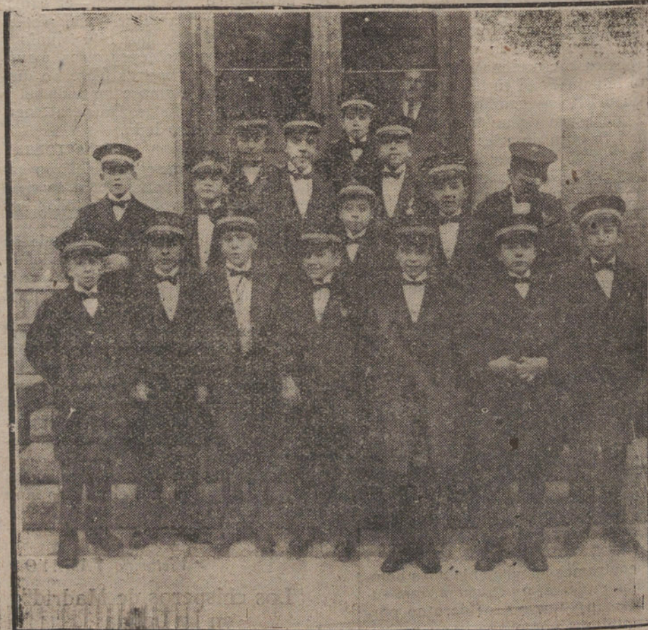
EL SORTEO DE HOY.—GRUPO DE LOS NIÑOS DEL COLEGIO DE SAN ILDEFONSO QUE MANTARON LOS NUMEROS Y LOS PREMIOS

El torpedero «Villamil» volverá a Alhucemas con el representante de la Cruz Roja, Sr. Almeida.