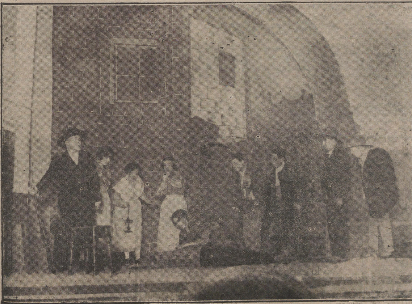
ESCENA FINAL DE «EN EL LLANO»

Acudieron muchos farmacéuticos de Madrid, y los de Barcelona estaban representados por dos compañeros.