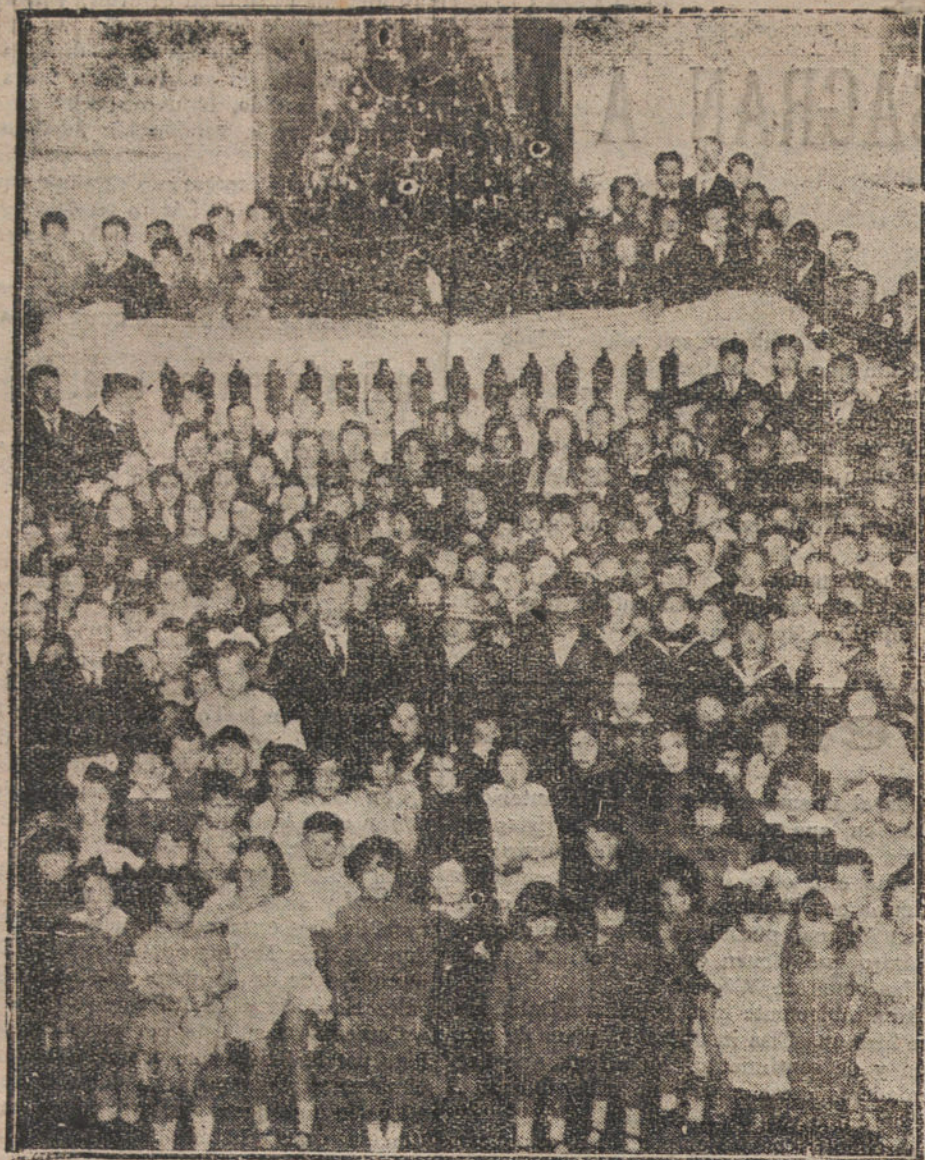
EN EL COLEGIO ALEMÁN.—LOS EMBAJADORES DE ALEMANIA EN LA «FIESTA DEL ÁRBOL», QUE SE CELEBRA CON GRAN SOLEMNIDAD