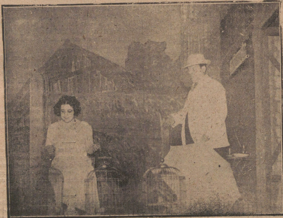
EN APOLO.—UNA ESCENA DE «LA GUILLOTINA», ESTRENA ANOCHÉ

MALAGA. Con motivo de la detención ilegal de un alguacil del Juzgado, los funcionarios judiciales han elevado una protesta al gobernador; pero éste ha ordenado que dicho alguacil continúe en la cárcel, donde está desde el día 2 del actual.