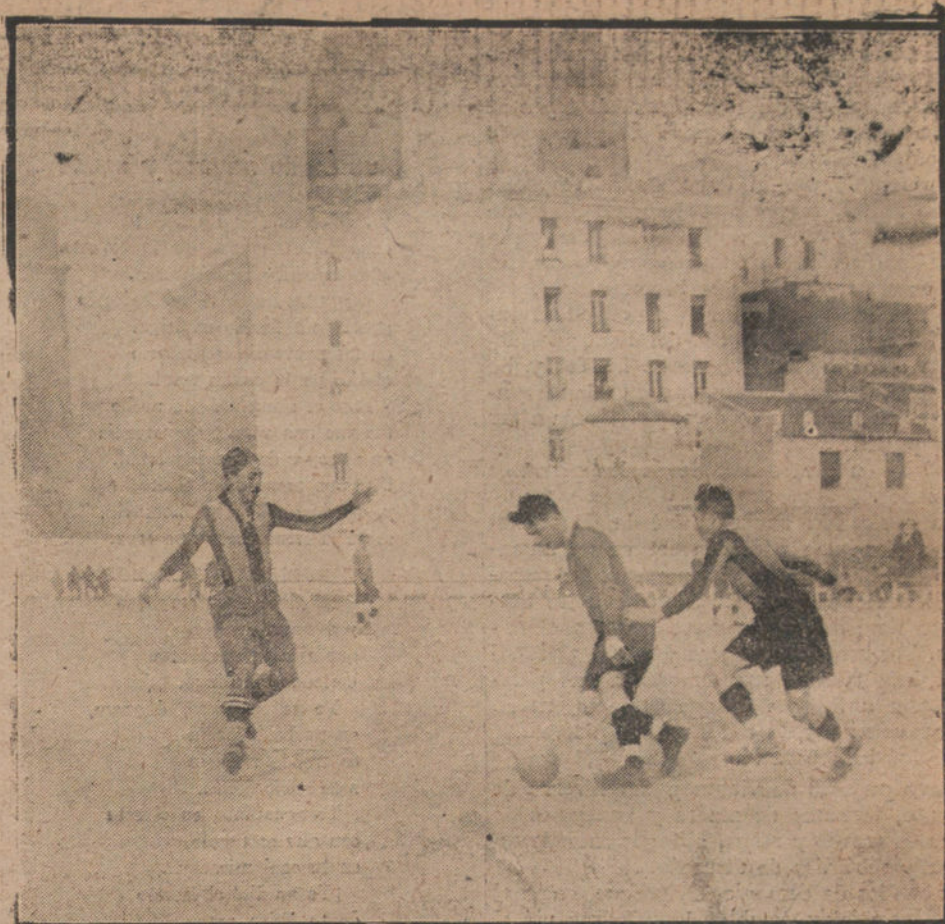
LOS DEPORTES EN MADRID.—UN MOMENTO DEL PARTIDO DE «FOOT-BALL» JUGADO AYER ENTRE EL RACING DE MADRID Y EL RACING DE MIERES

BURDEOS. El vapor español «Dolores» encalló anoche cerca de este puerto. Se confía en poder salvar el buque.