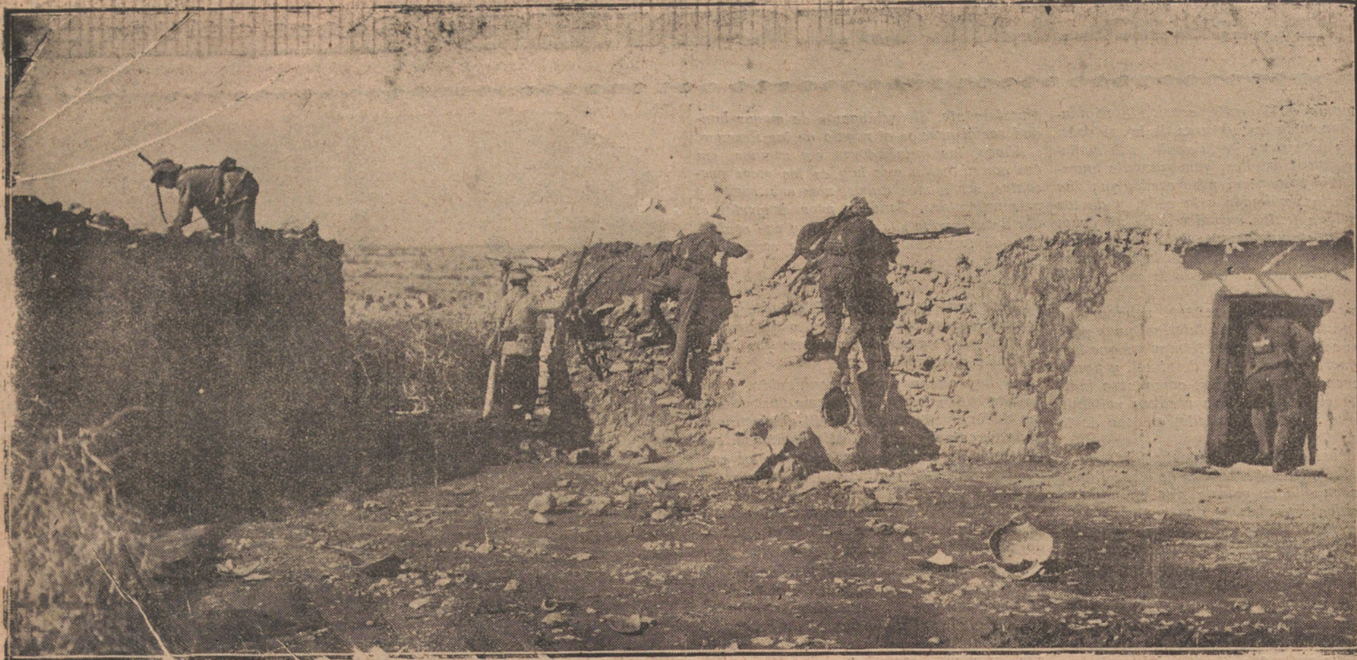
MELILLA.—OCUPACION DE SIDI-SARDIK. OCUPACION DE UNA CASA MORA POR EL BATALLON DE BURCS