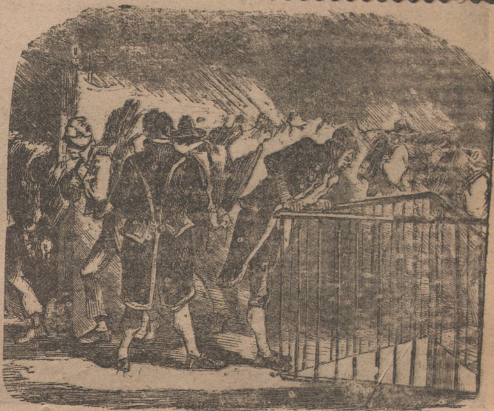
INFLUENCIA MORAL EJERCIDA POR LOS PRETENDIENTES CERCA DEL MINISTRO EN LOS DIAS DE PASCUA

No hay que escatimar el aguinaldo. No hay que decir irreparablemente que no, esta única vez que es demandado el aguinaldo. Os quedaría una sombra de arrepentimiento difícil de disipar si le dejáis ir con las manos vacías al que os ha pedido esa modesta cantidad con que reveláis vuestra gratitud de todo el año.