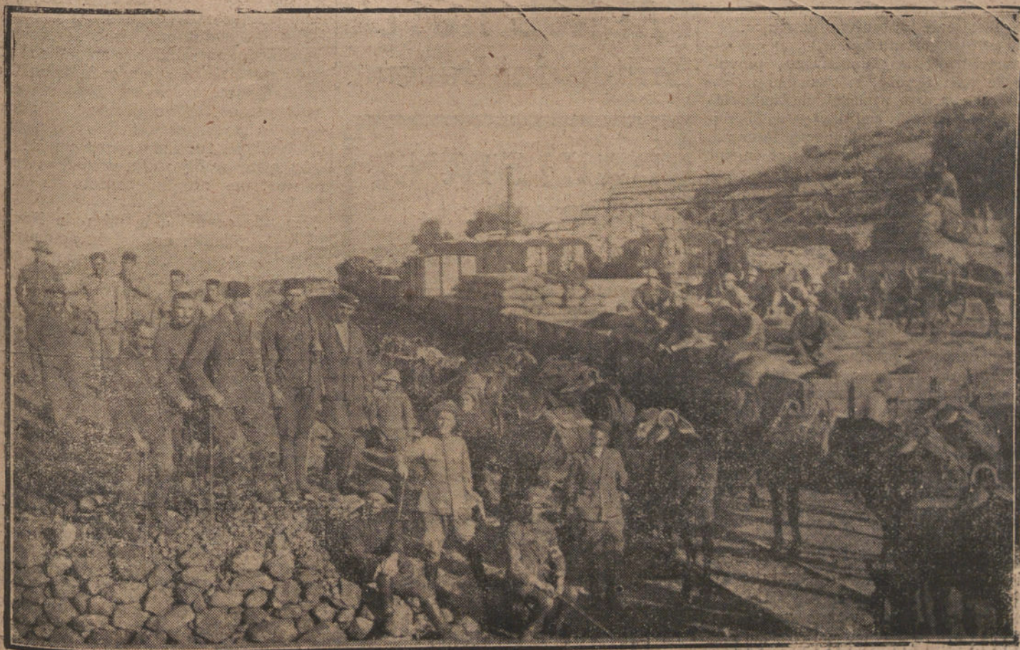
ESTAMPAS DE LA GUERRA.—EL TREN DE LA COMPAÑIA ESPAÑOLA DE MINAS DEL RIFF, EMPLEADO EN LOS SERVICIOS MILITARES, A SU LLEGADA A LA ESTACION DE SEGANGAN

—Es preciso que todo el mundo se penetre de que hay que comprobar en la realidad