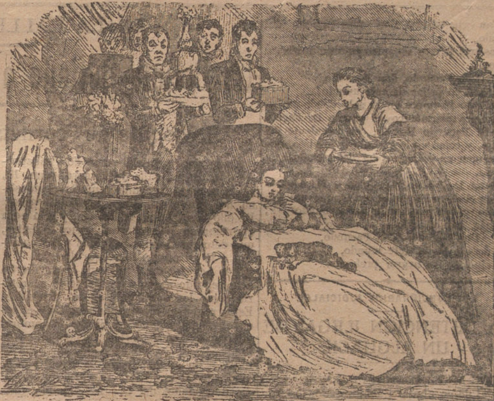
Siempre es tener amantes necesario, más al llegar la Pascua, sobre todo, porque llenan el alma... y el almar.

No hay que escatimar en el aguinaldo. No hay que asustarse demasiado. Hay que aceptar la sacaliña proverbial. Hay que acercar el modesto peculio de los que festejan estos días y salvarlos de los gastos extraordinarios. El resto del año vamos a gozar en puntualidad y en amabilidad.