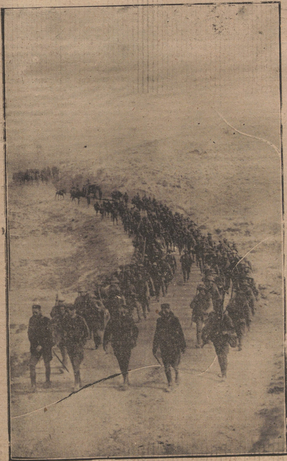
ESTAMPAS DE LA GUERRA.—UNA COLUMNA MARCHANDO HACIA EL CAMPAMENTO (Fot. LAZARO).

Tras de su marmórea efígie de César o de la antigüedad ella adivinó en alma refinada y exquisita. Su sutil perspicacia creyó descubrir al romántico y apasionado meridional bajo su frío aspecto de hombre del Norte.