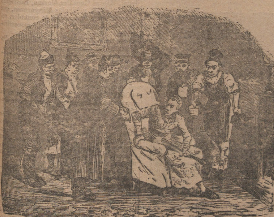
Esto es un horror, aquí no hay leyes, pero no daré un cuarto el año entrante si muero un mes siquiera antes de Reyes.

En Zaragoza se comenta con regocijo la irritación de los jugadores burlados.