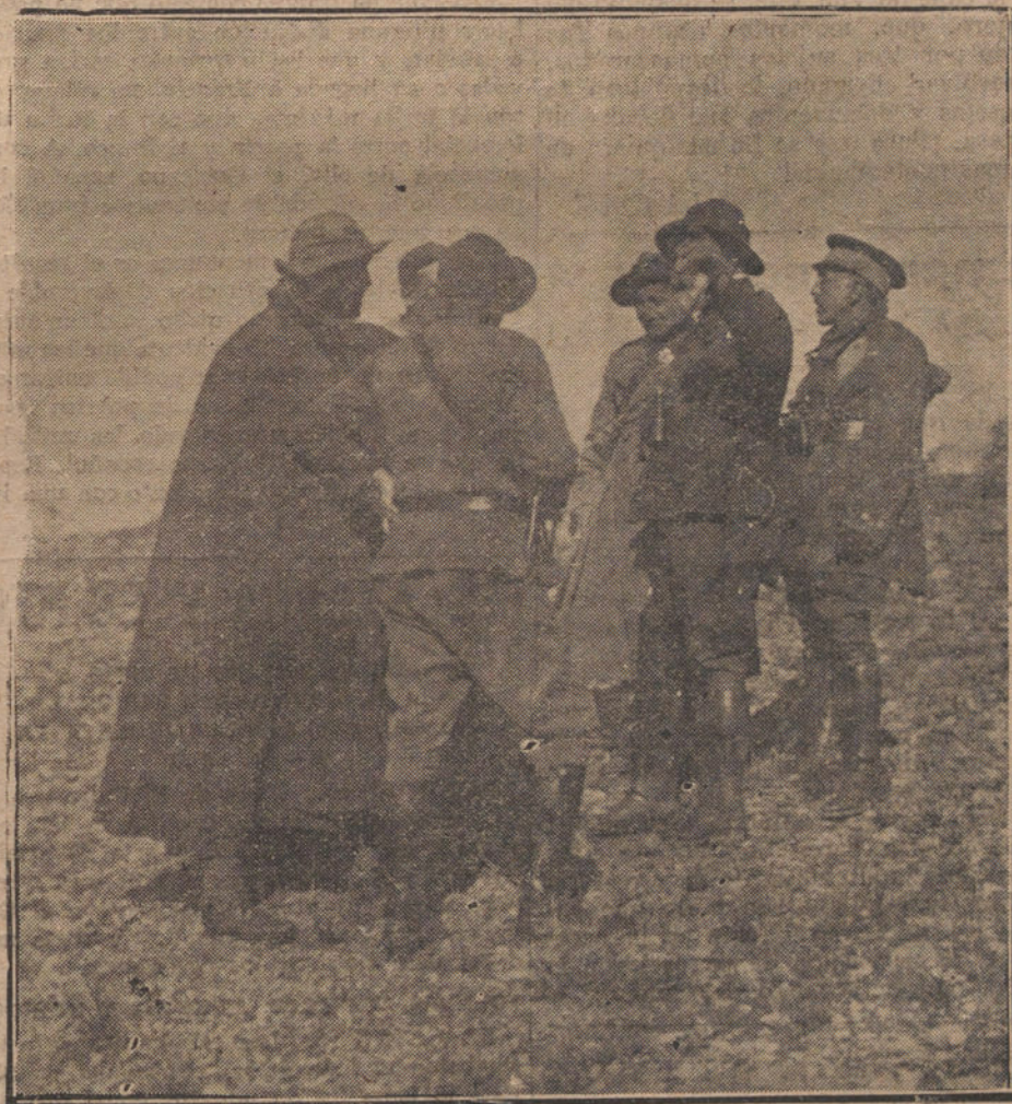
ESTAMPAS DE LA GUERRA.—EL GENERAL CABANELLAS DANDO INSTRUCCIONES A LOS JEFES DE SU COLUMNA DURANTE UN AVANCE

Cuanto se dice de divergencias entre el Sr. Cambó y yo, es una historia mal urdida, a la que no se puede dar crédito.»